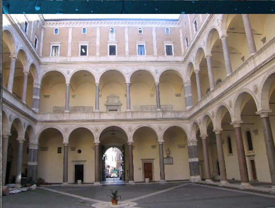
палаццо делла Канчеллера