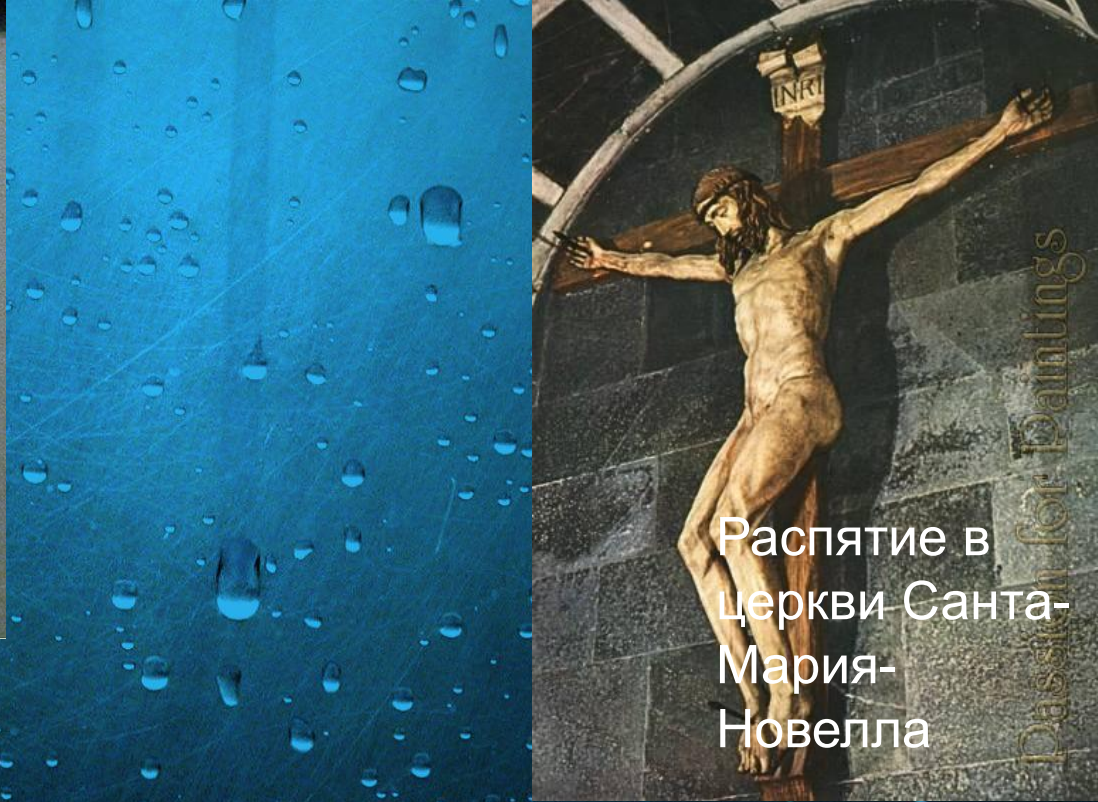
Распятие в церкви Санта- Мария- Новелла