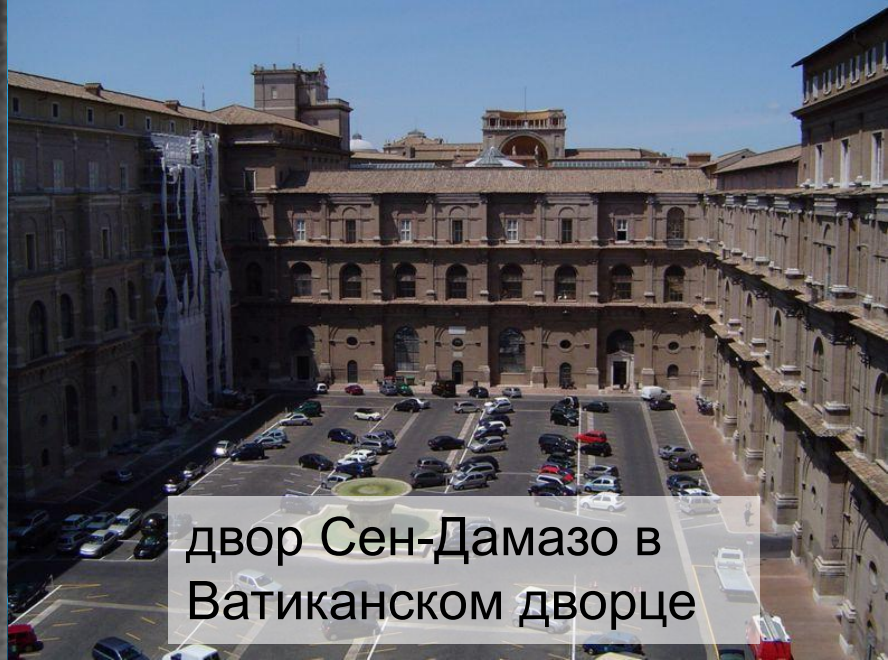
двор Сен-Дамазо в Ватиканском дворце