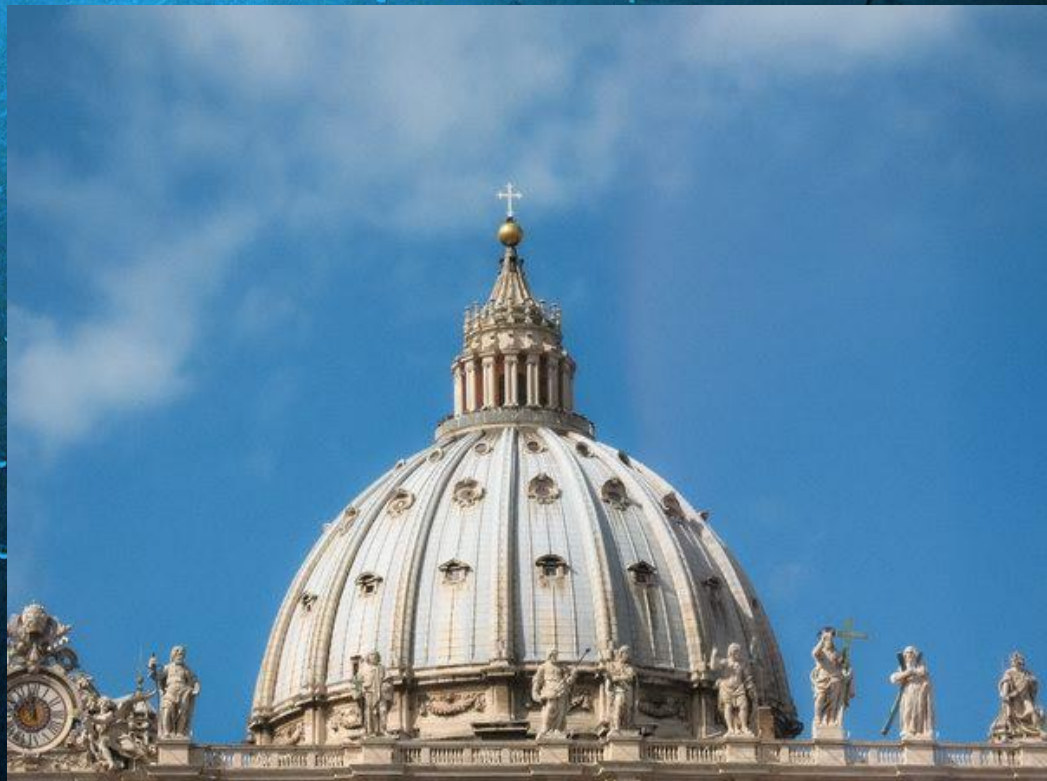
купол Собора Святого Петра