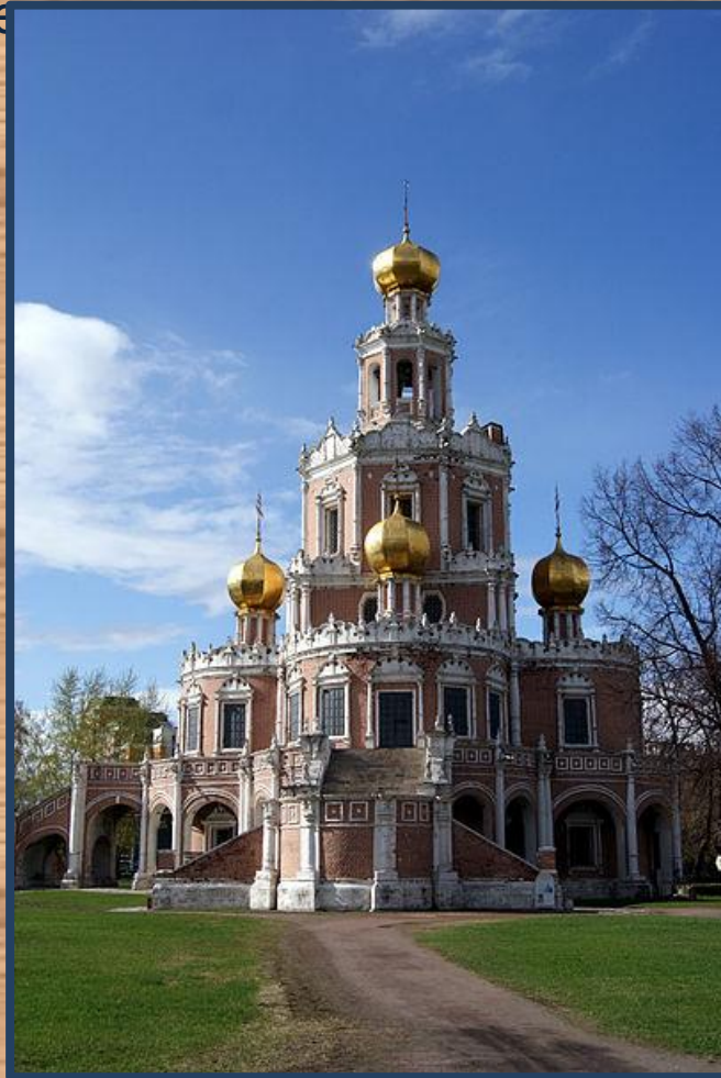
Церковь Покрова в Филях

К концу 17 века в русской соборной архитектуре появился новый стиль, названный нарышкинское или московское барокко. Свое название стиль получил по фамилии основного заказчика. Этому стилю соответствует сочетание белого и красного цветов в росписи фасадов зданий, этажность построек. Примеры строений в этом стиле – церкви и дворцы Сергиева Посада, церковь Покрова в Филях, колокольни, трапезная и надвратные церкви в Новодевичьем монастыре