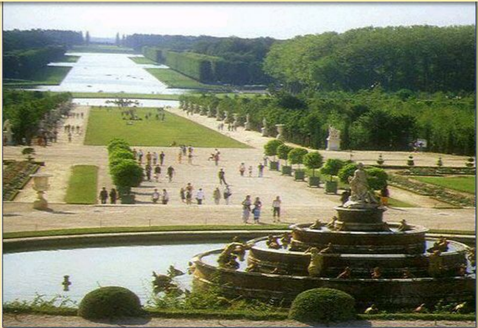
Версальский парк под Парижем