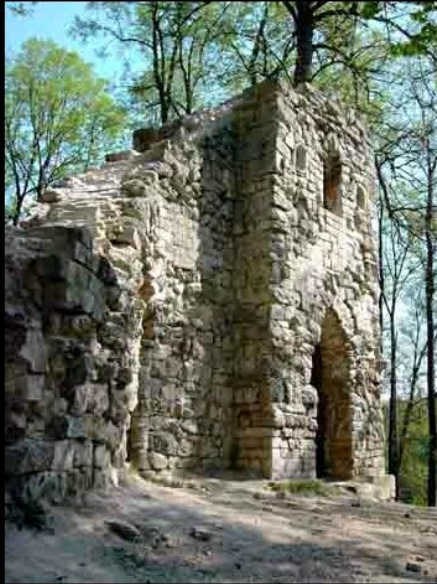
Дворцово-парковый ансамбль в Царицыне