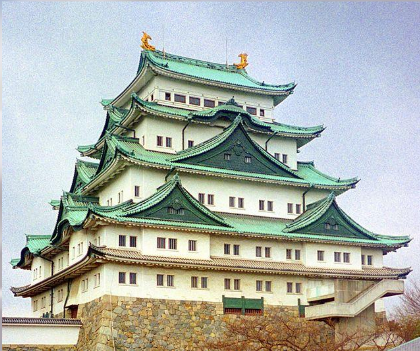
Здание Японской архитектуры