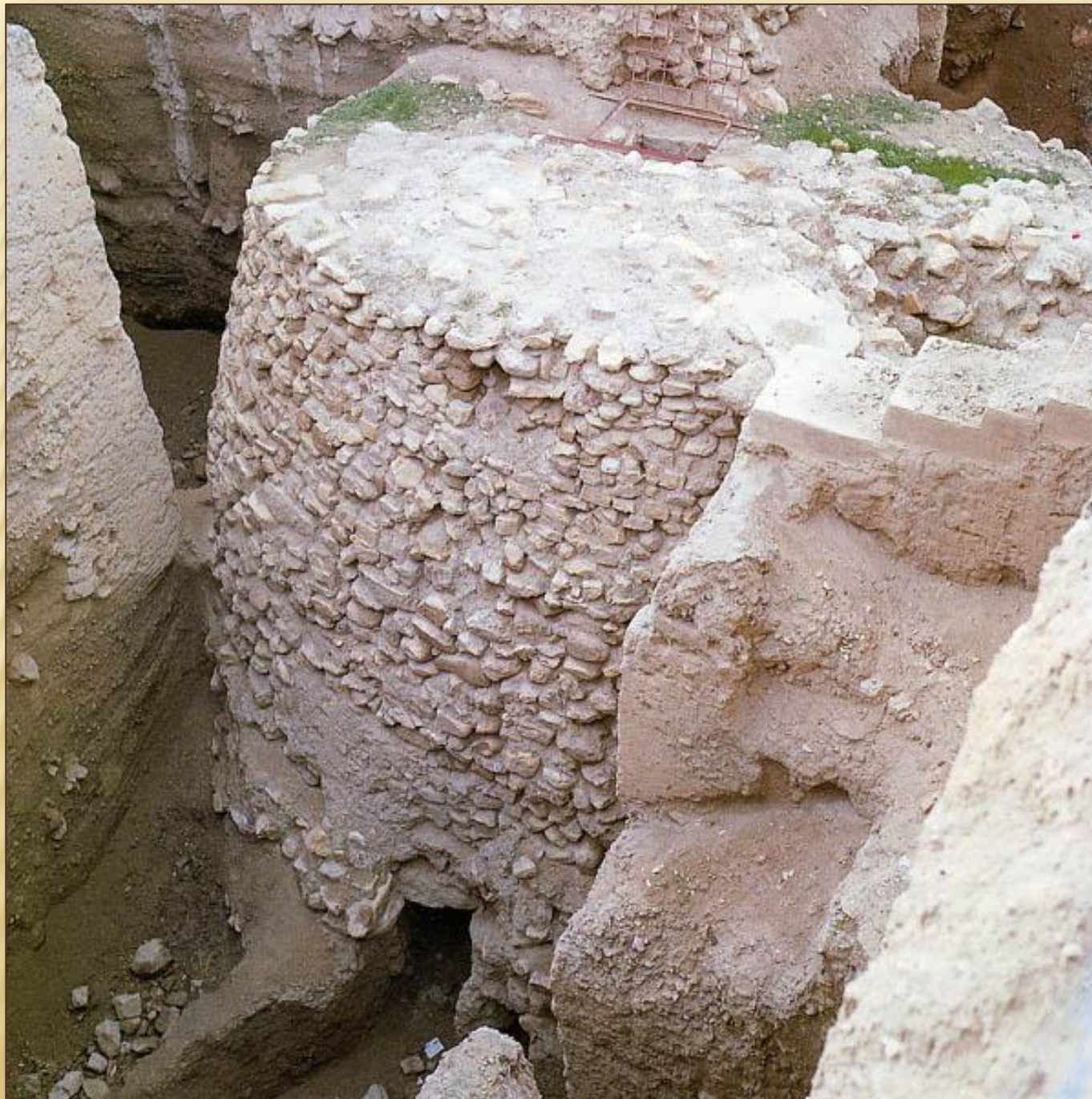
Иерихон. Поселение. Израиль.