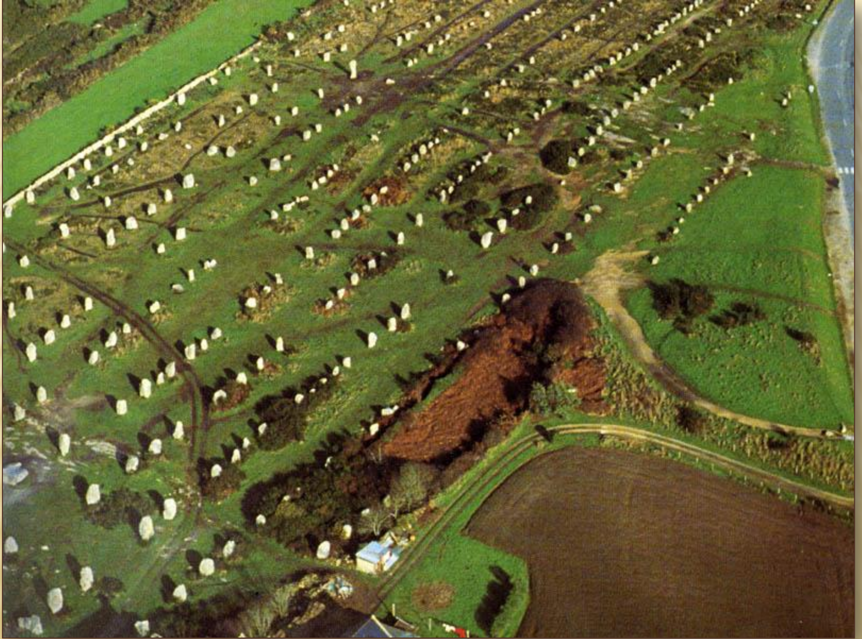
Менгиры в Карнаке. Франция