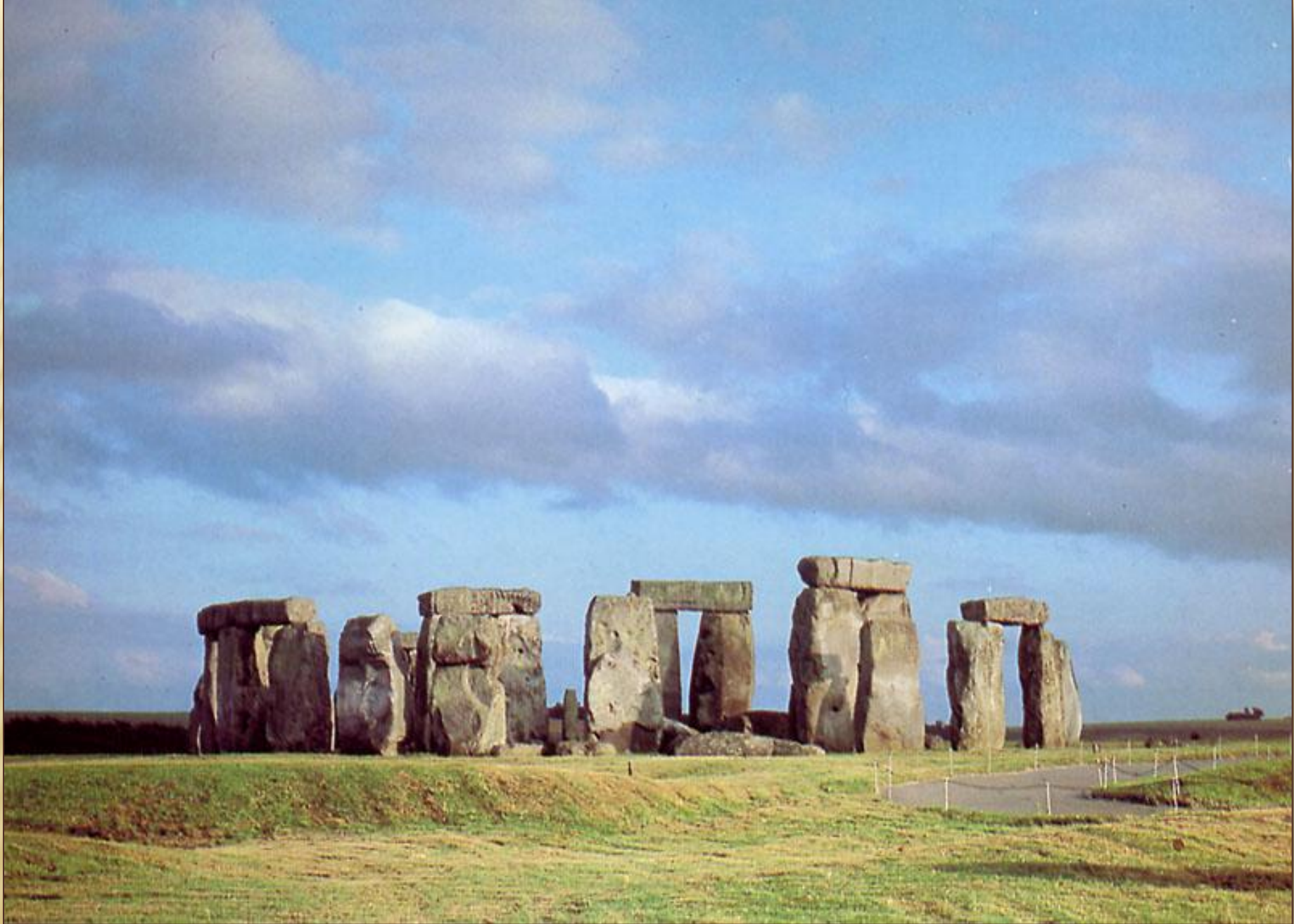
Стоунхендж. Солсбери. Великобритания.