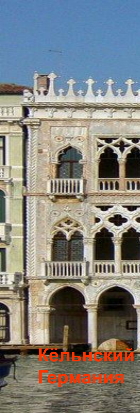
Кёльнский собор Германия