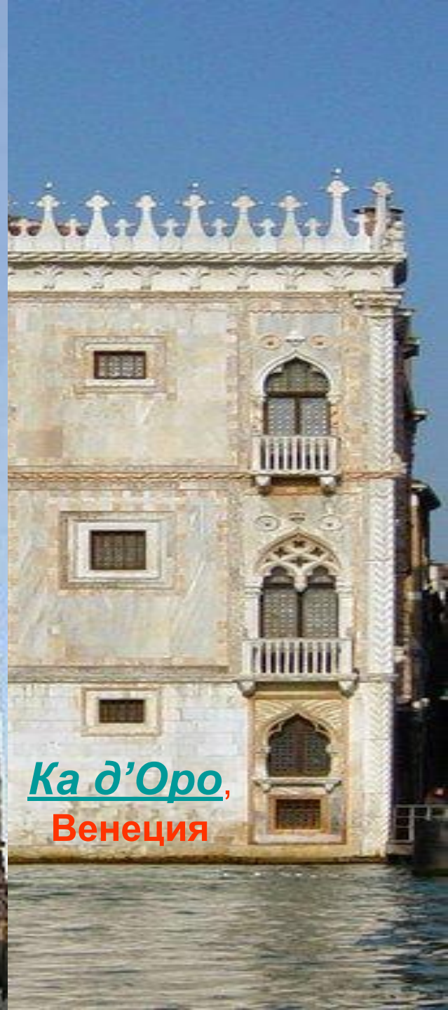
Ка д'Оро , Венеция