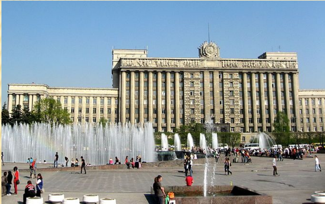
Дом Советов. Арх. Н. А. Троцкий, Я. Н. Лукин, М. А. Шепилевский и др. 1936—1941

Отличительными чертами стиля являются преимущественно крупные архитектурные формы, включая целые ансамбли, частое применение различных архитектурных ордеров, богатая по тому времени наружная отделка с барельефами, скульптурами, рустикой, наличниками, применение бетона, металла, натурального камня. В официальных зданиях предусматривалась богатая отделка интерьеров, в жилых домах — улучшенная планировка, наличие всех инженерных систем.