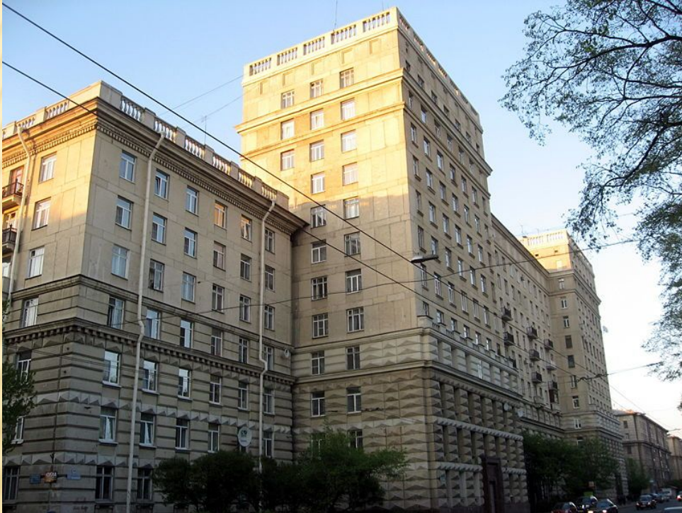
Первый 12-этажный дом на ул. Кузнецовской, 44. Арх. Журавлев (в соавторстве с арх. А.Д. Кацем и инженером Н.И. Дюбовым)

Для советского минимализма характерны крупнопанельные жилые, общественные и производственные здания, отличающиеся отсутствием каких-либо элементов отделки на фасадах, кроме окраски или облицовки керамическими плитками. Наряду с крупнопанельными домами возводили и крупноблочные здания, а также кирпичные дома. Строительные нормы и правила, введённые в 1955—1957 годах, предусматривали минимум удобств для жителей: комнаты размером 9-12 м 2 , высоту помещений 2,5 м, совмещённые санузлы и др. Однако в то время индустриальное строительство привело к быстрому улучшению жилищных условий сотен тысяч горожан, многие из которых впервые получили отдельные квартиры.