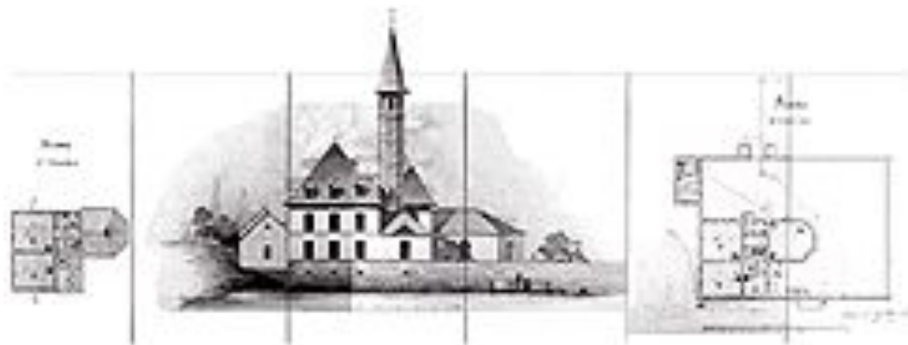
Дмитриев Н.В. Чертежи дворца