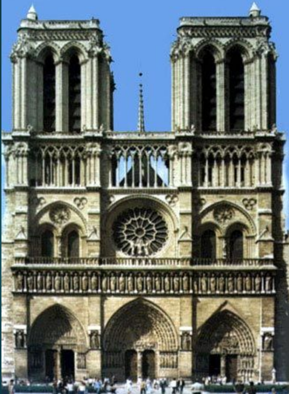
Собор Нотр-Дам в Парижі