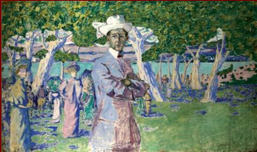
Портрет Н.А. Соловьева