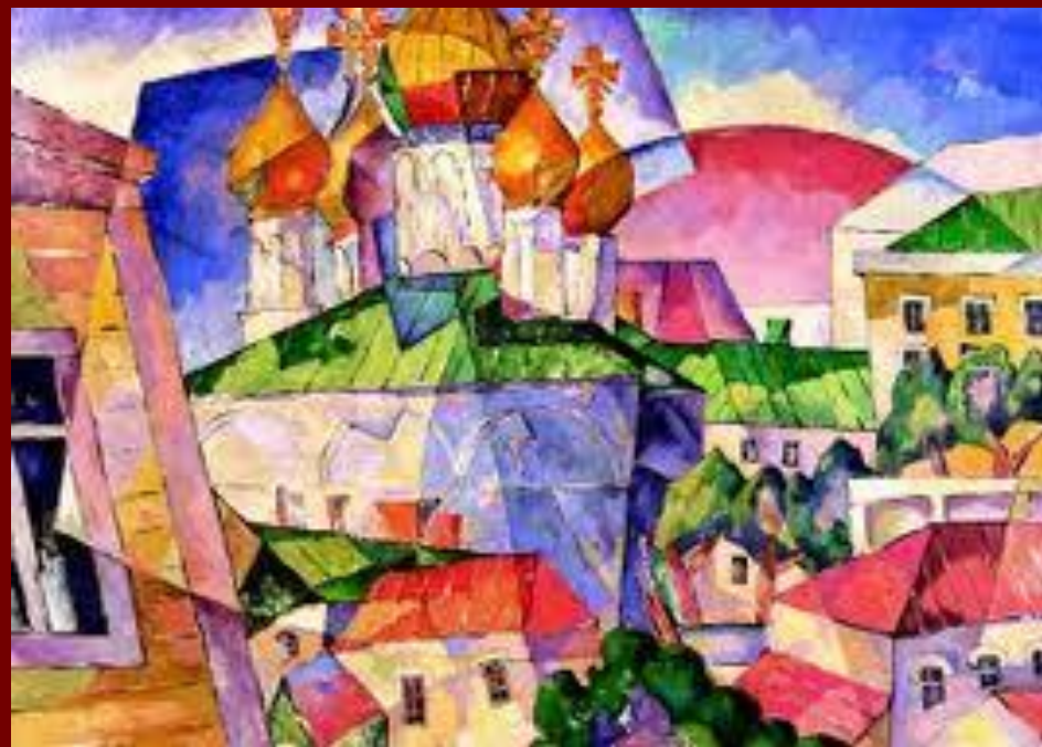
На Петровке .