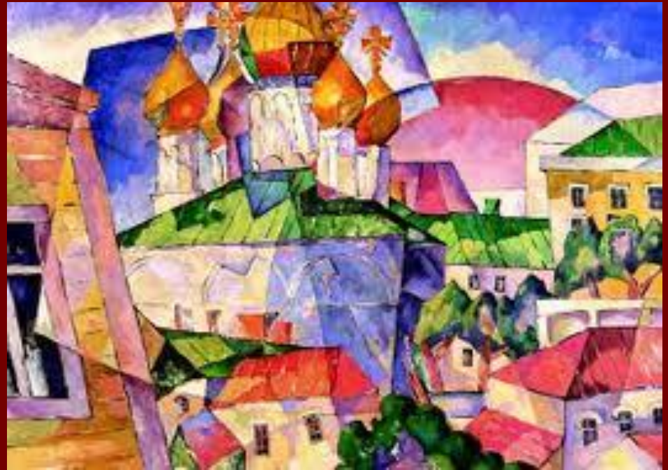
На Петровке .

■ Испытывая в 1910-е гг. воздействие кубизма, футуризма и орфизма, Лентулов, вместе с тем стремился придать своим образам отчётливый национальный характер, обращаясь к мотивам древнерусского зодчества, осмысляя традиции иконописи и лубка.