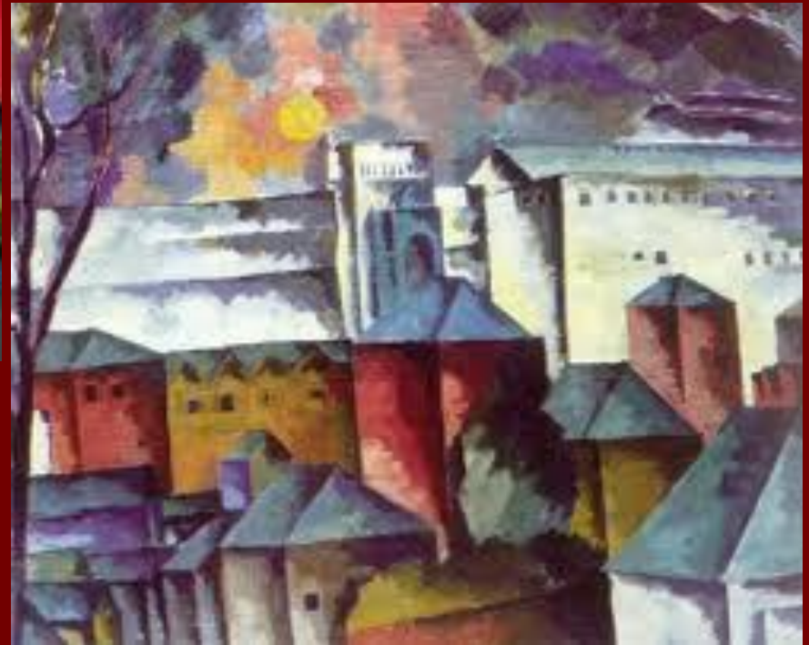
Пейзаж с монастырской .