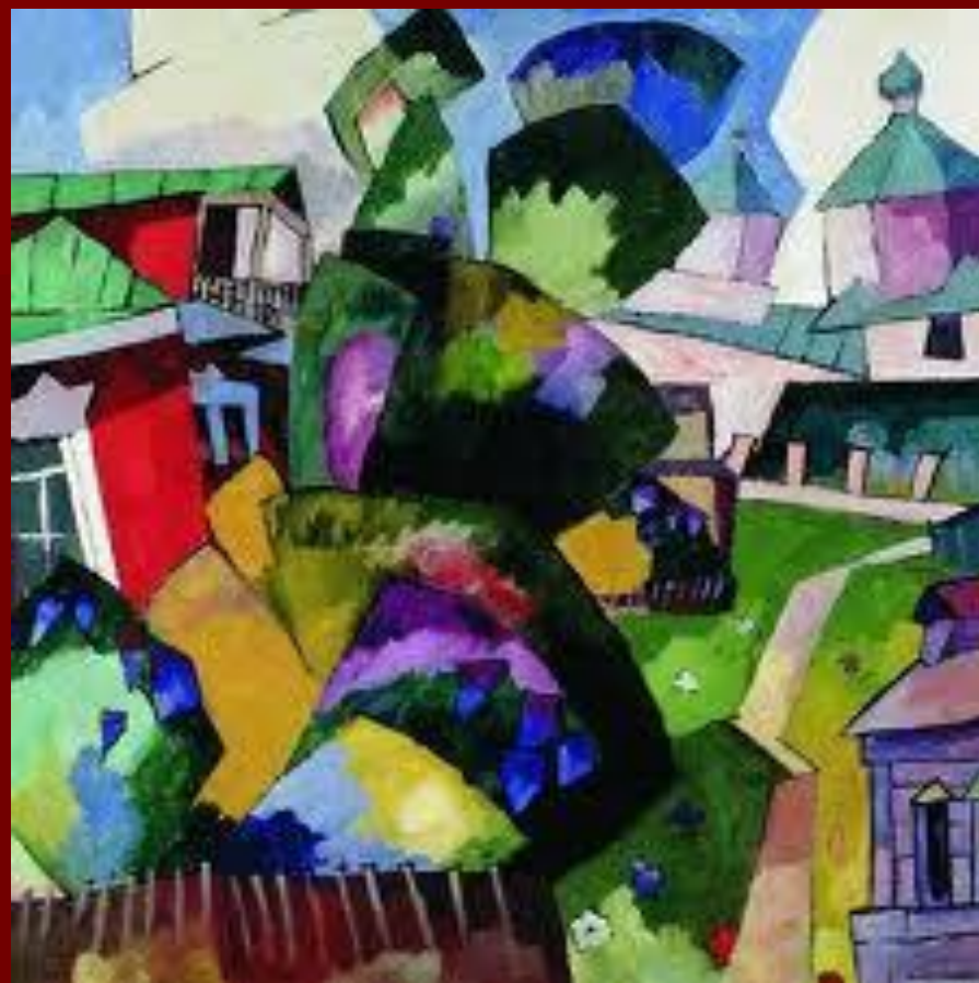
Деревянная церковь. 1918.