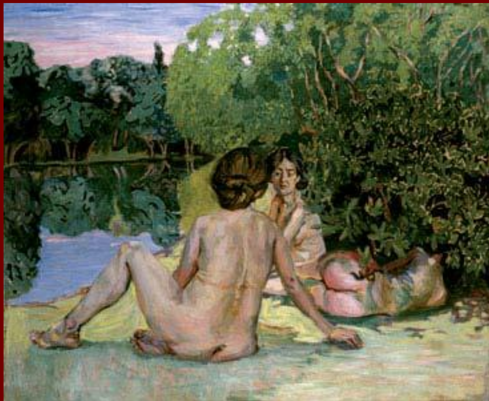
Купальщицы. На Суре.