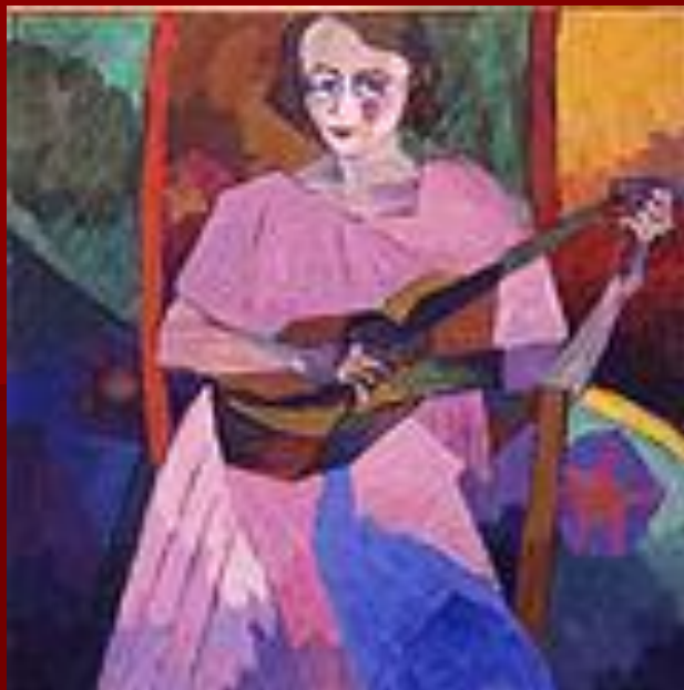
Женщина с гитарой