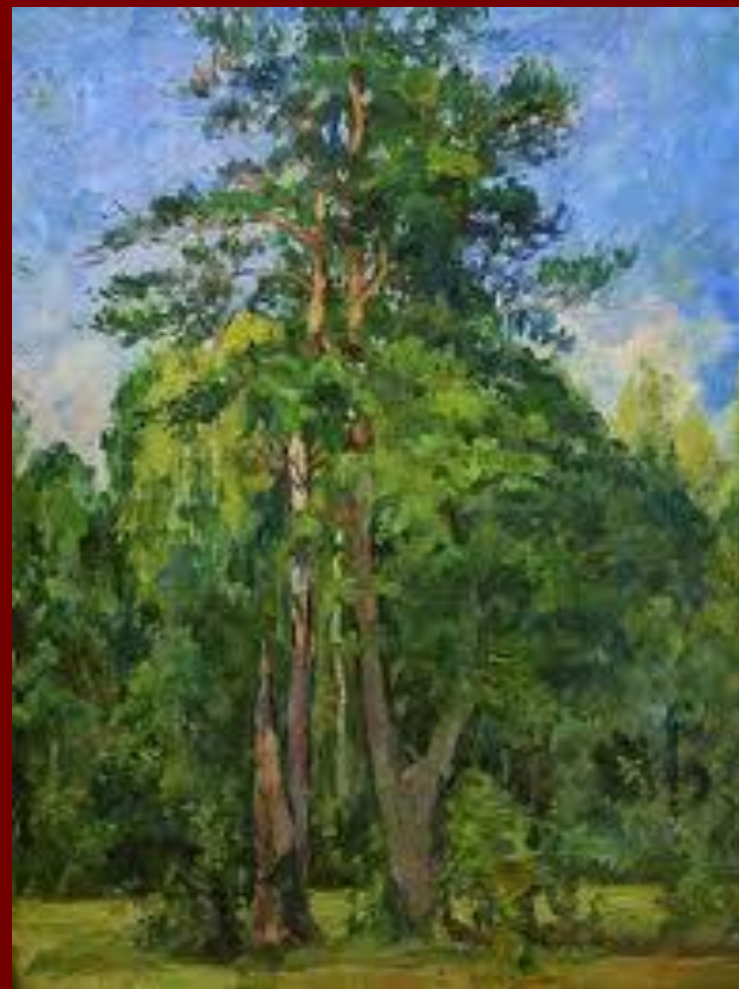
Деревья. Конец 30-х - Начало 40-х