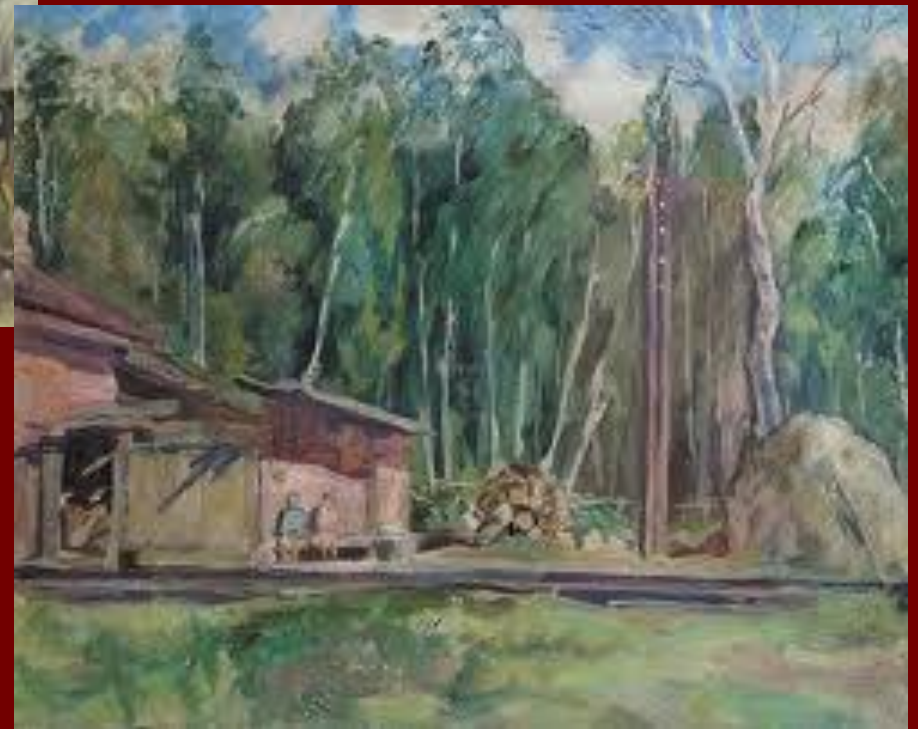
Пейзаж с железнодорожной будкой. 1940