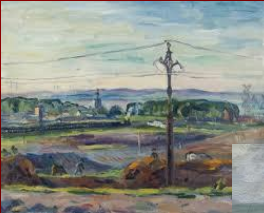
В Окрестностях Москвы. 1940