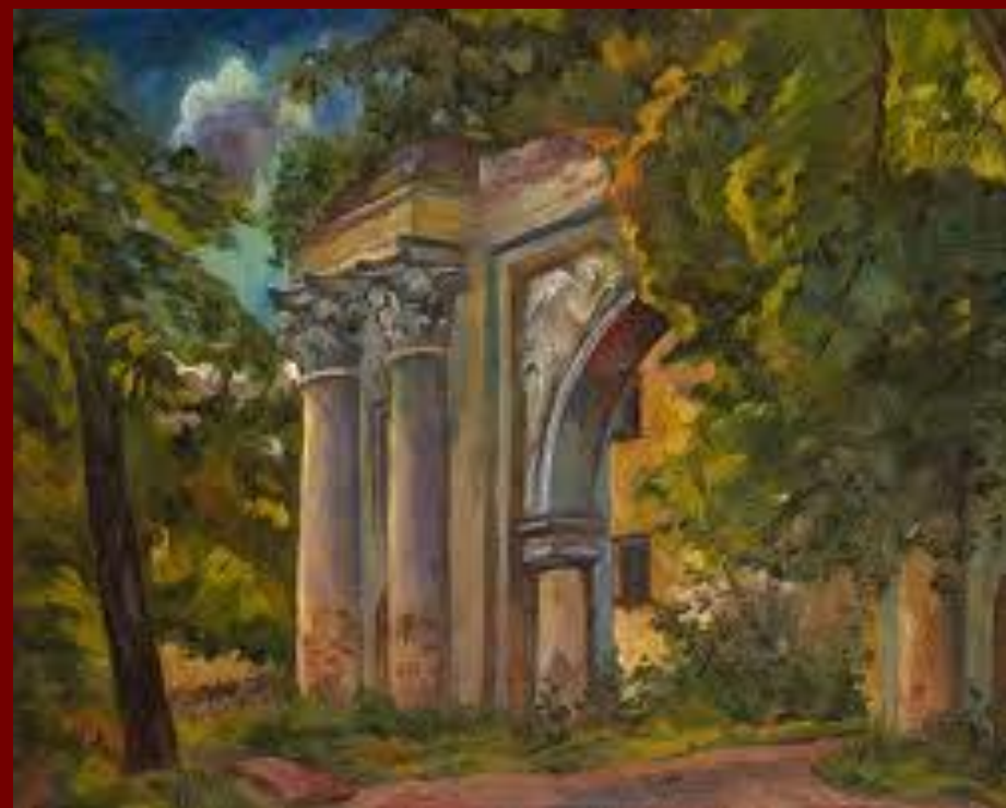
Архангельское. Старинные ворота.