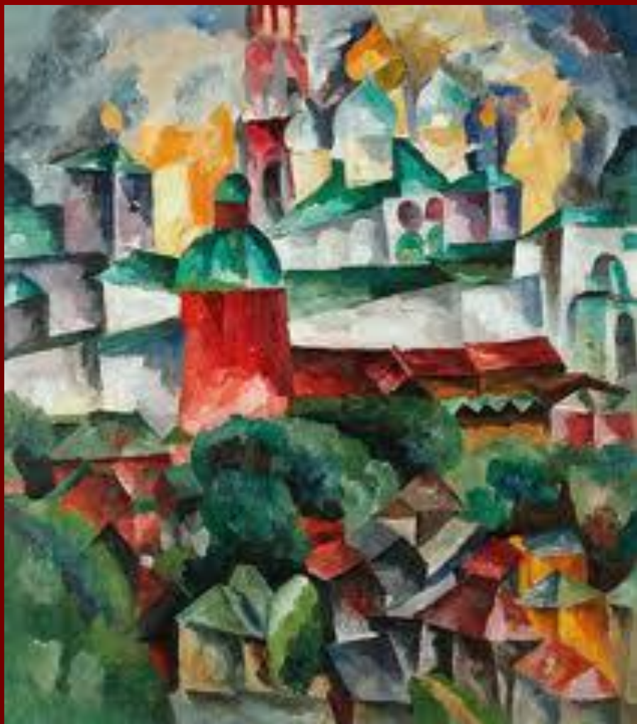
Пейзаж С Лаврой. 1918-1919