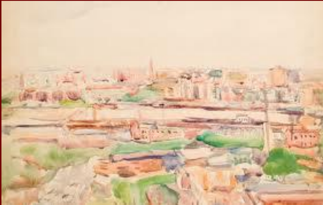
Эскиз города. Композиция №7. 1930-е Бумага, акварель.

В 1933 году состоялась единственная прижизненная персональная выставка Лентулова на которой, наряду с картинами, написанными в советское время были представлены все его знаменитые произведения середины 1910-х годов, выставлявшиеся на выставках "Бубнового валета".