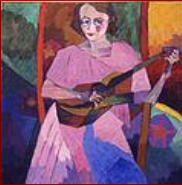
Женщина с гитарой