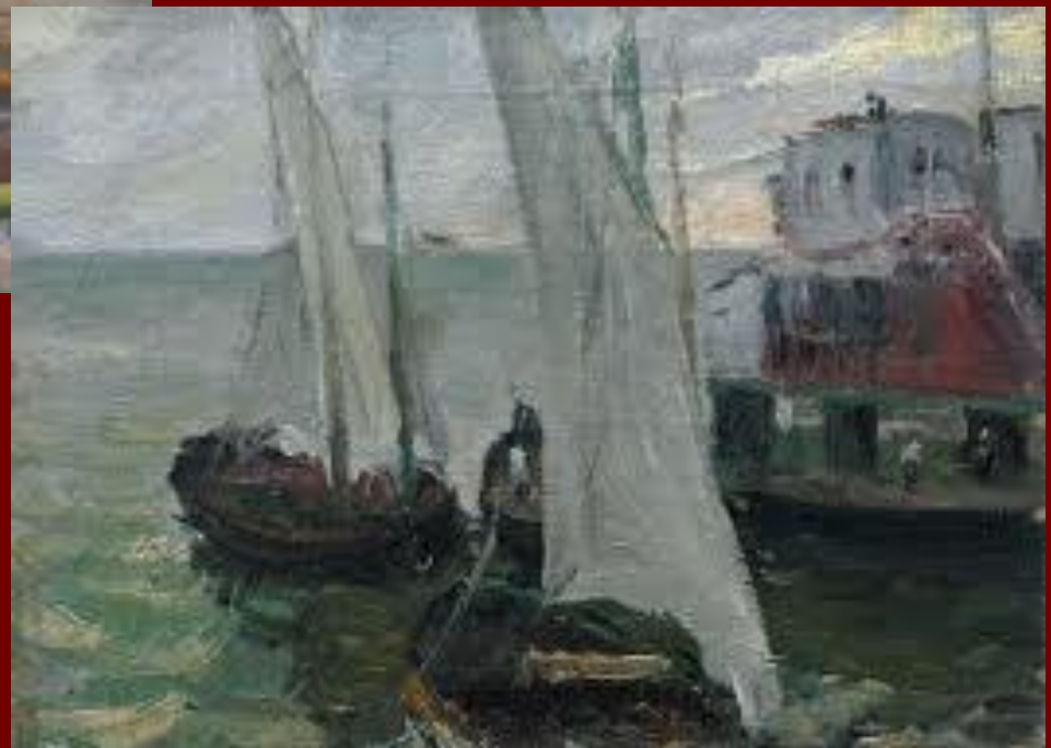
Морской Причал. 1932