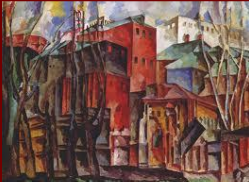
Пейзаж с сухими деревьями и высокими домами . 1920г.

Пронизанные ощущением полноты бытия, они ближе к натуре, жизненным прообразам.