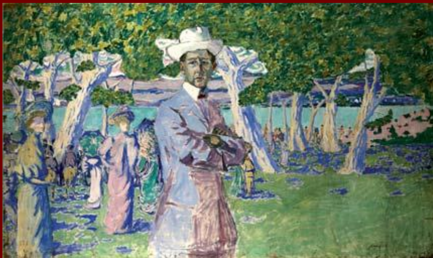
Портрет Н.А. Соловьева