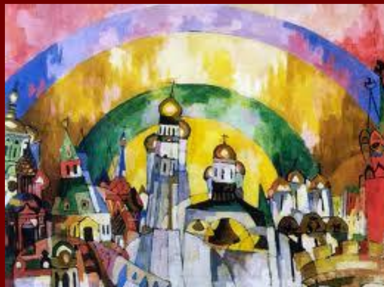
Небосвод. Декоративная Москва. 1915 г.