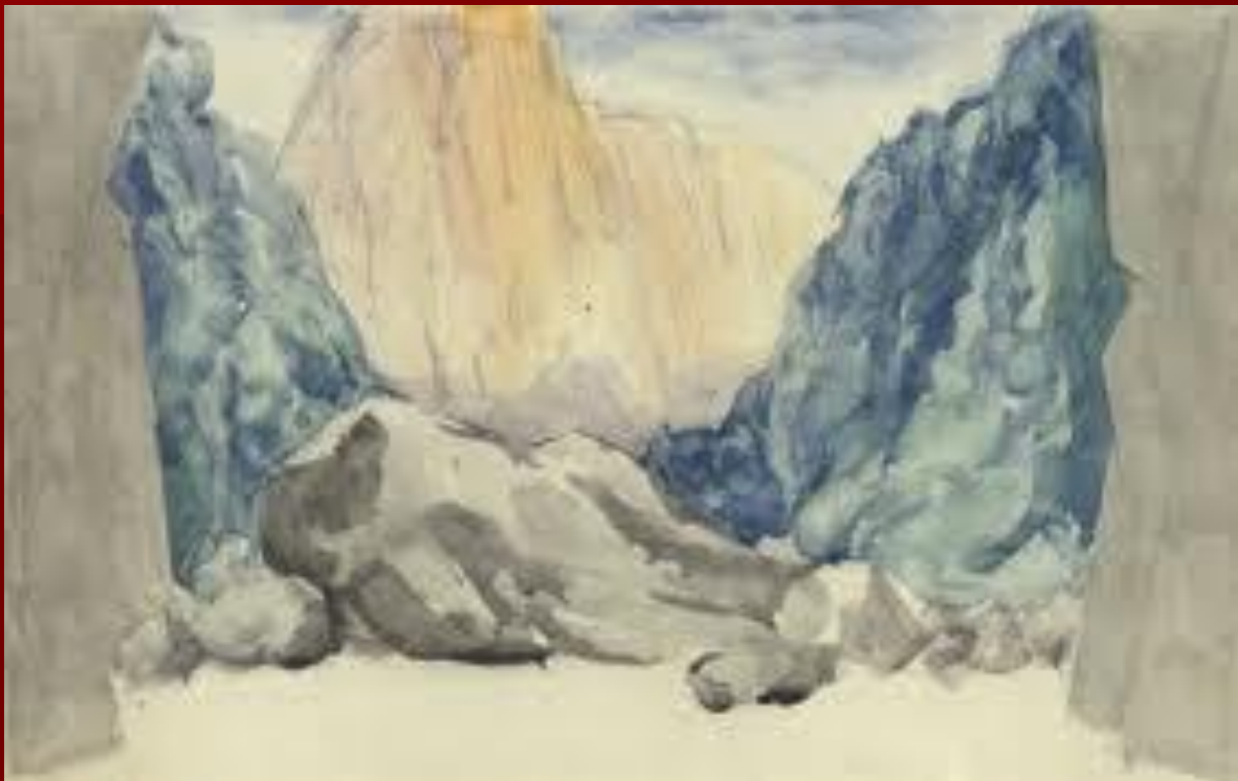
Горы. Эскиз Докорации. Вторая Половина 1920-х