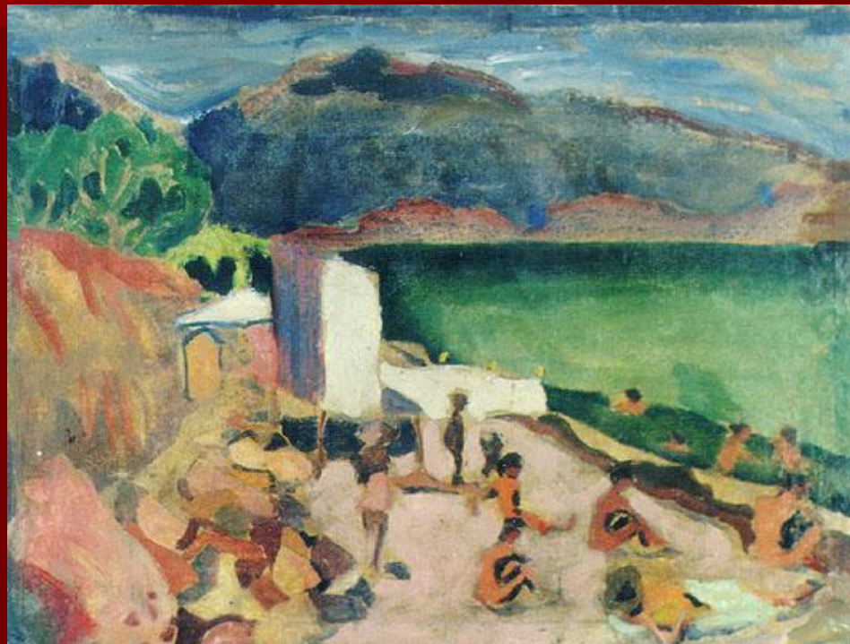
На пляже 1909г.