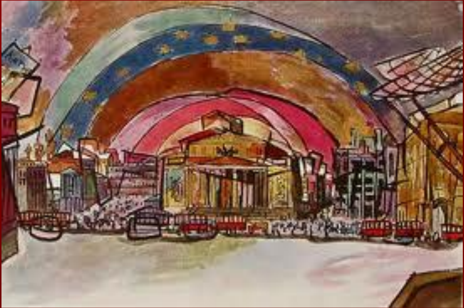
Эскиз декорации к трагедии В. Маяковского

Выступал также как театральный художник.