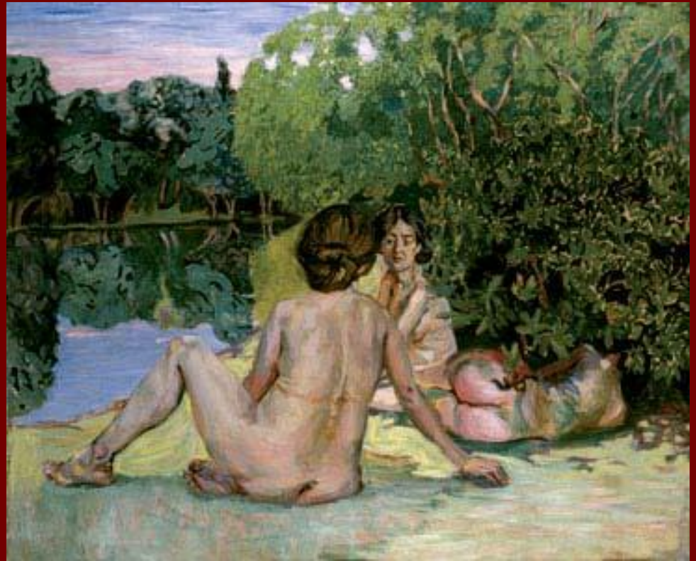
Купальщицы. На Суре.