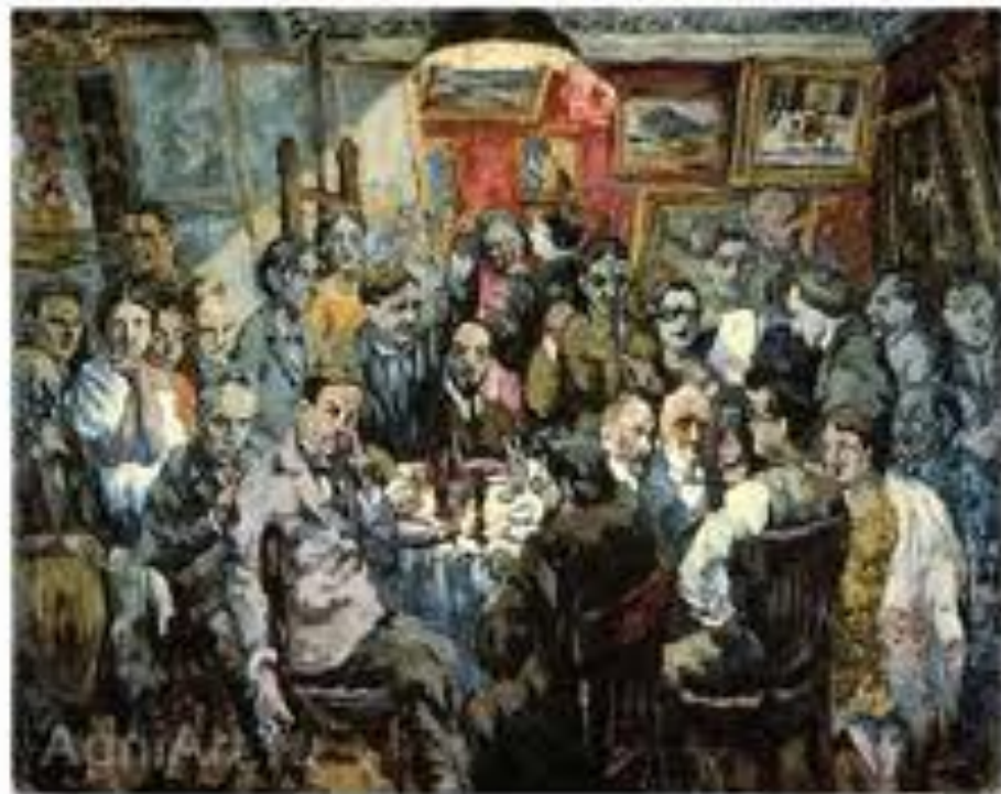
Групповой портрет московских художников.

В 1927 году Лентулов задумал написать большой групповой портрет членов созданной им Организации московских художников (ОМХ).