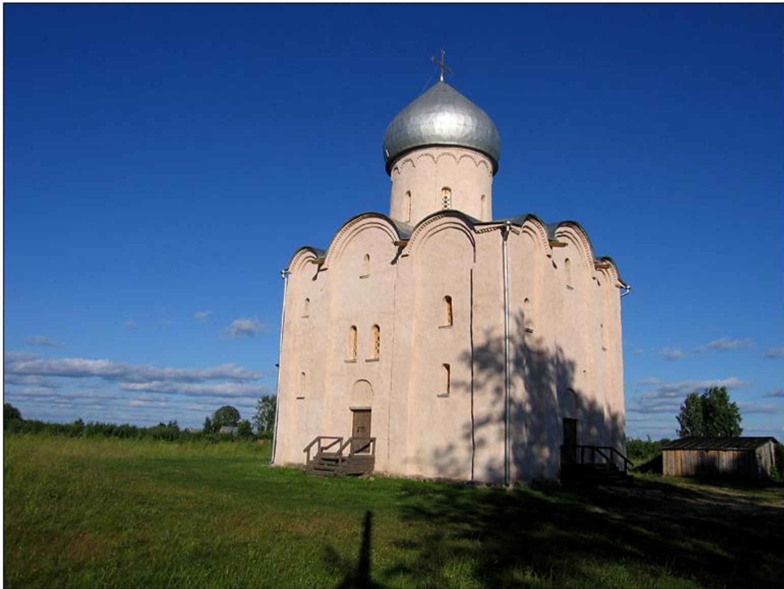
Церковь Спаса на Нередице