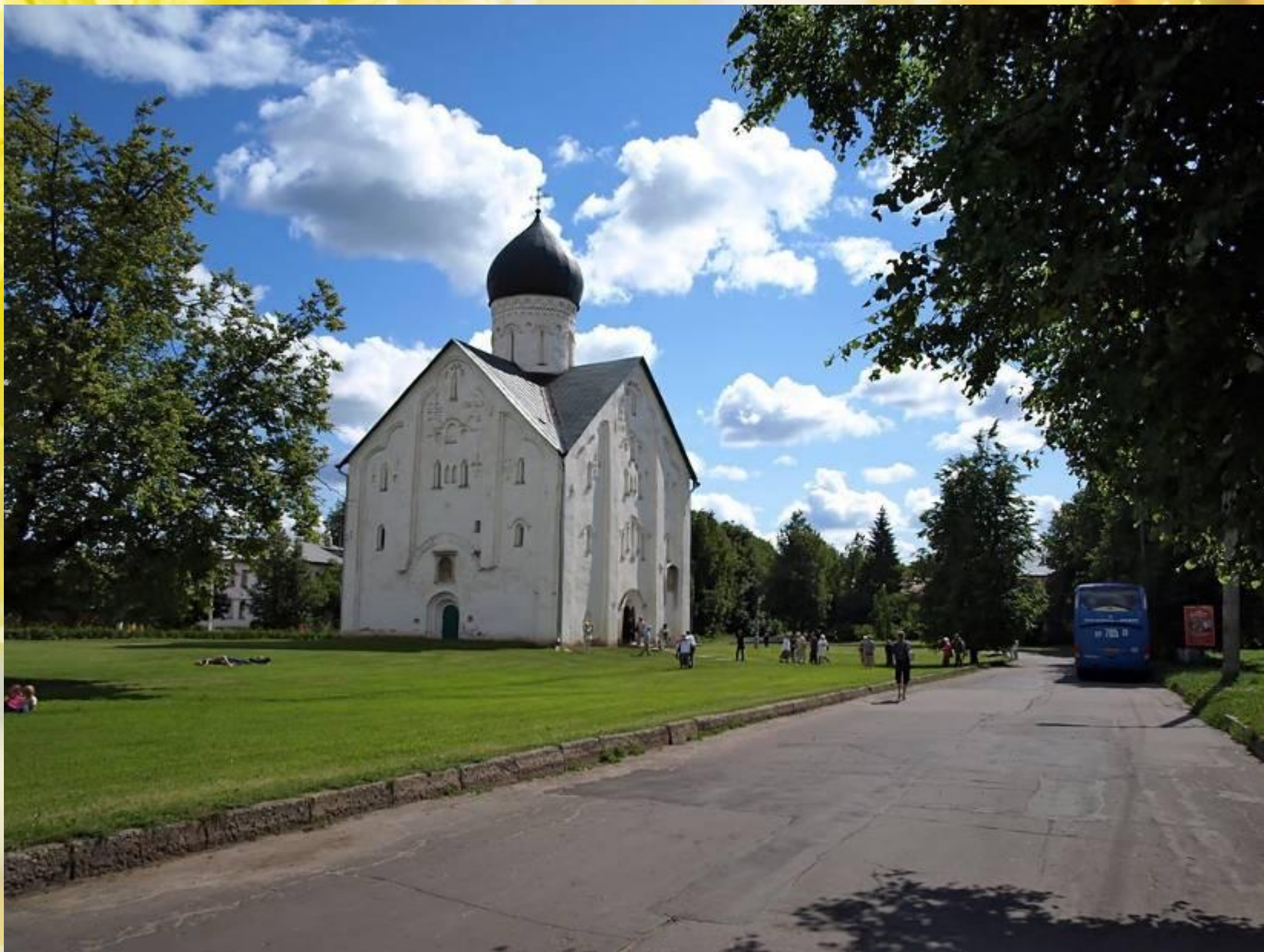
Церковь Спаса-Преображения на Ильине улице