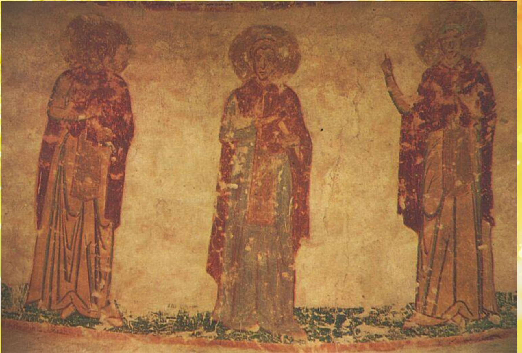
Фреска в Юрьевом монастыре