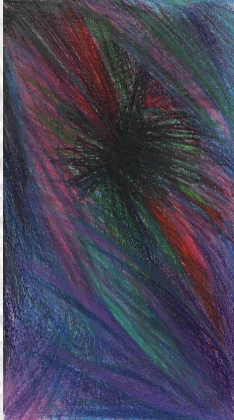
Рисунок на тему «Агрессивность»