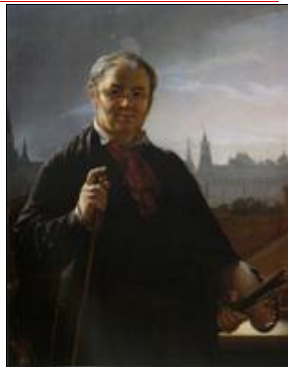
Василий Андре́евич Тропинин (1776-1857)