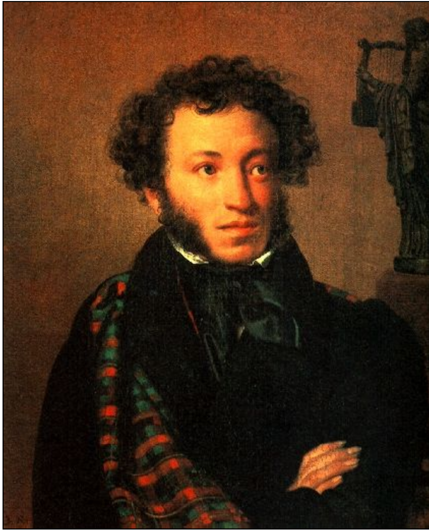
Автор портрета - О.А.Кипренский