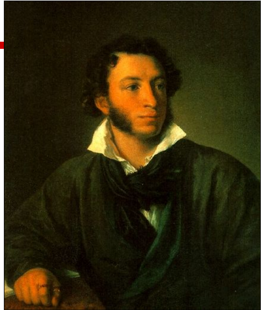
Автор портрета – В.А.Тропинин