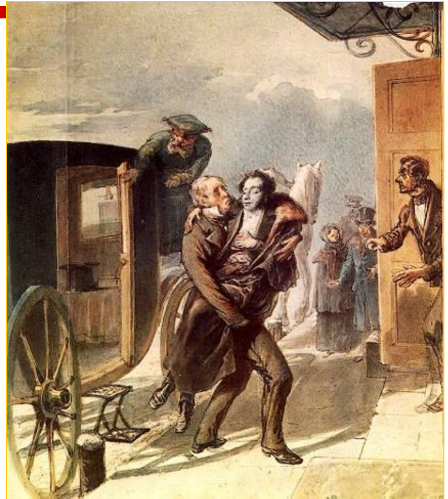
Возвращение Пушкина с дуэли.