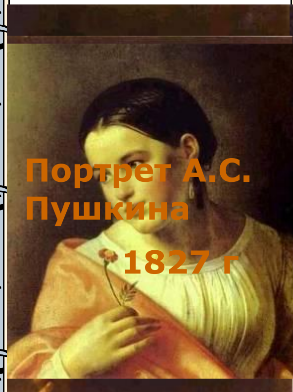
Портрет А.С. Пушкина 1827 г