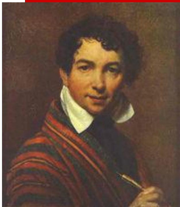
Орест Ада́мович Кипре́нский (1782-1836)