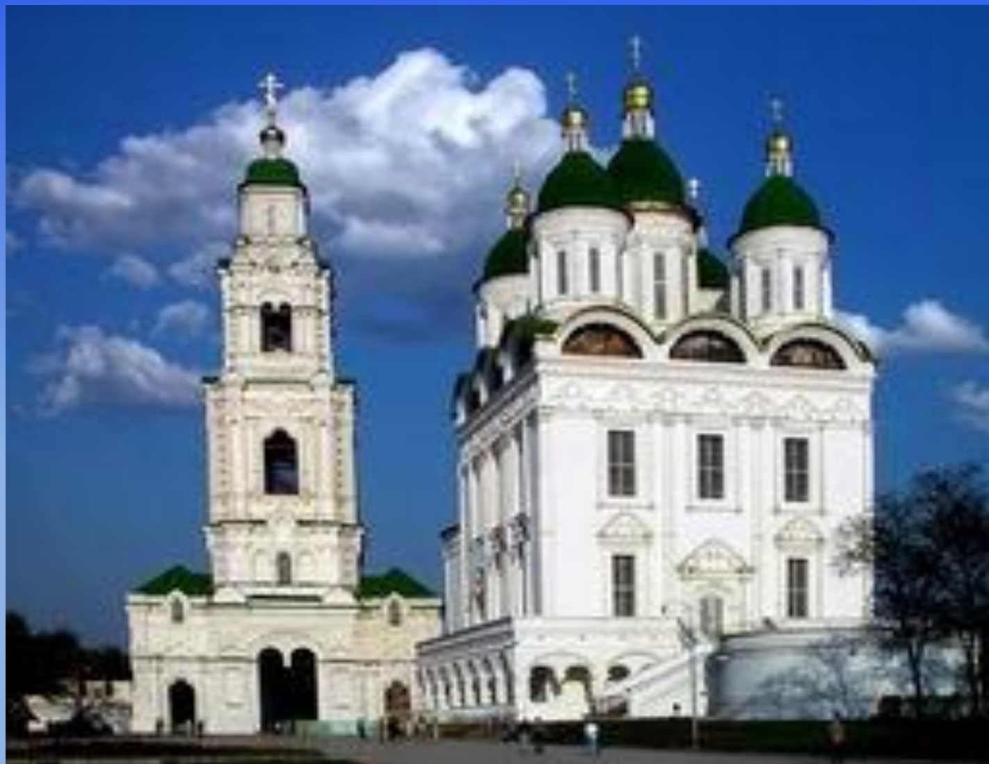
Успенский собор и соборная колокольня