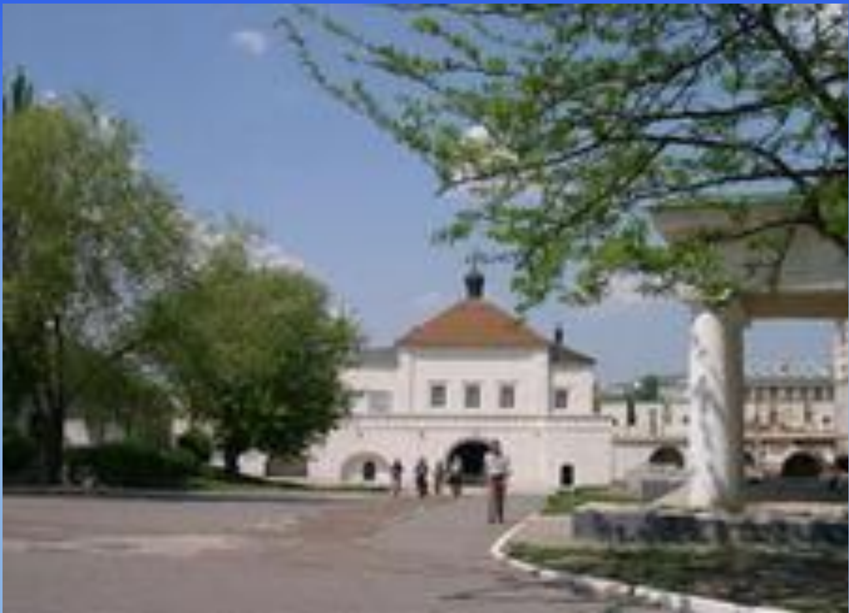
Никольские ворота и надвратный храм во имя Николая Чудотворца