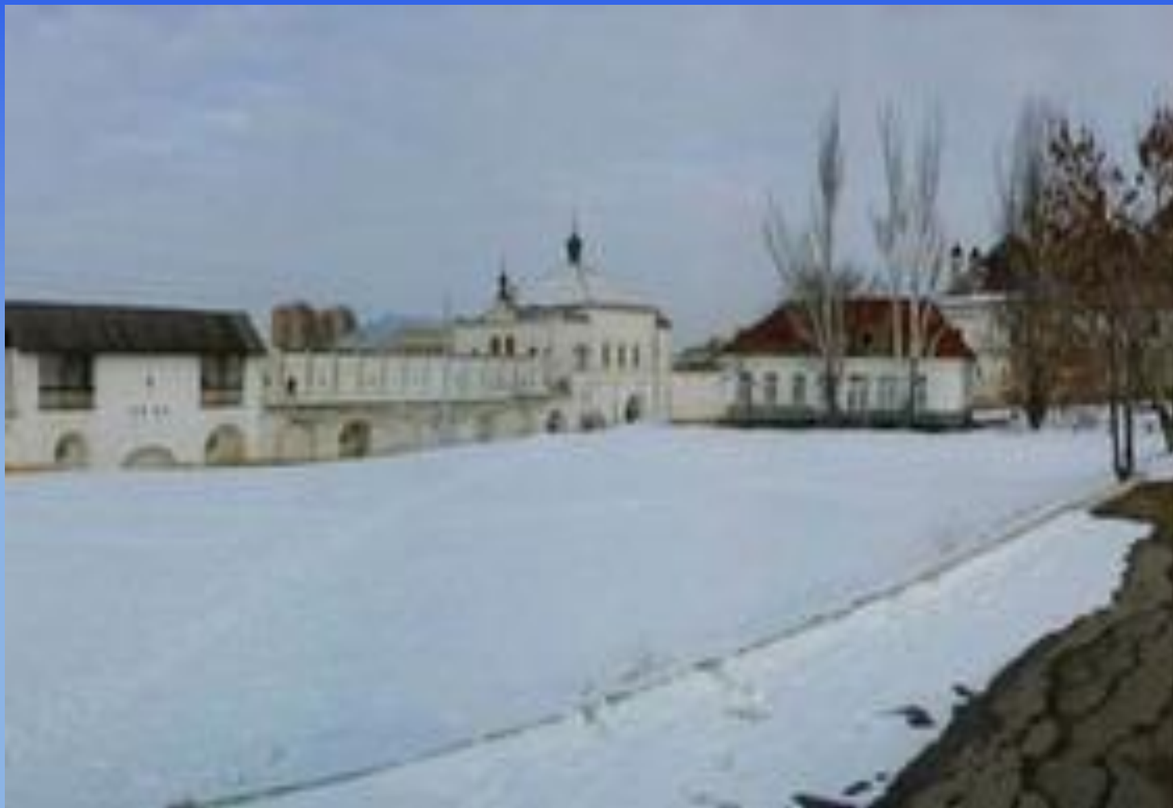
Водяные и Никольские ворота