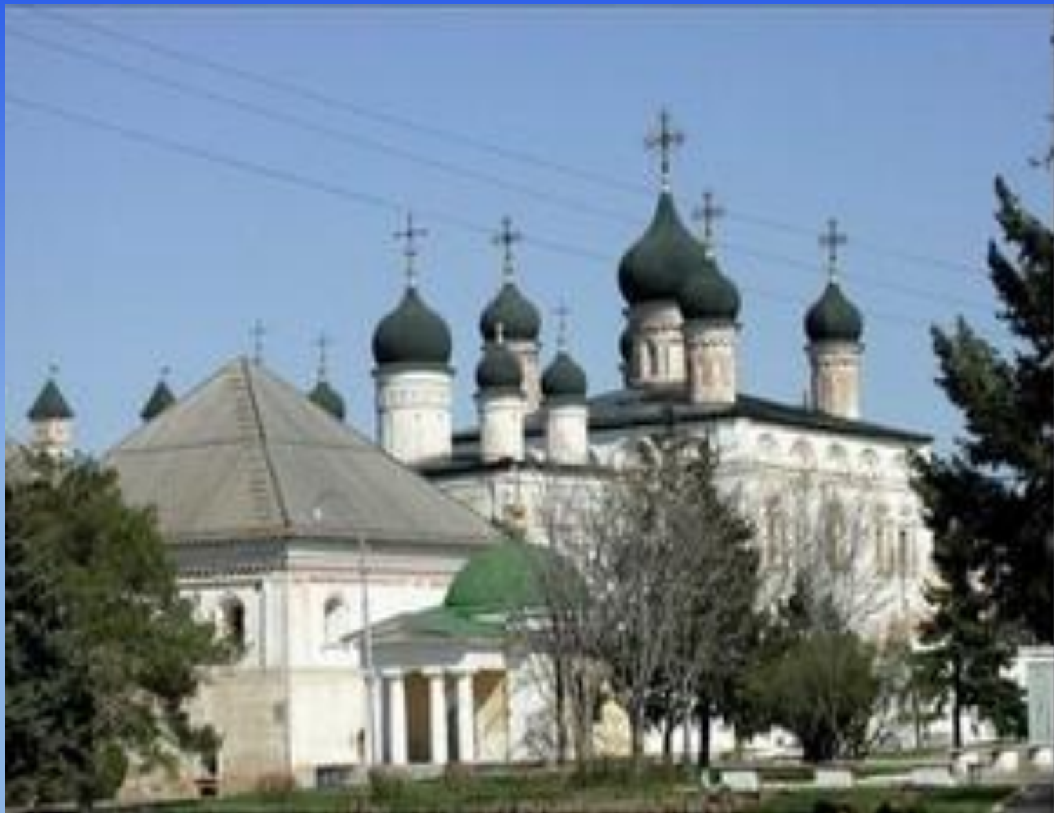
Троицкий собор и Кирилловская часовня