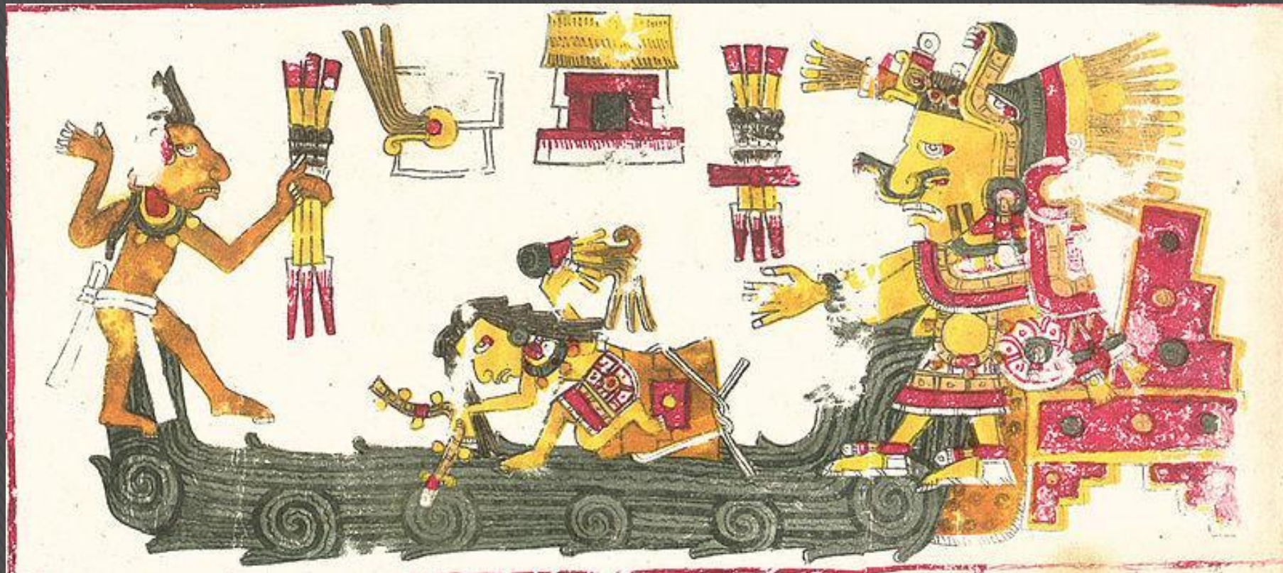
Изображение богини Чальчиутликуэ