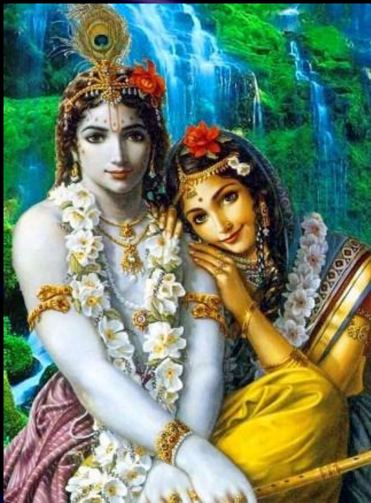
Кришна и Радха.