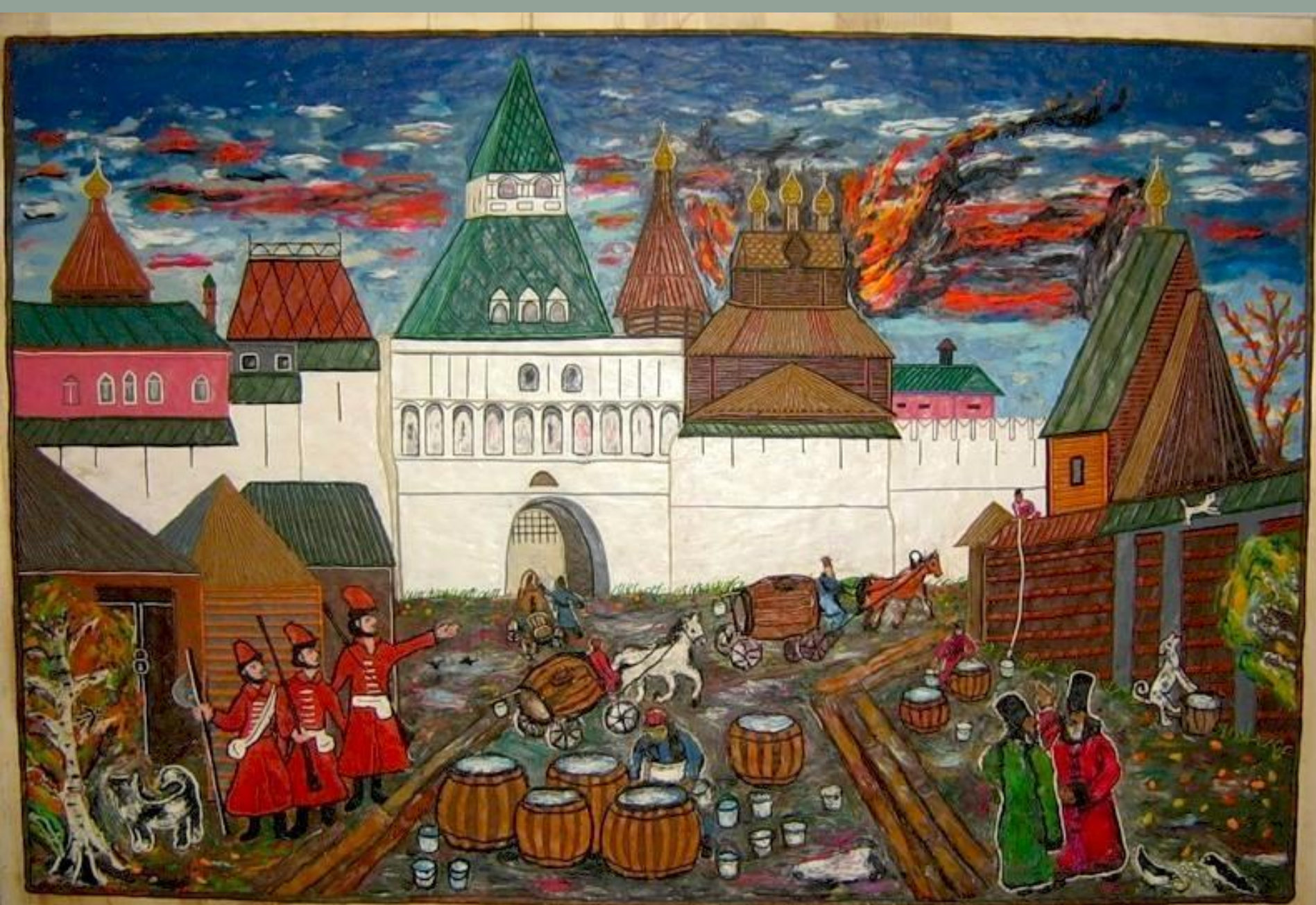
Пейзаж в русском стиле. В центре изображен замок 1874 г. Автор: [неизвестно]. Картина написана в 1874 г. в Москве. Авторство неизвестно.