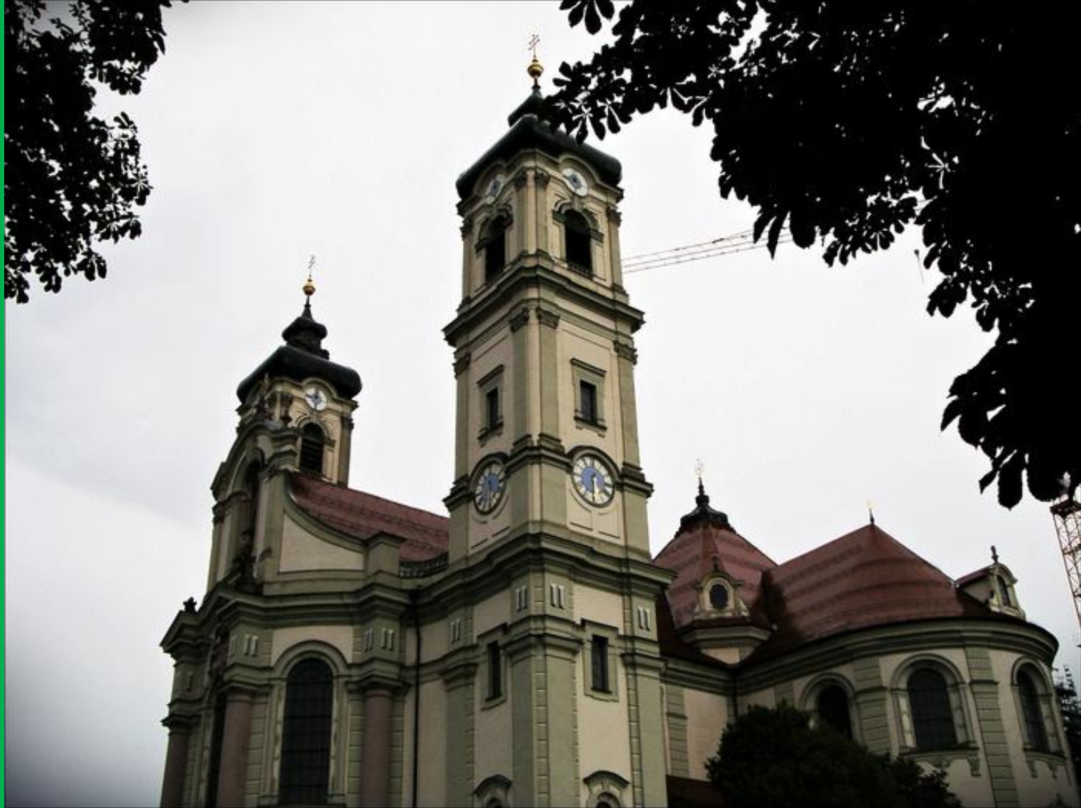
Аббатство Оттобойрен (Германия)