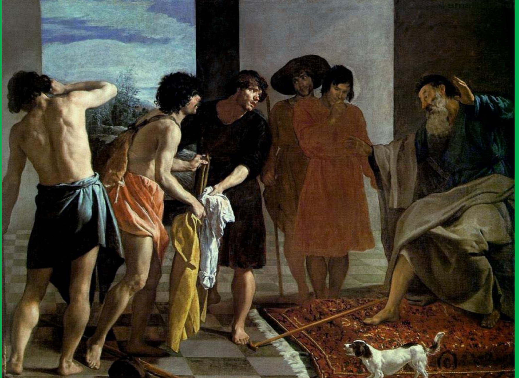
Веласкес "Окровавленный плащ Иосифа приносят Якову"