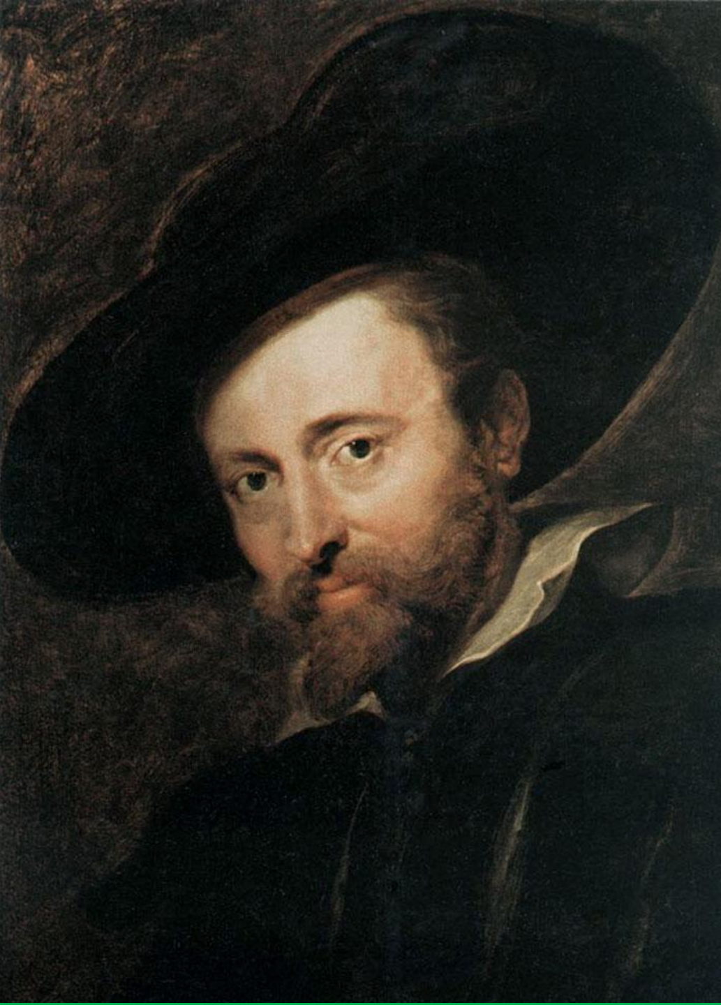
Рубенс Питер Пауль (1577-1640) Фламандский художник Автопортрет