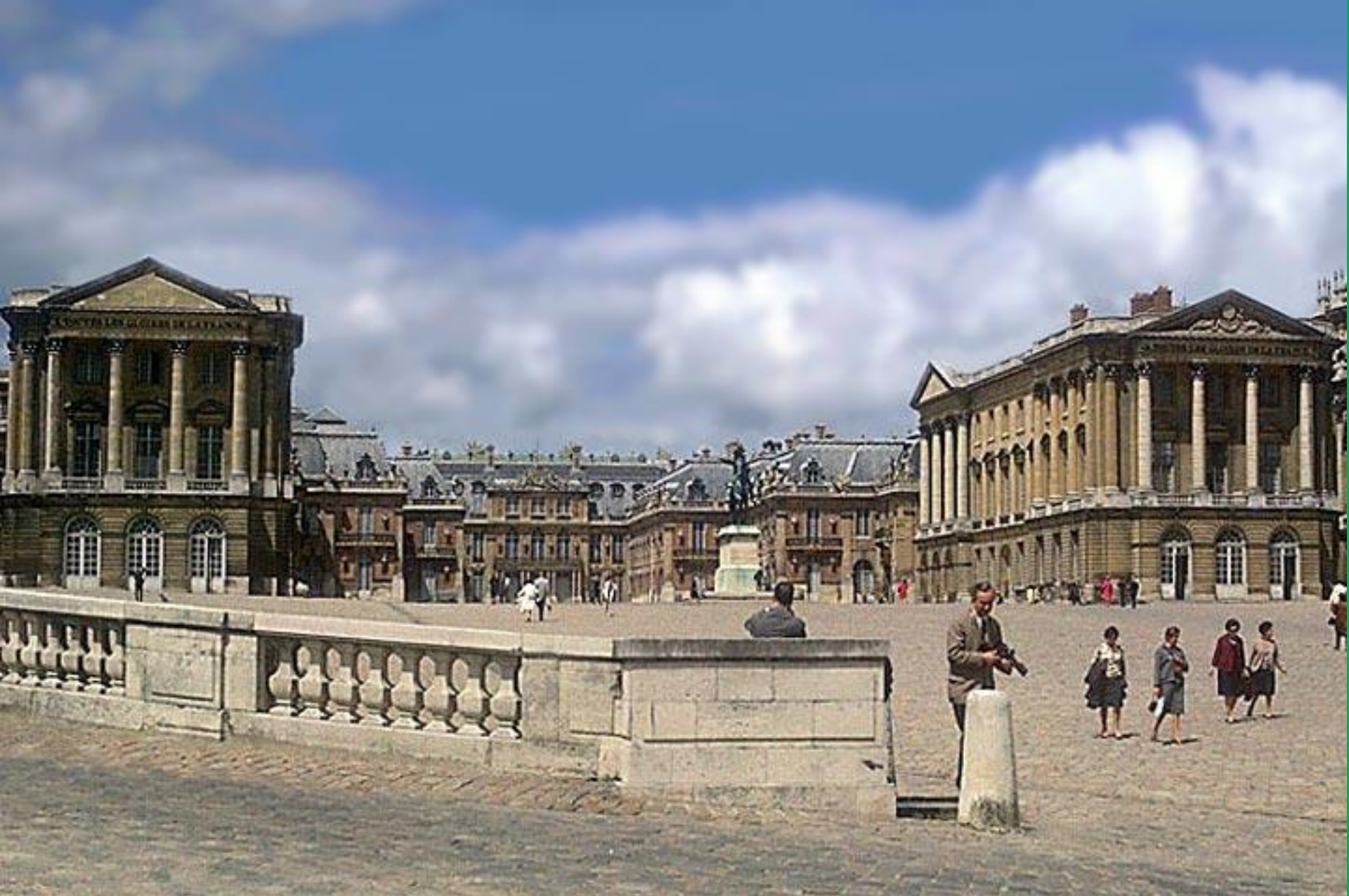
Большой версальский дворец (Франция)