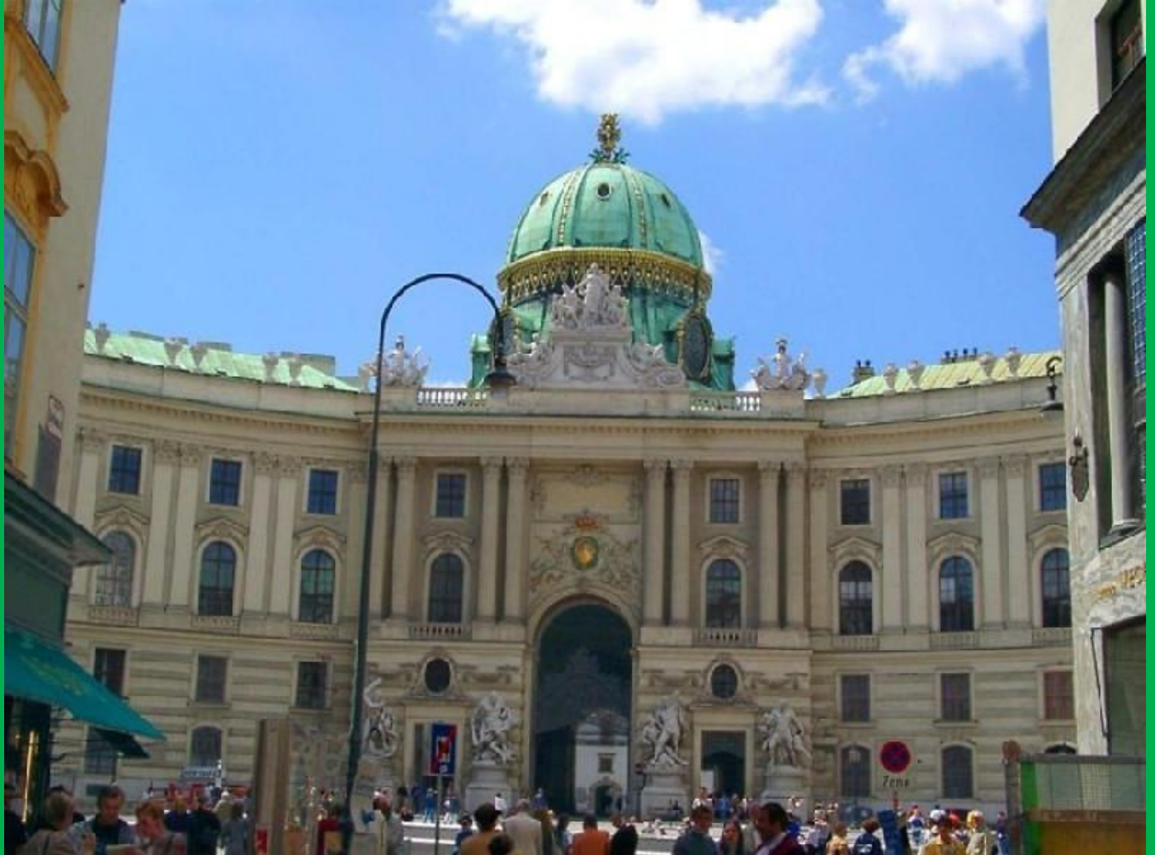
Резиденция австрийского двора Хофбург