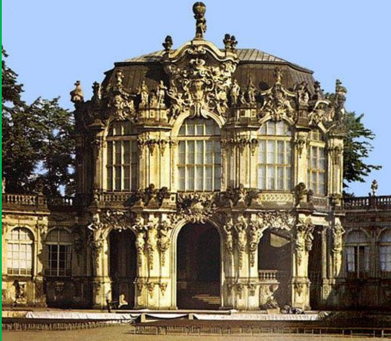
Пермозер. Дрезден. (Германия)