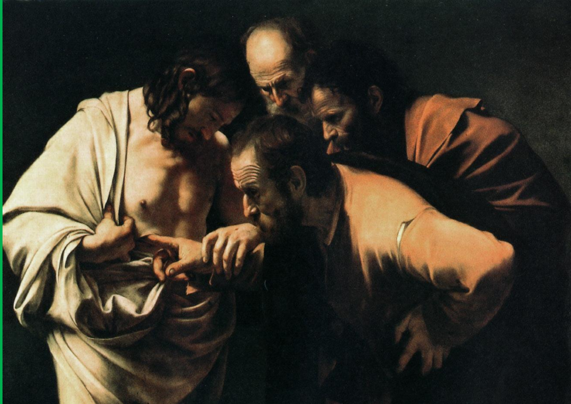
Караваджо “Заверения Фомы”