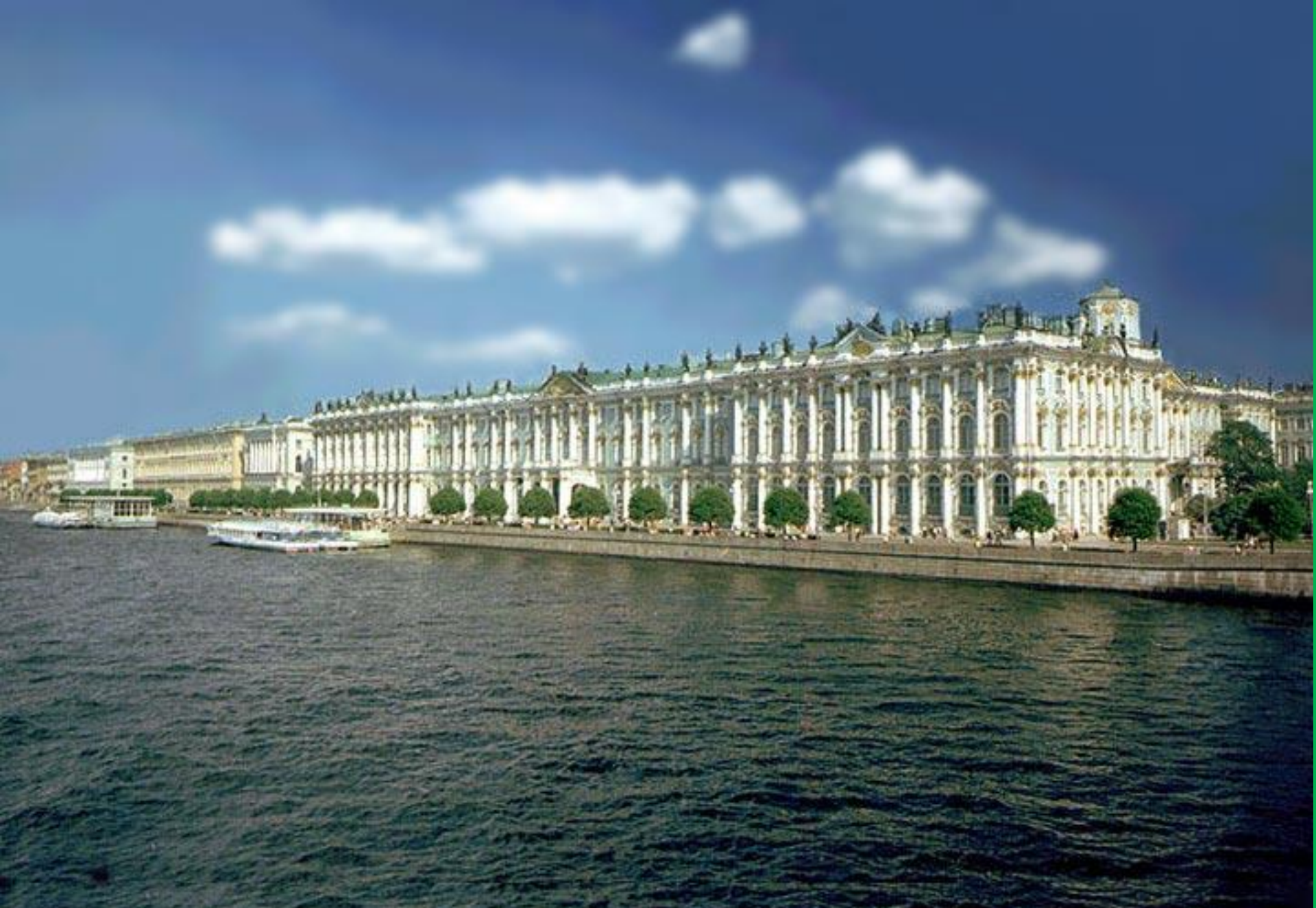
Зимний дворец. Санкт-Петербург