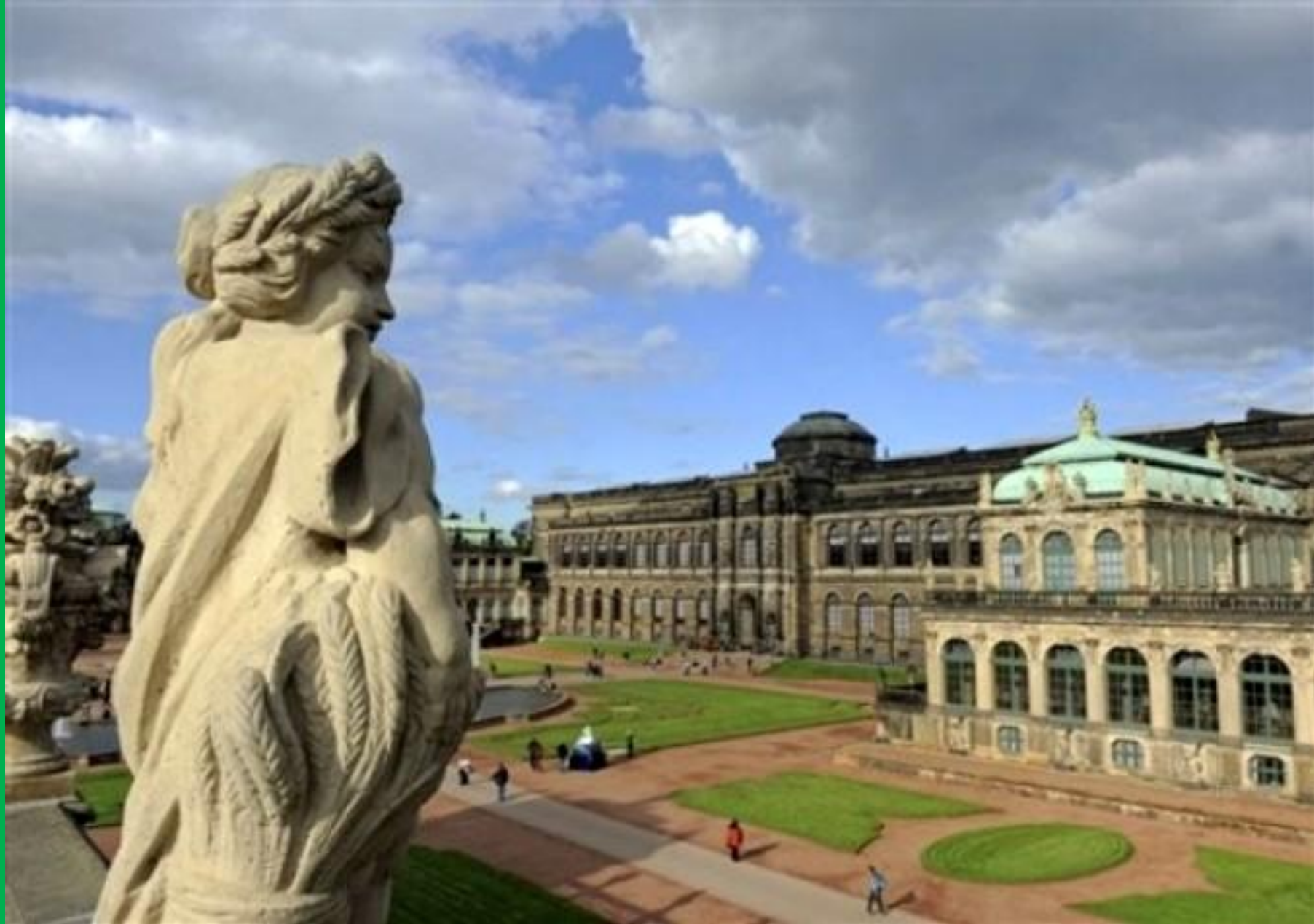
Дрезден. Комплекс барокко. (место суда и проведения выставок)