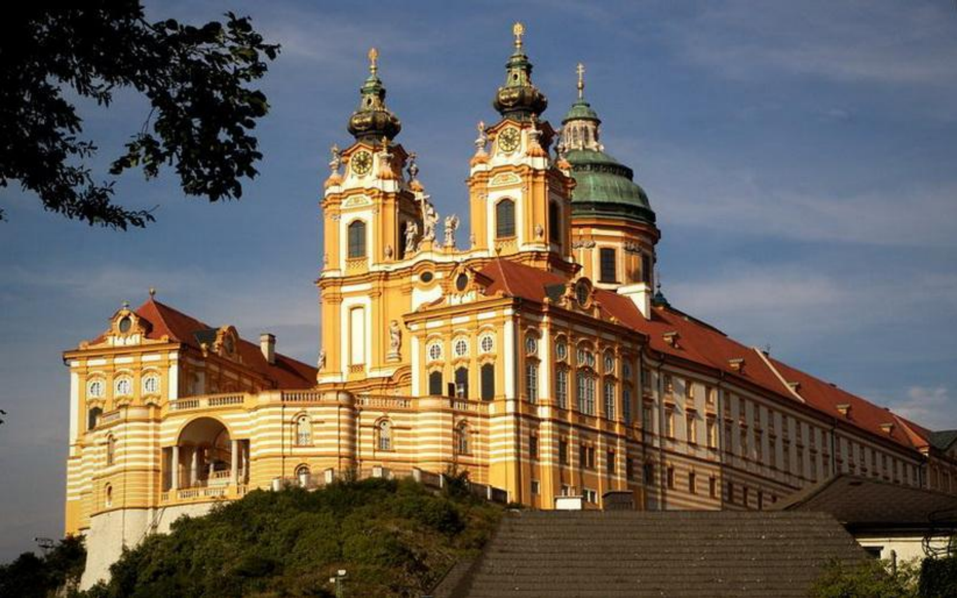
Аббатство Мельк (Австрия)