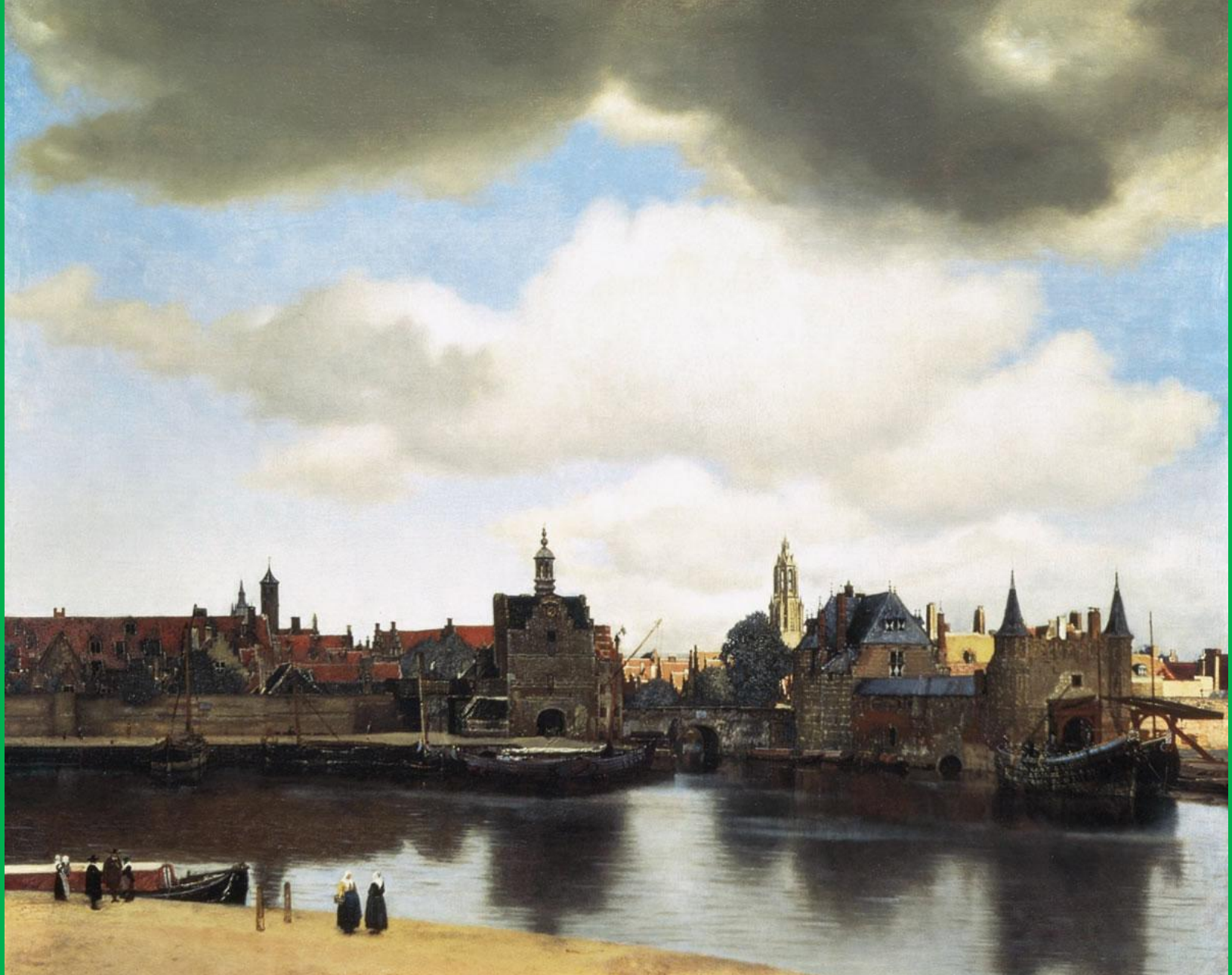
Вермеер “Улочка Делфта”