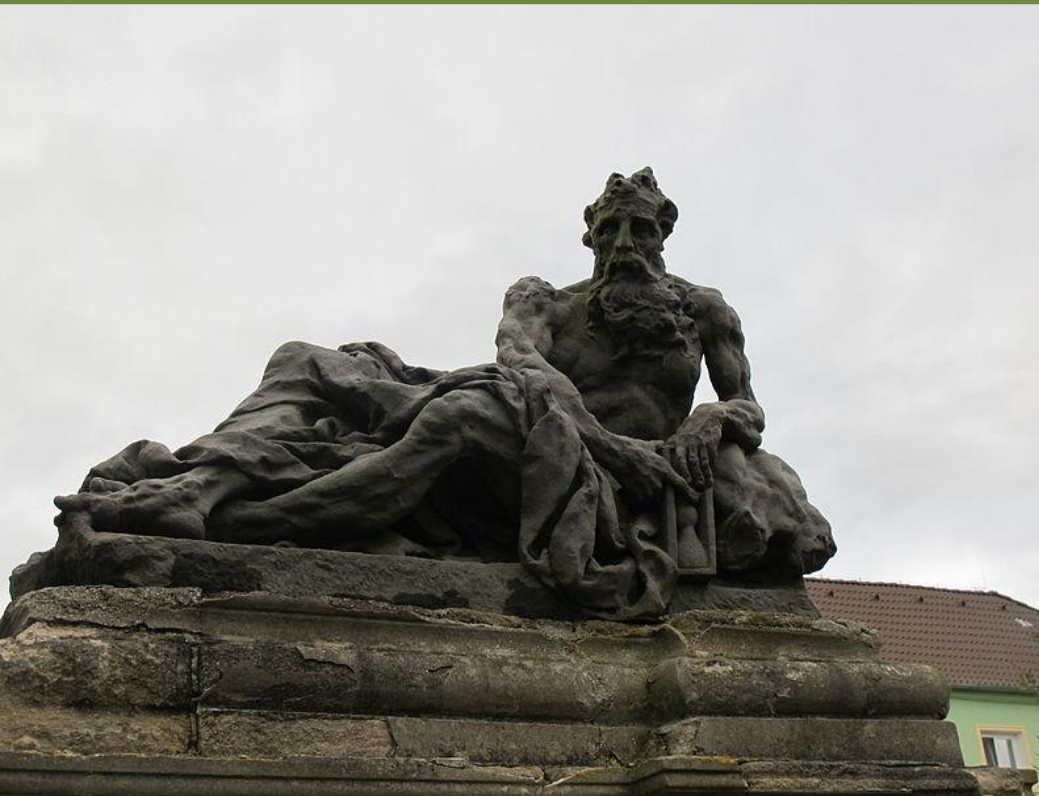
Мат'яш Бернард Браун, «Бог