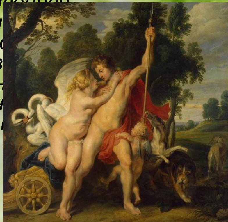
Рубенс. Венера и Адонис.