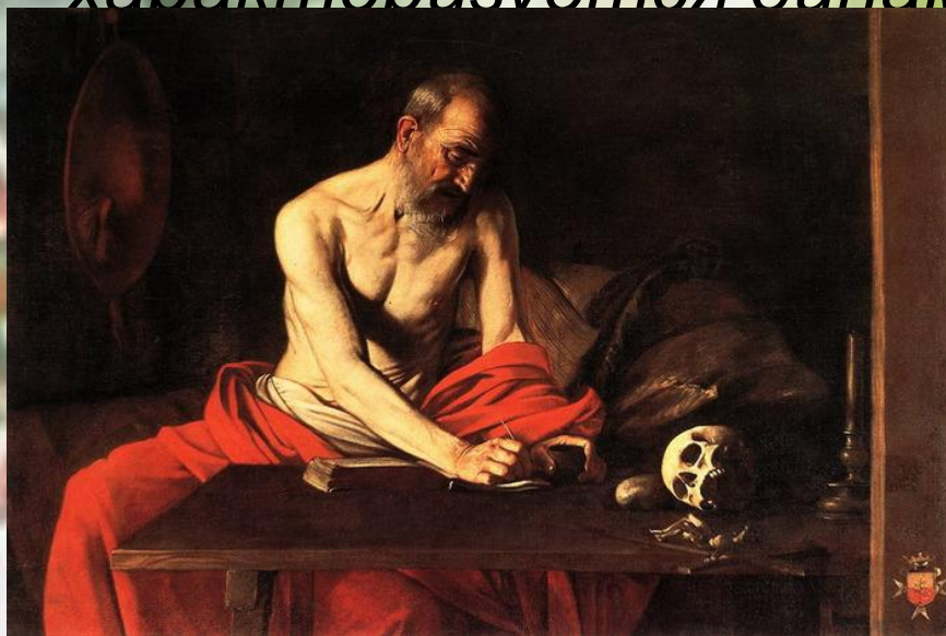
Караваджо. Святой Иероним

Стиль барокко в живописи характеризуется динамизмом композиций, «плоскостью» и пышностью форм, аристократичностью и незаурядностью сюжетов. Самые характерные черты барокко — броская цветистость и динамичность; яркий пример — творчество Рубенса . Стиль барокко в живописи характеризуется динамизмом