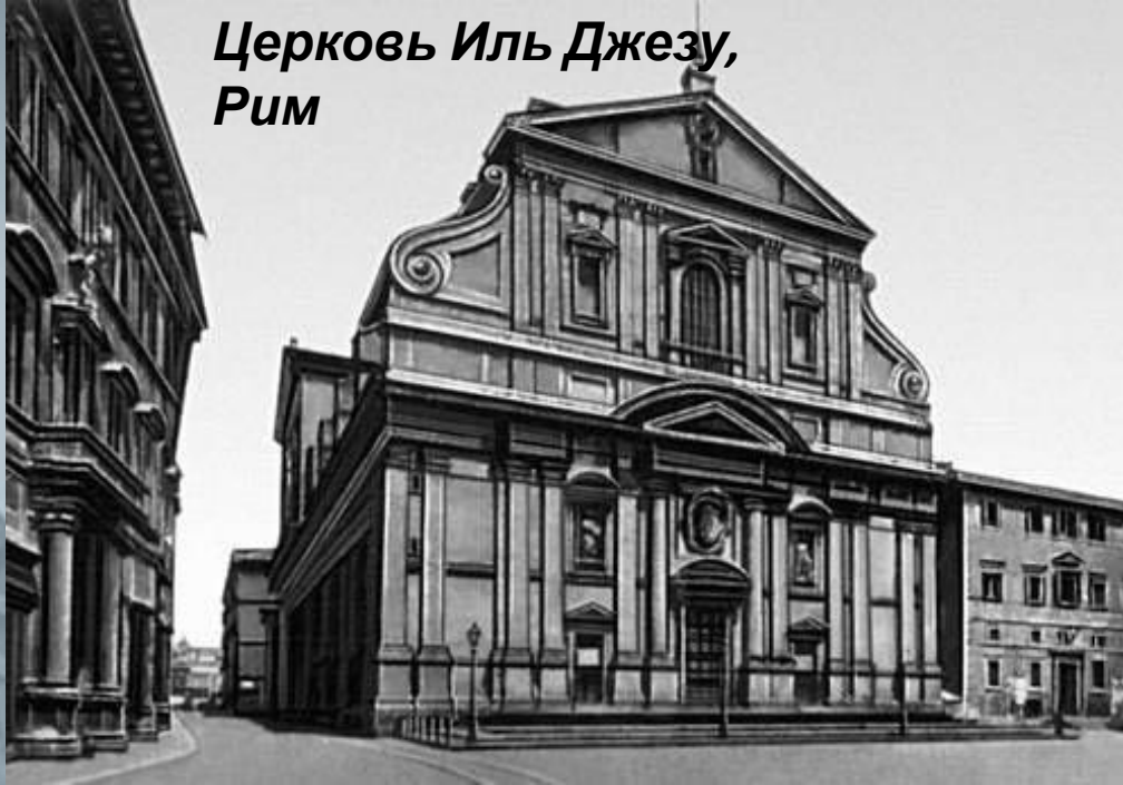
Церковь Иль Джезу, Рим