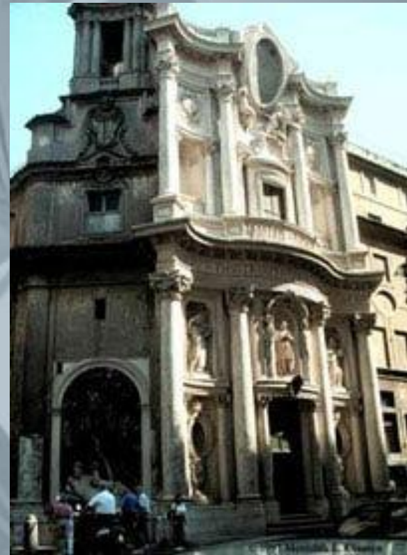
Церковь Сан Карло алле Кватро Фонтане, Рим