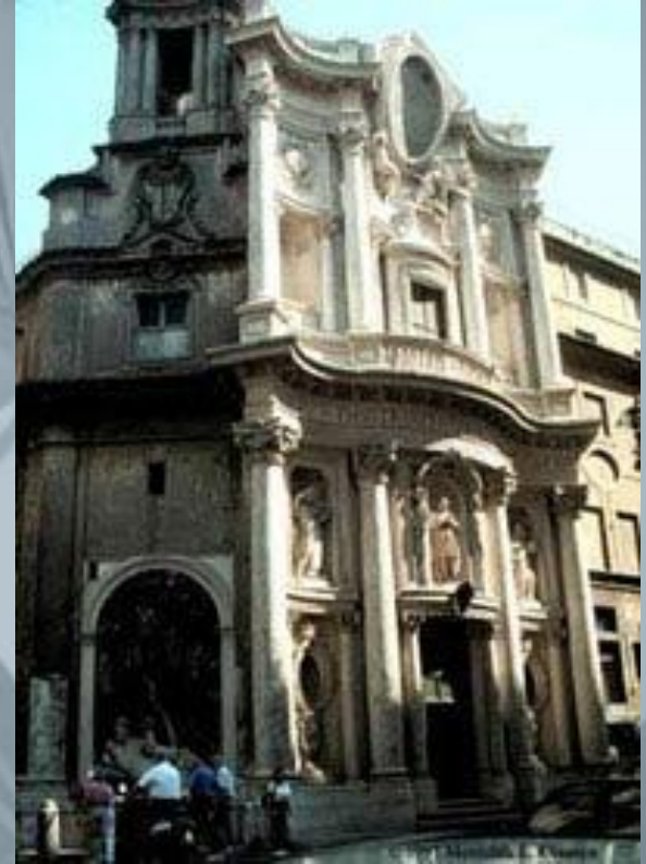
Церковь Сан Карло алле Кватро Фонтане, Рим