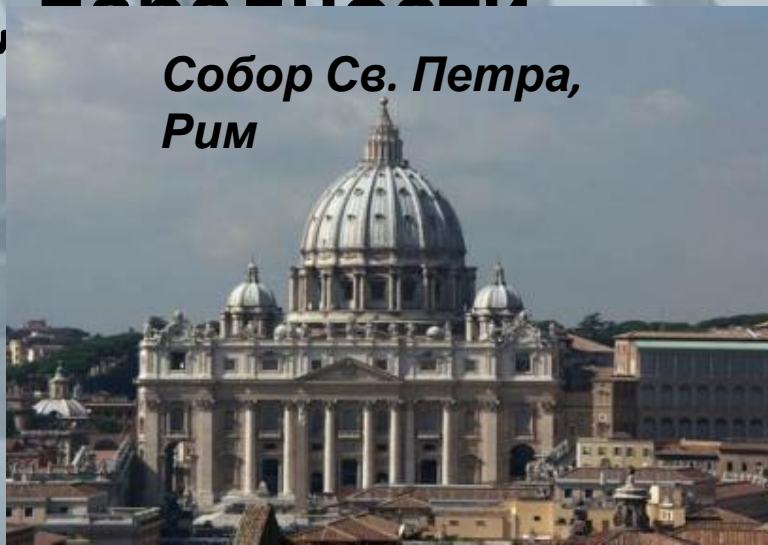
Собор Св. Петра, Рим