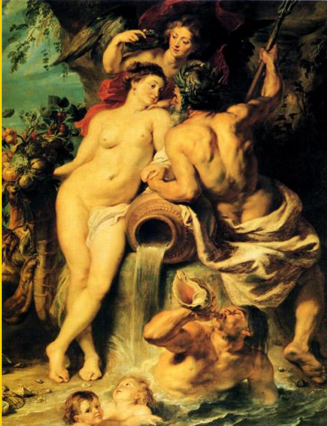
«Союз земли и воды»