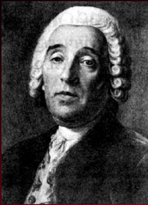
Доменико Андреа Трезини

Архитекторы той поры — в большинстве иностранцы, приглашенные Петром I. Наиболее известны Дом. Трезини, Ж.-Б. Леблон, Дж. М. Фонтана, Г. Маттарнови, А. Шлютер, М. Г. Земцов.