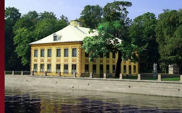
Адрес: Университетская наб., 3 Архитектор: Земцов М.Г.