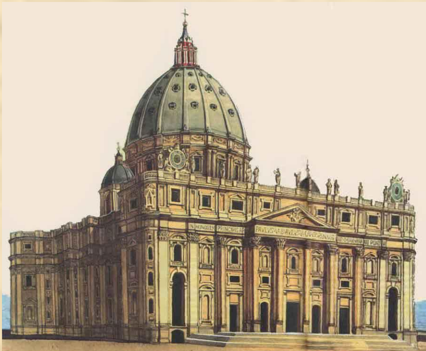
Собор Св. Петра в Риме