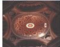
Церковь размещена в комплексе монастыря испанского ордена Францисканцев

Внутренний клуатр с двухручной галерей первый ярус – аркада на тосканских колонках овальный купол опирается на 4 арки и пиласы