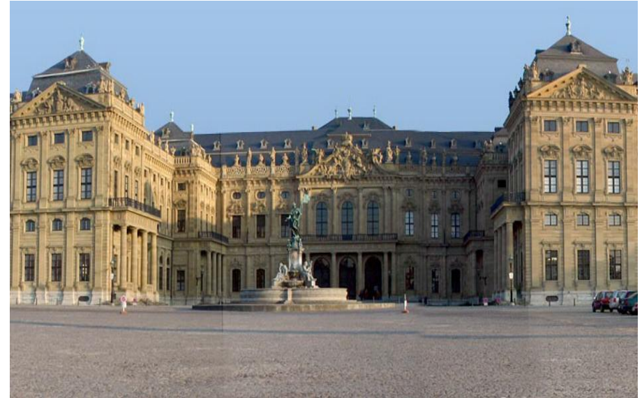
Вюрцбургская резиденция. Фасад дворца