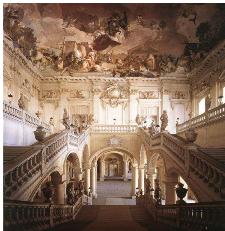
Вюрцбургская резиденция. Лестница.