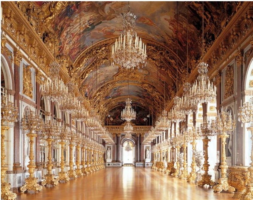
Версаль. Зеркальный зал.

Интерьеры Барокко в Германии во многом заимствованы из французского Барокко. Ярким тому примером является Вюрцбургский дворец, напоминающий Версаль по своей композиции, пышности интерьера, идеи личности в истории государства.