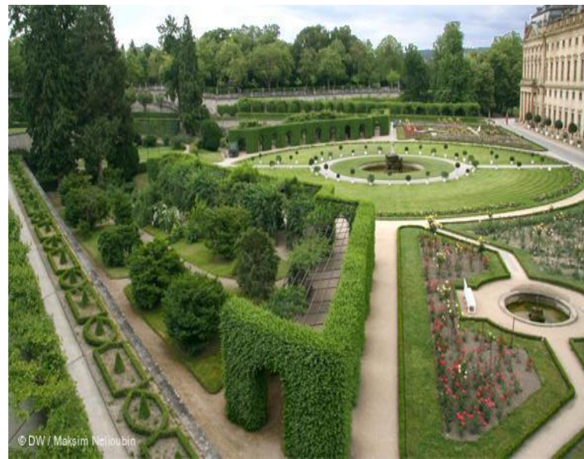
Вюрцбургская резиденция. Дворцово-парковый ансамбль