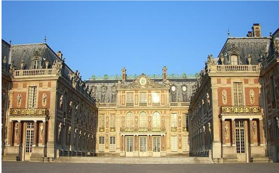
Версаль. Фасад дворца.

Ансамбль Версаля – сочетание архитектуры, скульптуры, живописи и садово-паркового искусства архитектора Луи Лево, художника-декоратора Шарля Лебрена, мастера садово-паркового искусства Андреа Ленотра является вершиной архитектурной мысли эпохи Барокко. Вюрцбургская епископская резиденция (Вальтасар Нейман ) - памятник мировой культуры, шедевр позднего барокко. В ней нашли свое отражение лучшие идеи эпохи. Общая композиция Вюрцбургского замка во многом обязана Версалю.