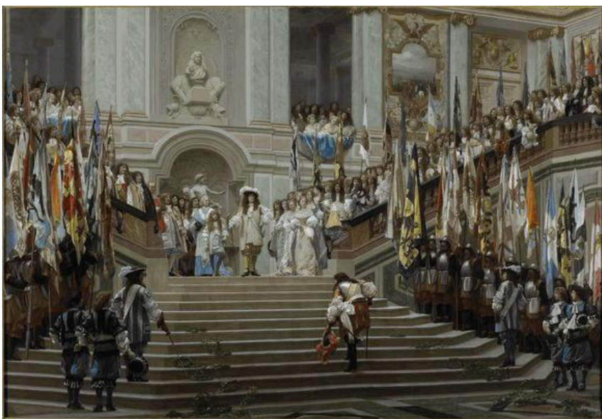
Версаль. Лестница Послов.

Лестница Послов в Версале-редкий во французской архитектуре тех времён пример лестницы с расходящимися двойными маршами. В простенках между колоннами второго яруса расположены фрески со сценами военных побед Людовика XIV. Знаменитое творение Бальтазара Неймана в Вюрцбургском дворце – лестница с безупрчными сводами, украшенная самыми большими в мире потолочными фресками работы Тьеполо, изображающими исторические и мифические сцены.