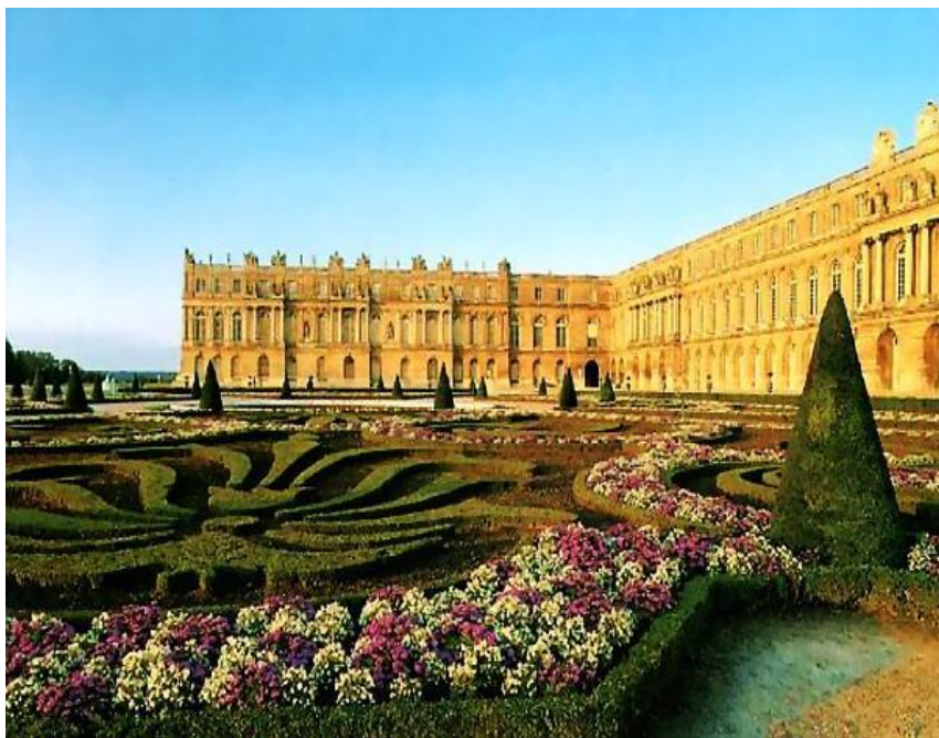
Версаль. Дворцово-парковый ансамбль

Французские и немецкие мастера Барокко стремились наилучшим образом вписать дворец в окружающую среду — в частности, в сады и парки