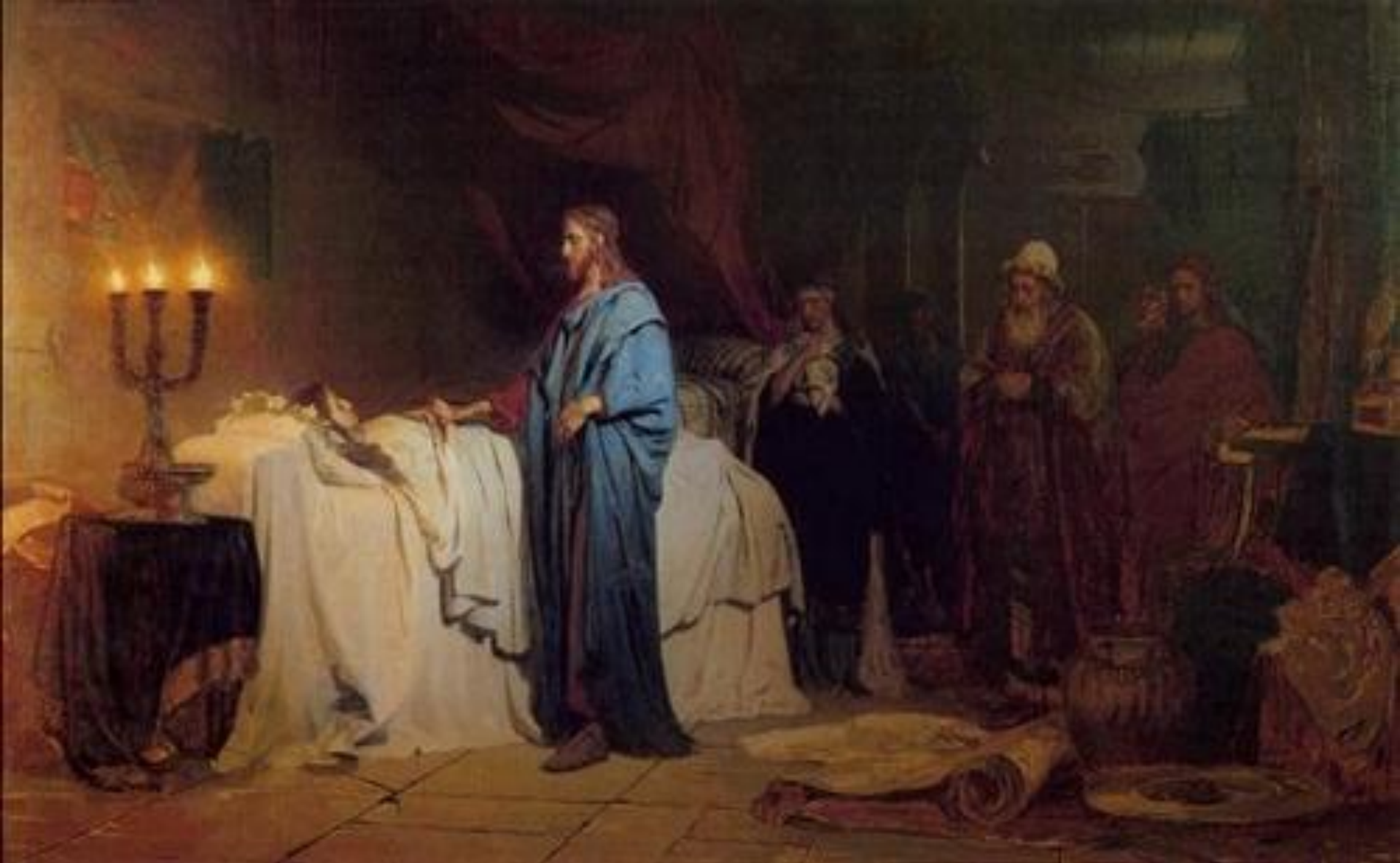
Илья Репин «Воскресение дочери Иaira»