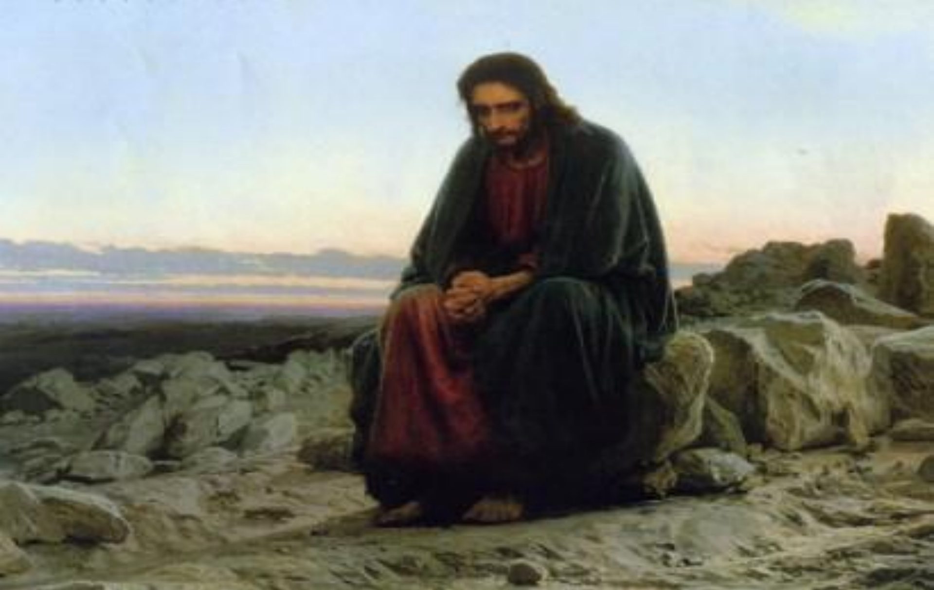
Иван Крамской «Христос в пустыне»