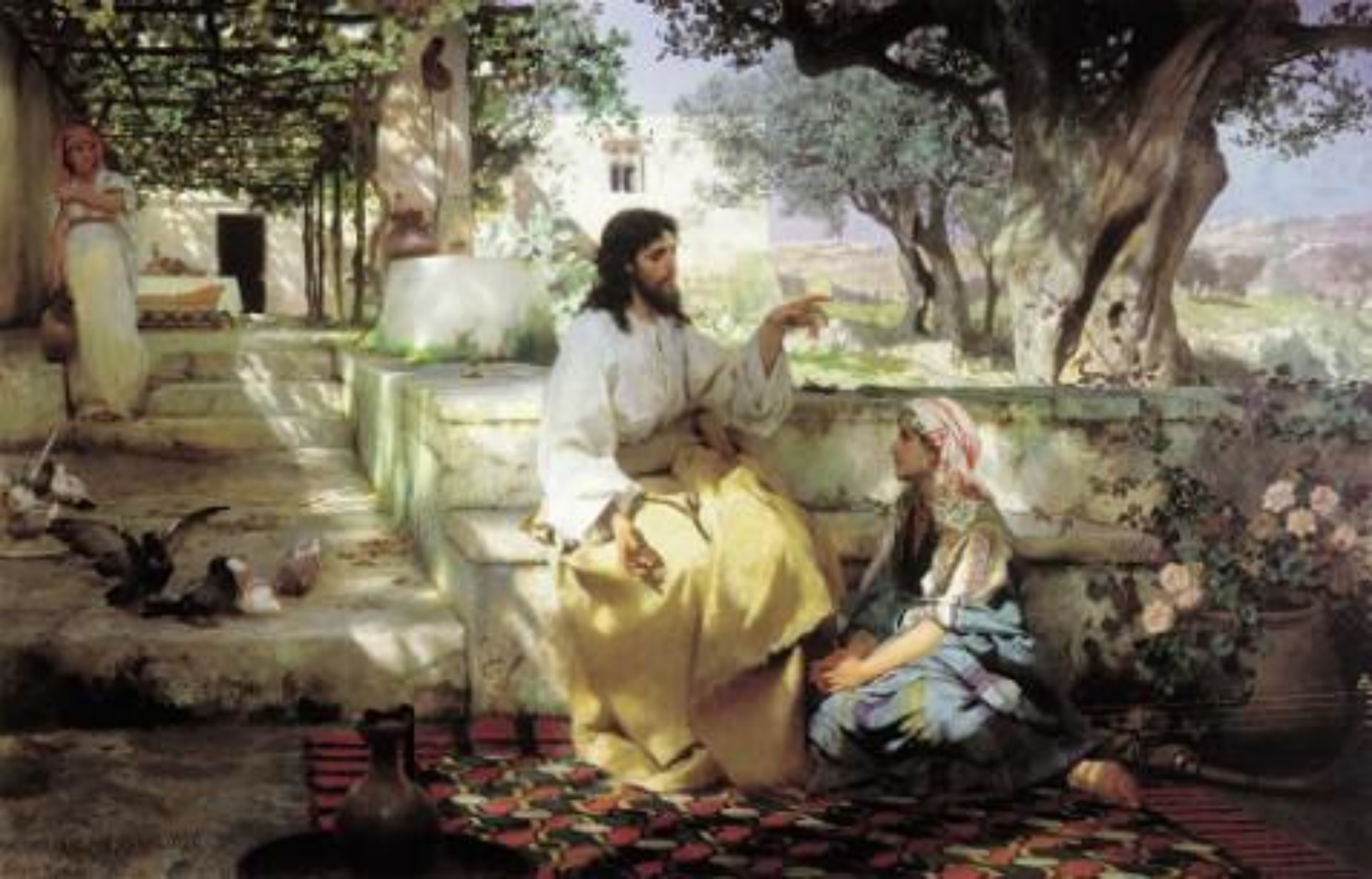
Генрих Семирадский «Христос и самаритянка»