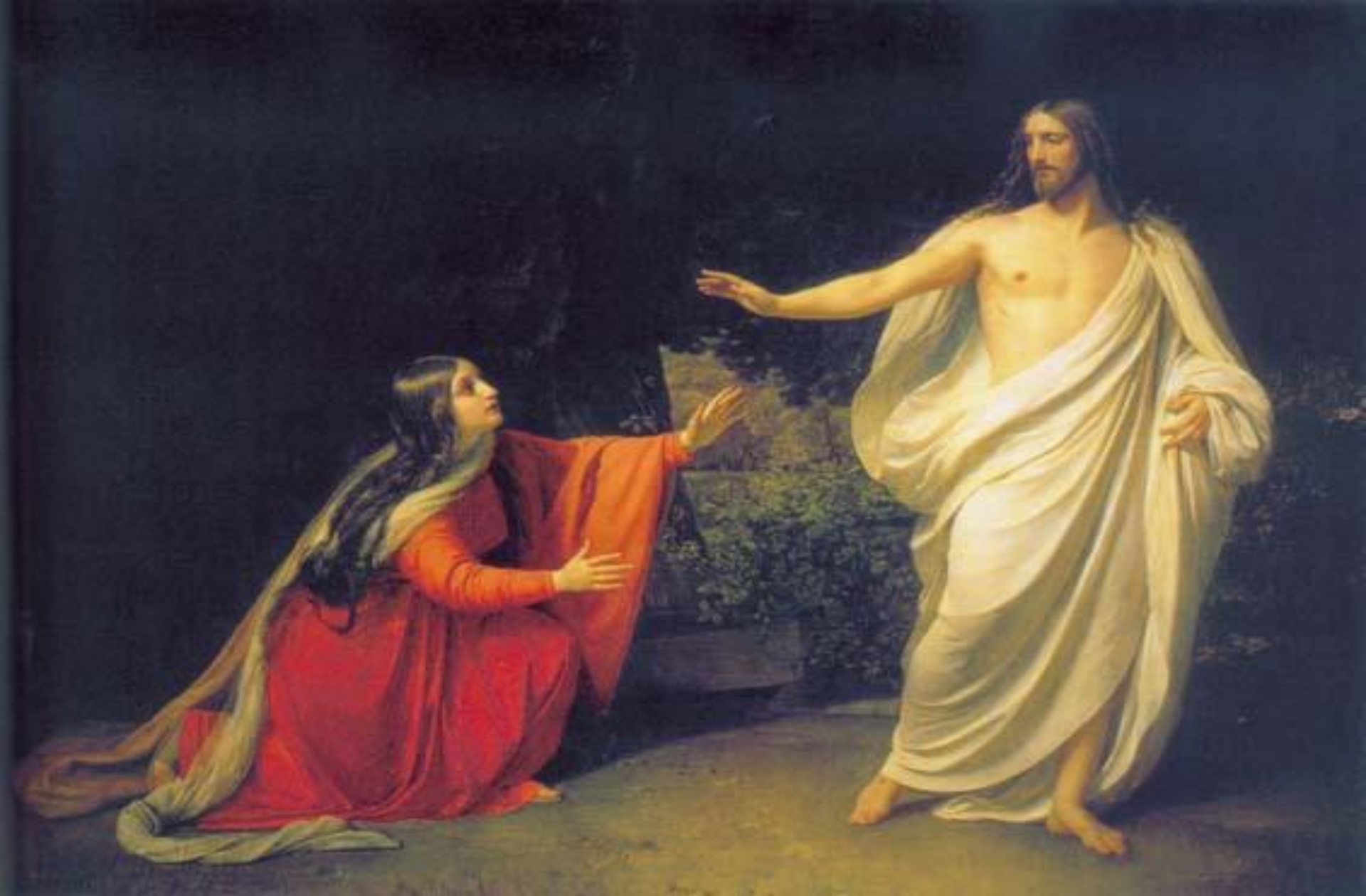
Иванов А. А. «Явление воскресшего Христа Марии»