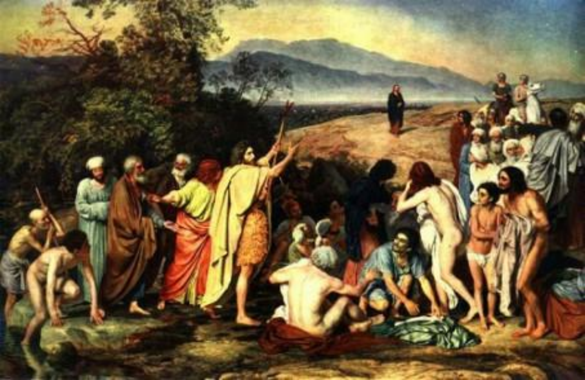
А.А. Иванов. «Явление Христа народу»