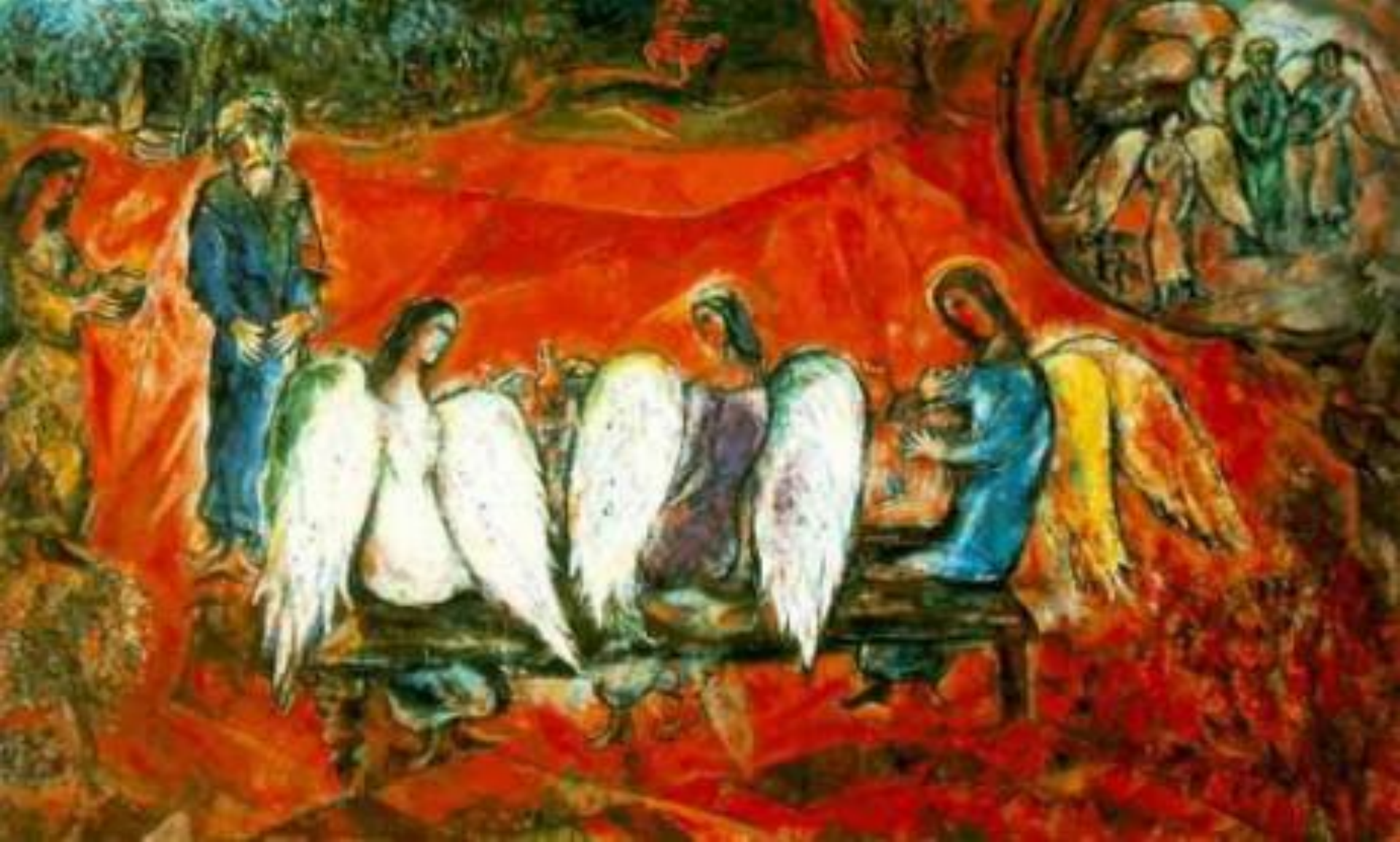
Марк Шагал «Библейское послание»