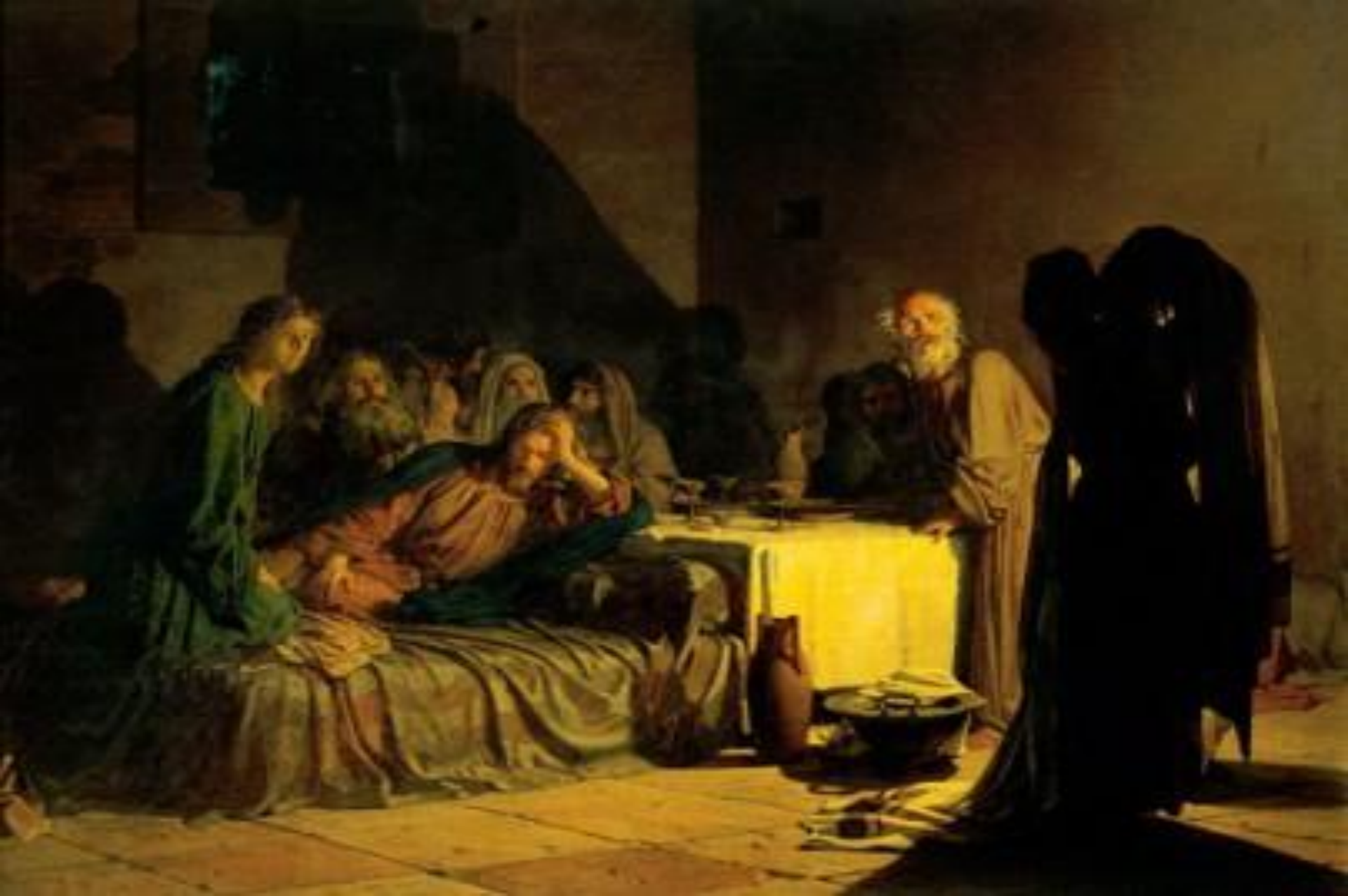
Н. И. Ге. «Тайная вечеря». 1863.