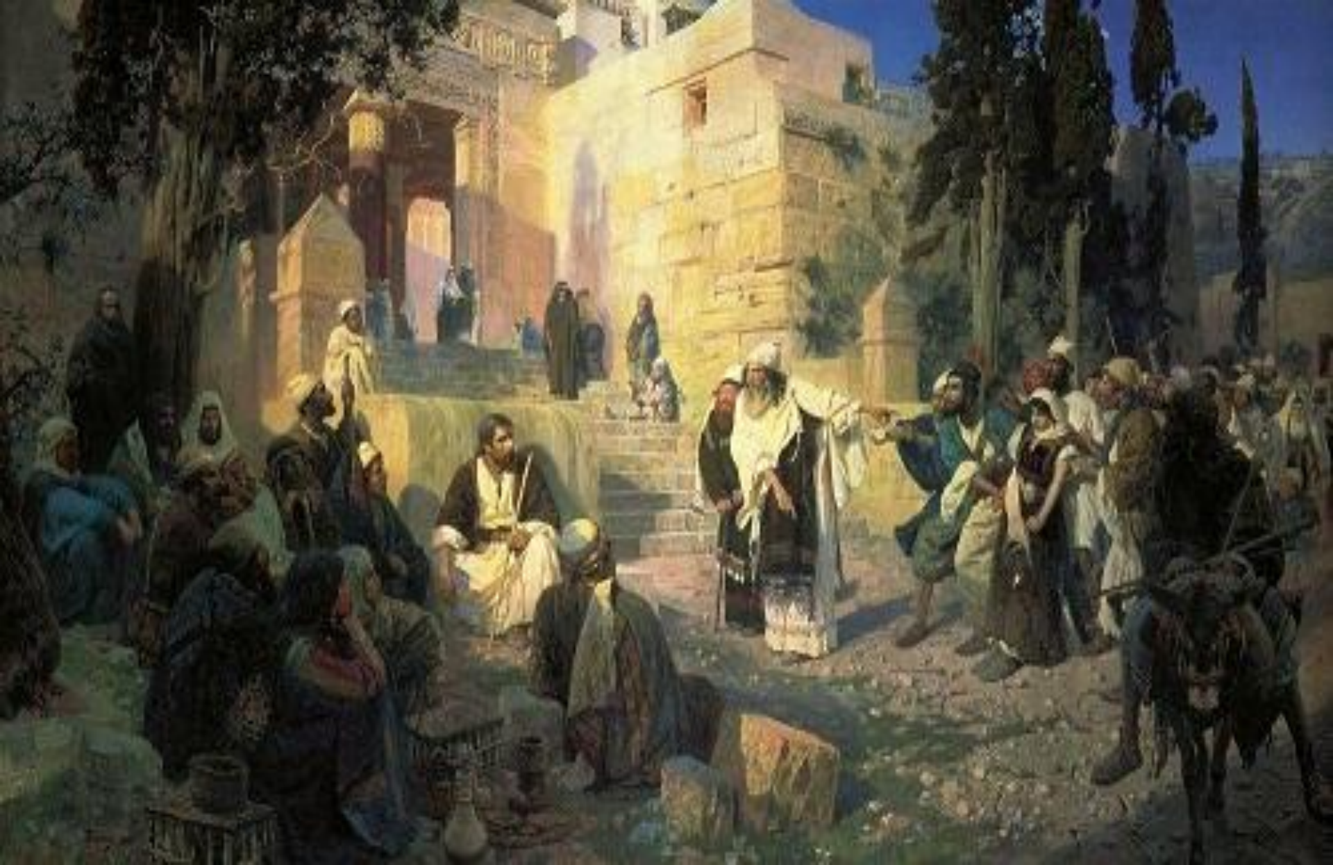
Василий Polenov «Христос и грешница»