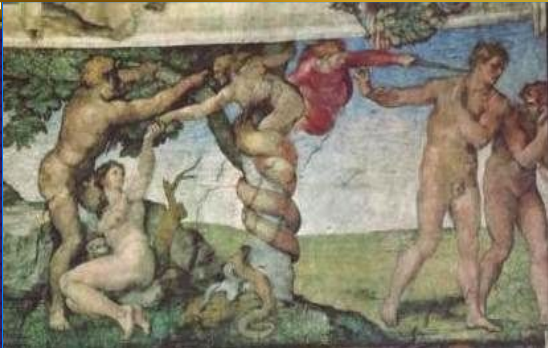
Микеланджело. Грехопадение и Изгнание из Рая