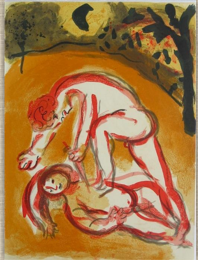
М.Шагал «Каин и Авель»