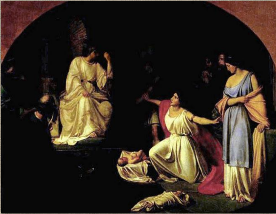
Николай Николаевич Ге «Суд Соломона»