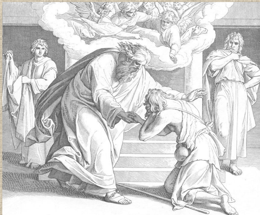
Юлиус фон Шнорр Карельсфельд «Притча о блудном сыне».