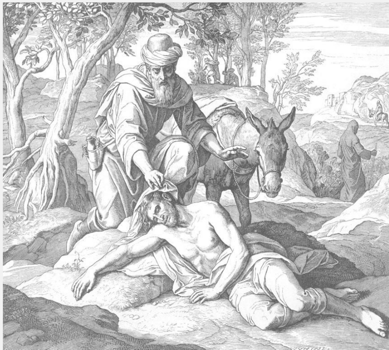
Юлиус Шнорр фон Карольсфельд «Притча о добром самарянине».