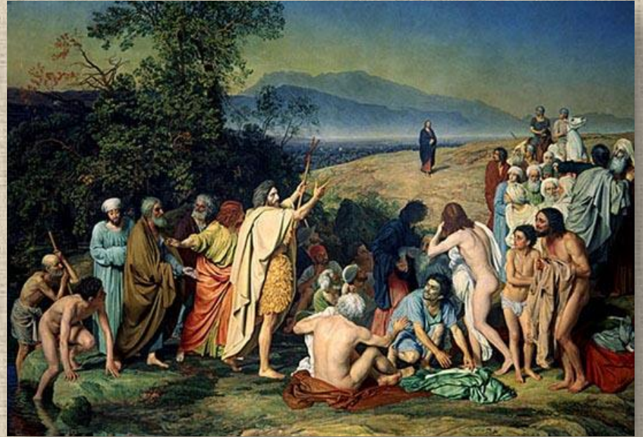
А.Иванов «Явление Христа народу»