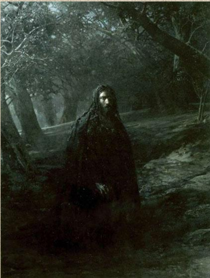
Николай Николаевич Ге «В Гефсиманском саду»