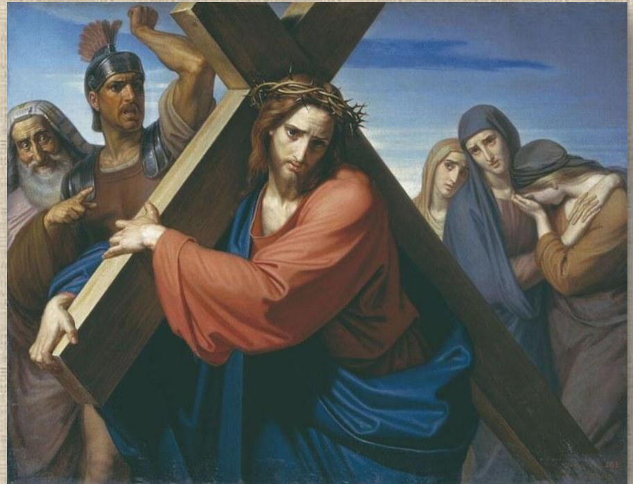
Федор Антонович Моллер «Несение креста». 1869.