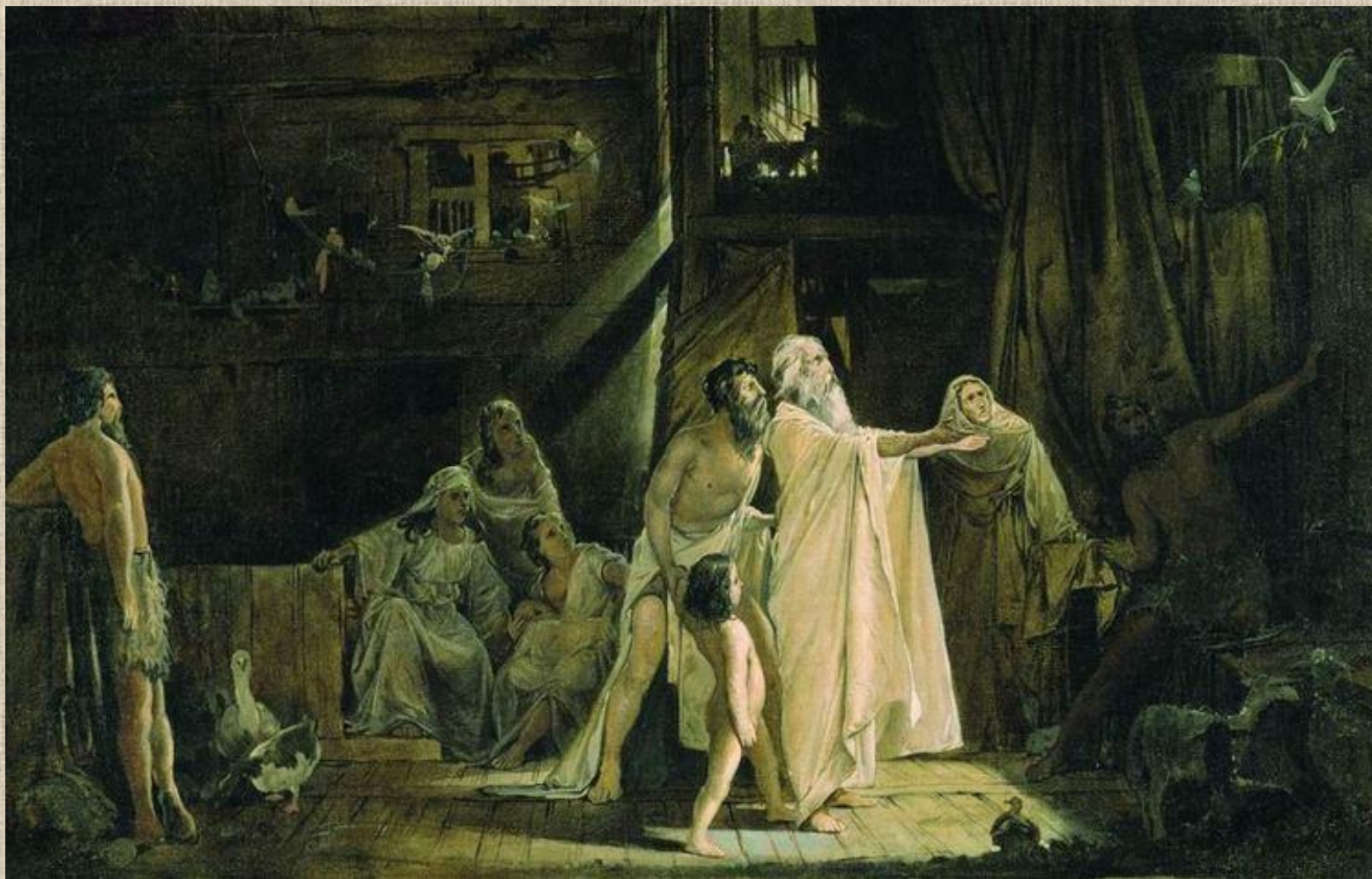
Андрей Петрович Рябушкин «Ноев ковчег». 1882.