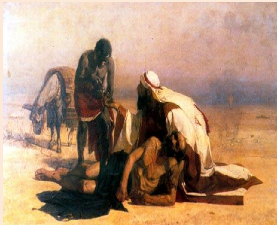
Василий Иванович Суриков «Милосердный самаритянин»