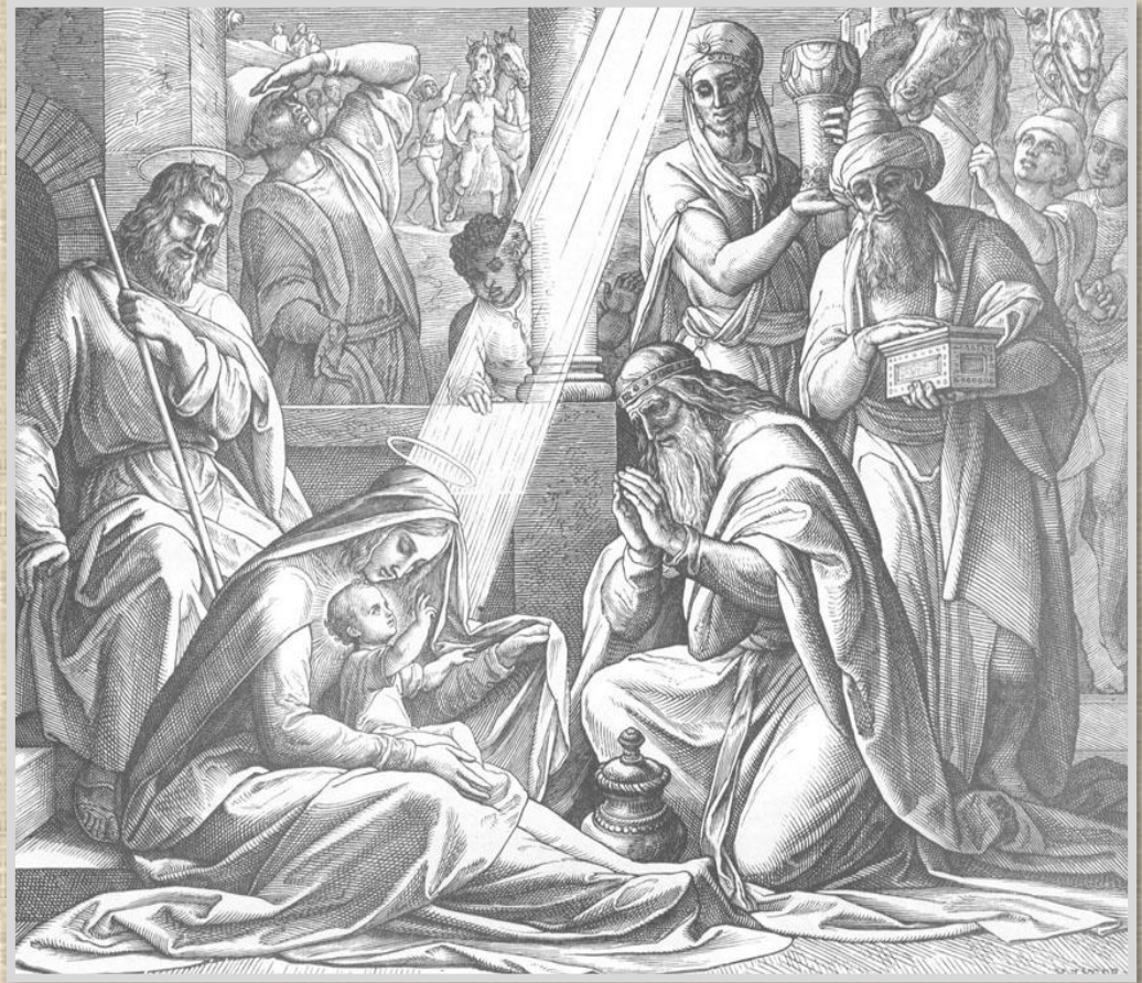
Юлиус Шнорр фон Карльсфельд «Поклонение волхвов». Дрезден