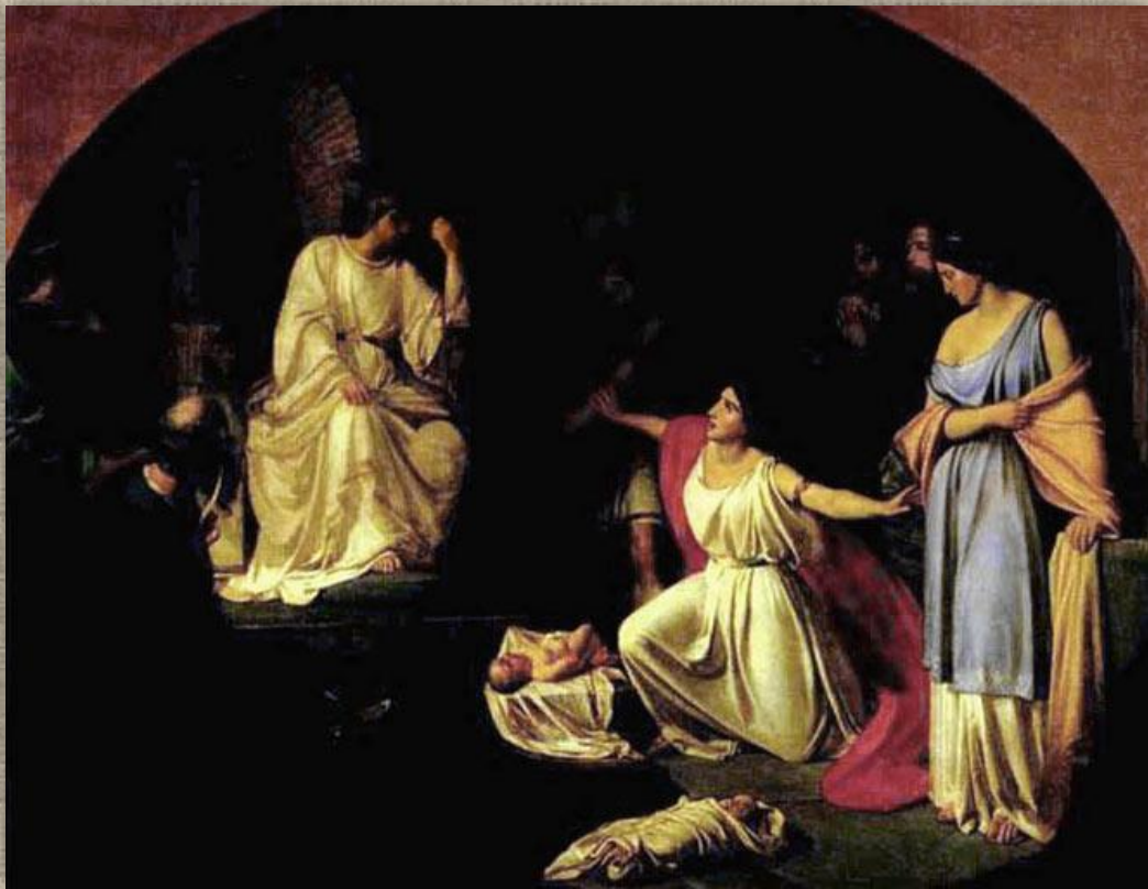
Николай Николаевич Ге «Суд Соломона»