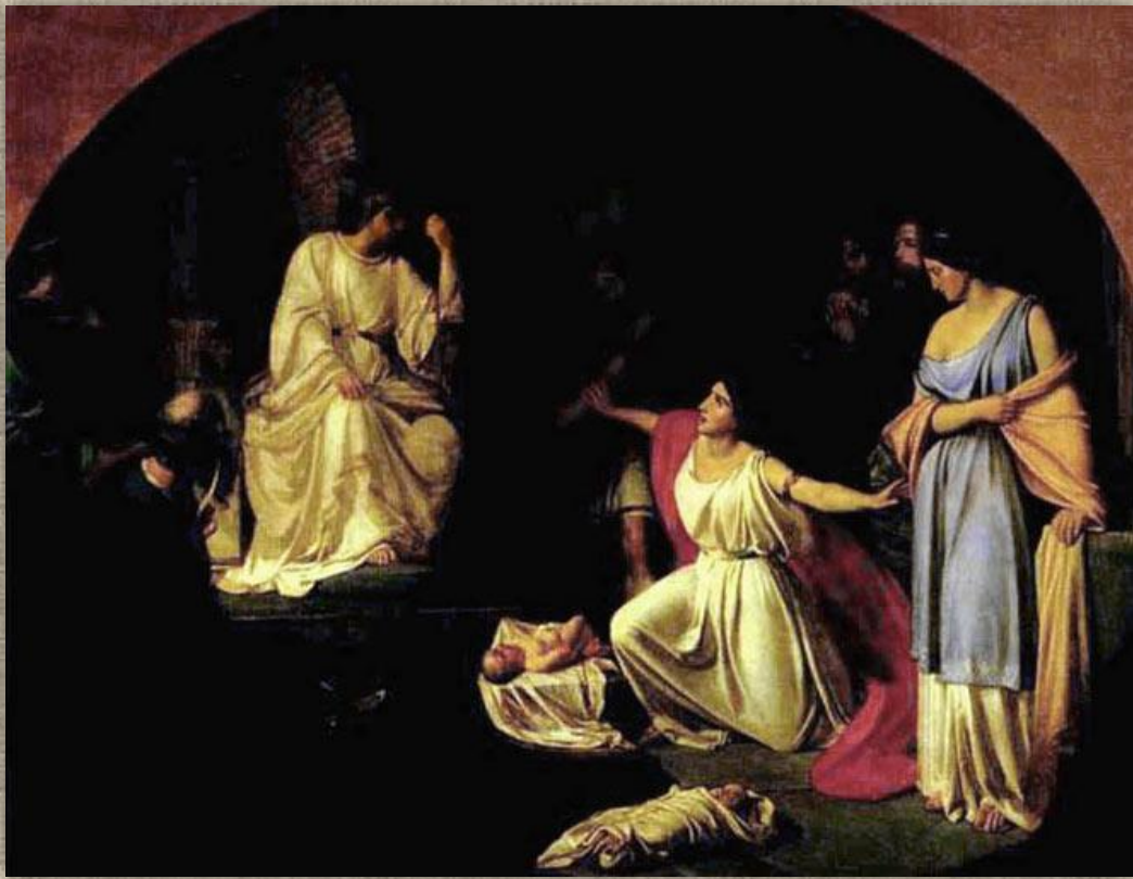
Николай Николаевич Ге «Суд Соломона»