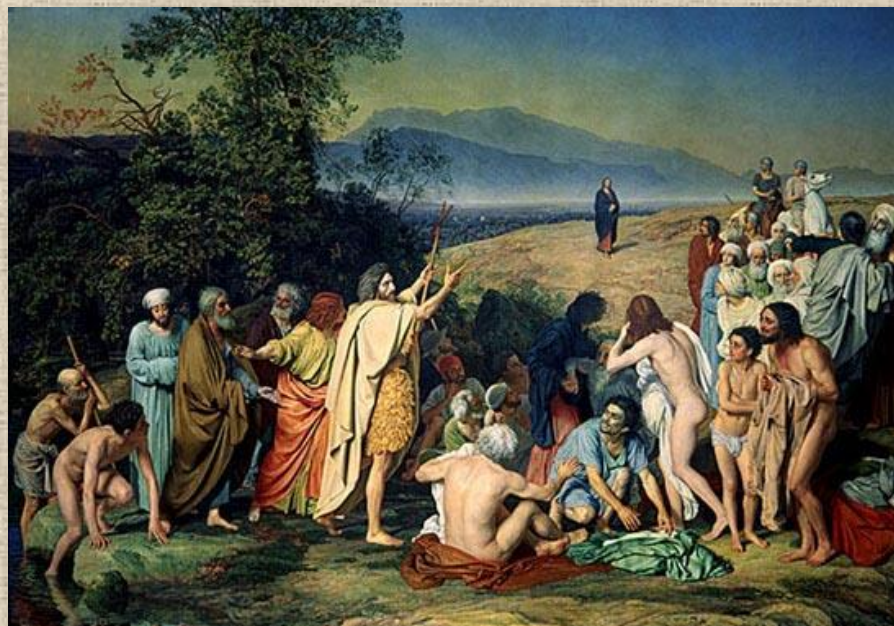
А.Иванов «Явление Христа народу»