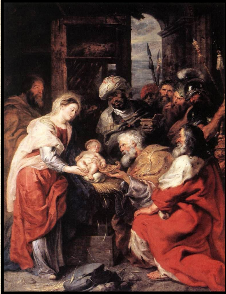
Питер Пауль Рубенс «Поклонение волхвов». Париж. Лувр