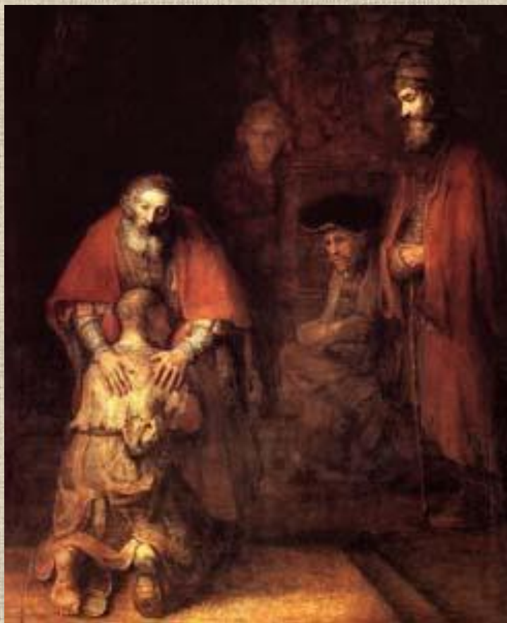
Рембрандт «Возвращение блудного сына»