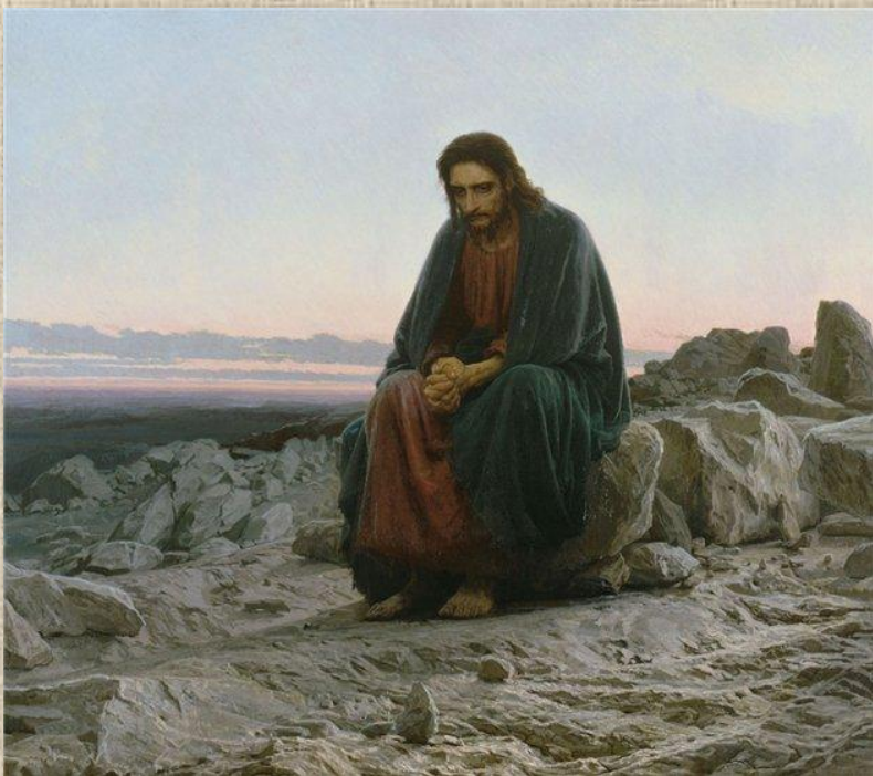
И.Крамской «Христос в пустыне». 1872. Государственная Третьяковская галерея