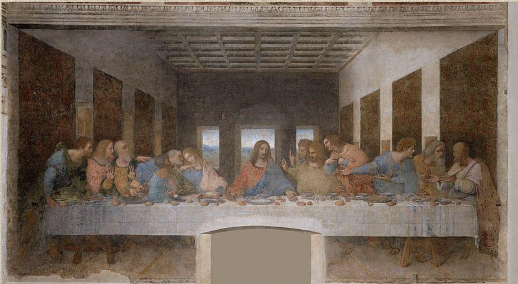
Леонардо да Винчи «Тайная вечеря»