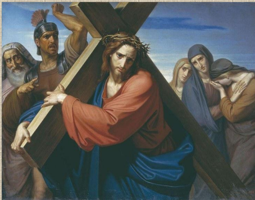
Федор Антонович Моллер «Несение креста». 1869.