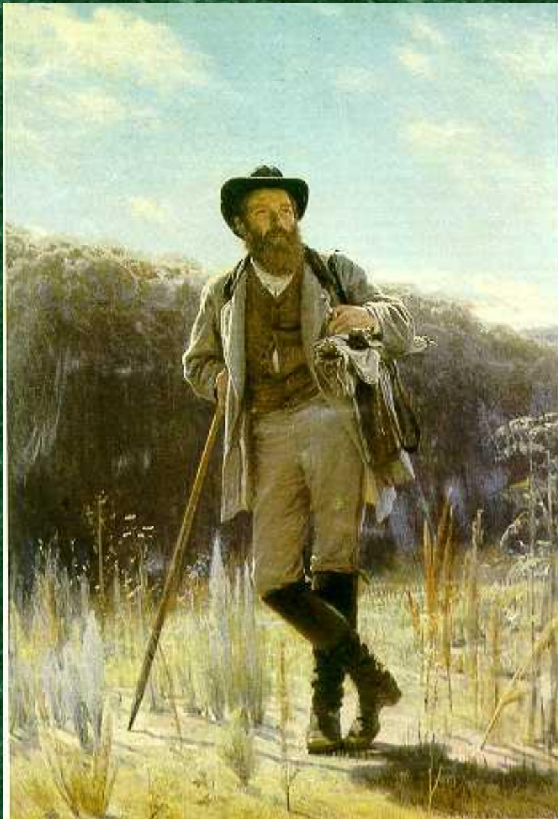
Портрет И. И. Шишкина, работа И. Крамского