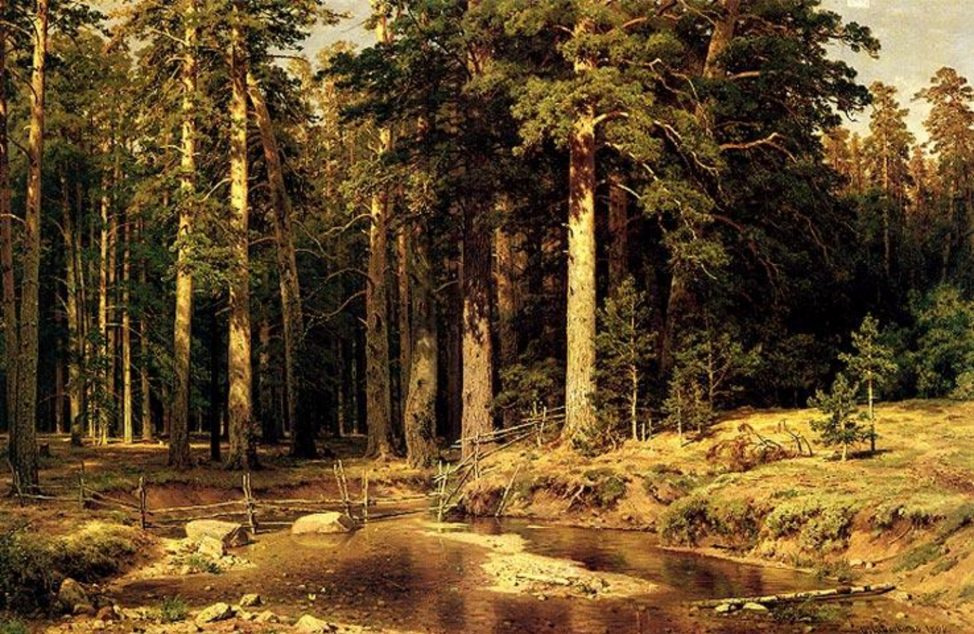
Корабельная роща. 1898 год