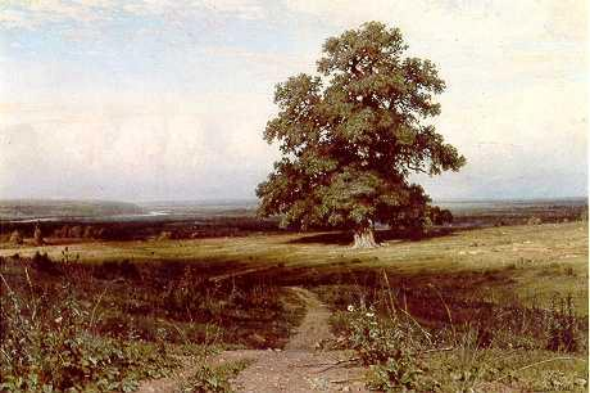
Среди долины ровныя, 1883 год