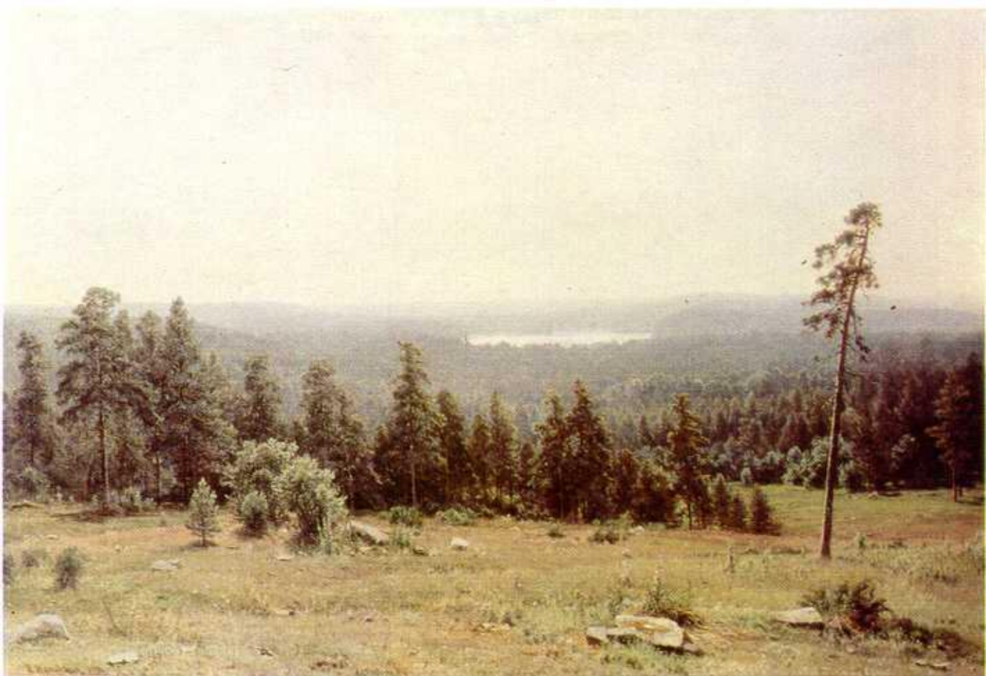
Лесные дали 1884 год