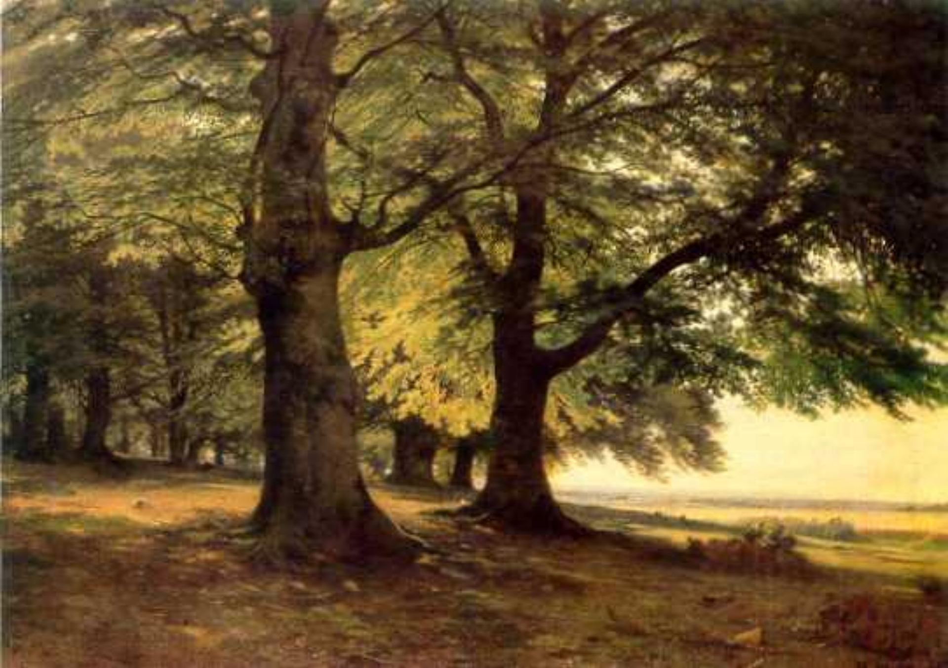
Тевтобургский лес, 1865 год