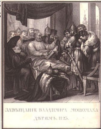
«Завещание Владимира Мономаха детям». Литография 1836 года по рисунку Бориса Чорикова.