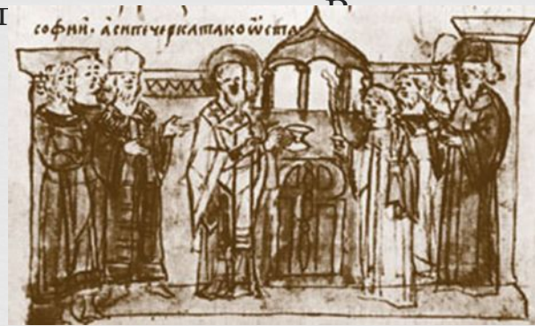
Настолование митрополита Илариона (миниатюра Радзивилловской летописи)