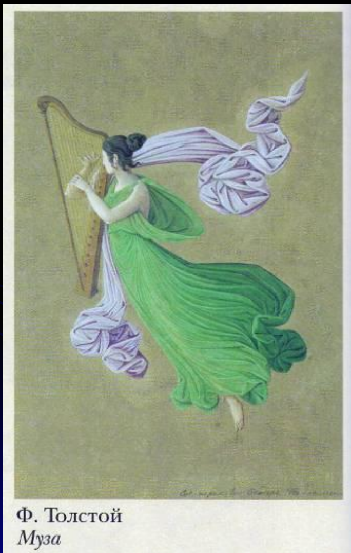
Ф. Толстой Муза

У Зевса и богини памяти Мнемозины было девять дочерей. Они приходились сводными сёстрами Аполлону и жили вместе с ним на Парнасе. Каждая покровительствовала какому-нибудь виду искусства или науки.