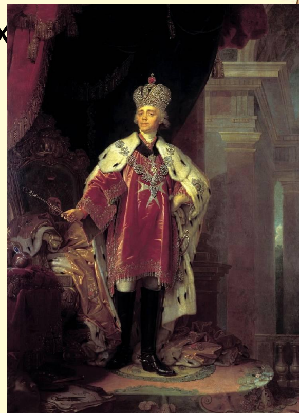
Портрет императора Павла I