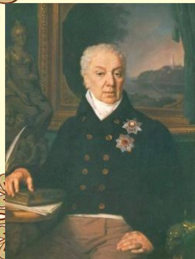
Портрет Д.П. Троцкого