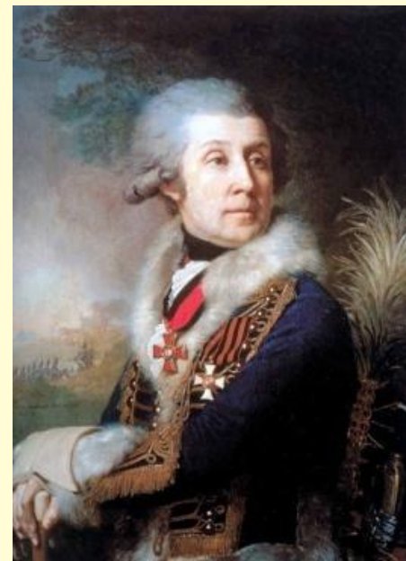
Портрет Ф.А. Боровиковского