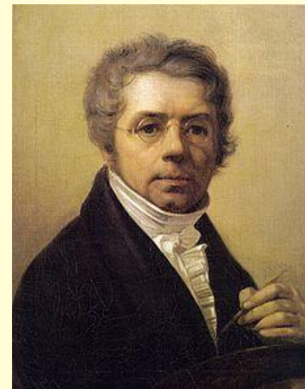
Ученик Боровиковского – художник А. Г. Венецианов