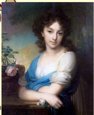
Портрет Е.А. Нарышкиной