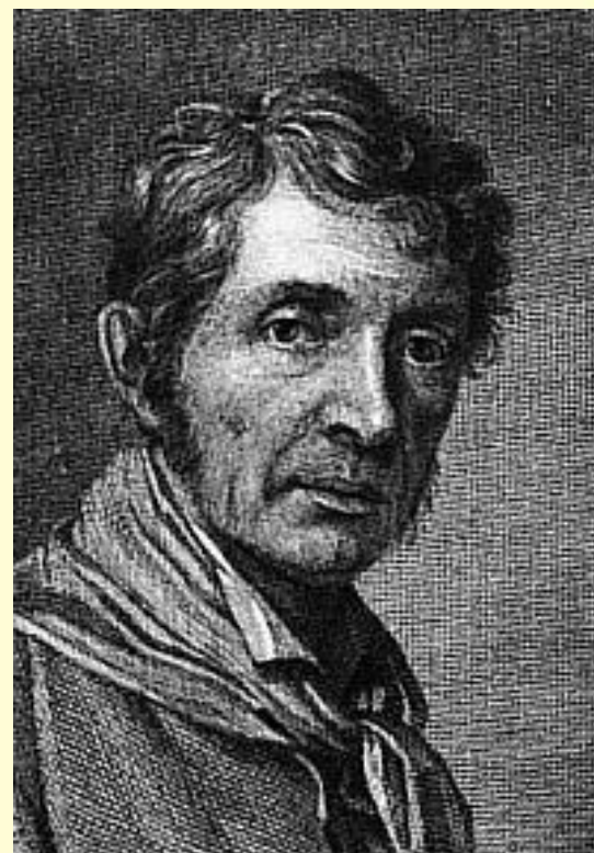
Учитель Боровиковского – художник И.Б. Лампи