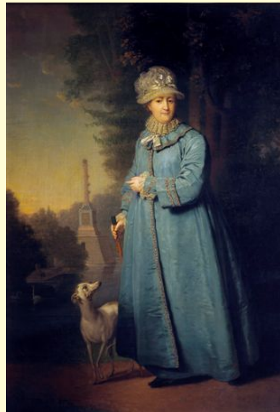
«Екатерина II на прогулке в Царскосельском парке»