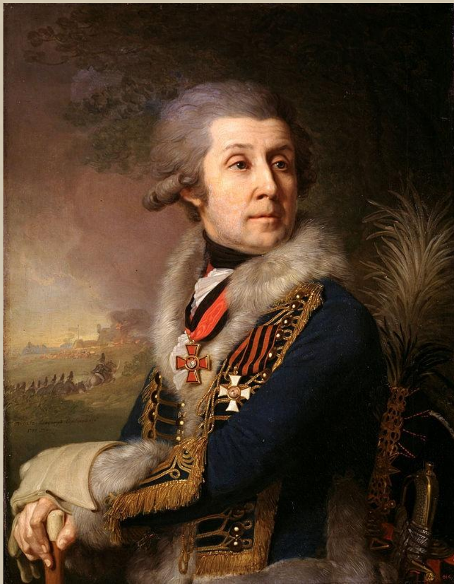
генерал-майор Ф. А. Боровский