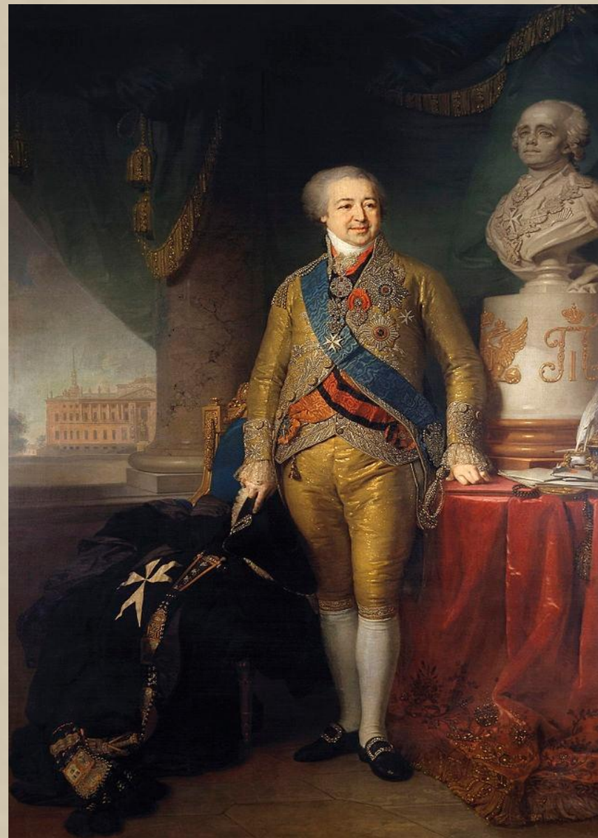
вице-канцлер князь А. Б. Куракин