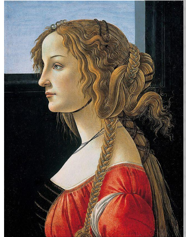
Портрет молодой женщины