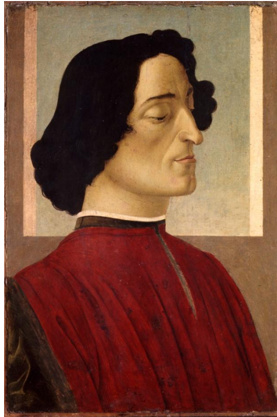
Портрет Джулиано де Медичи