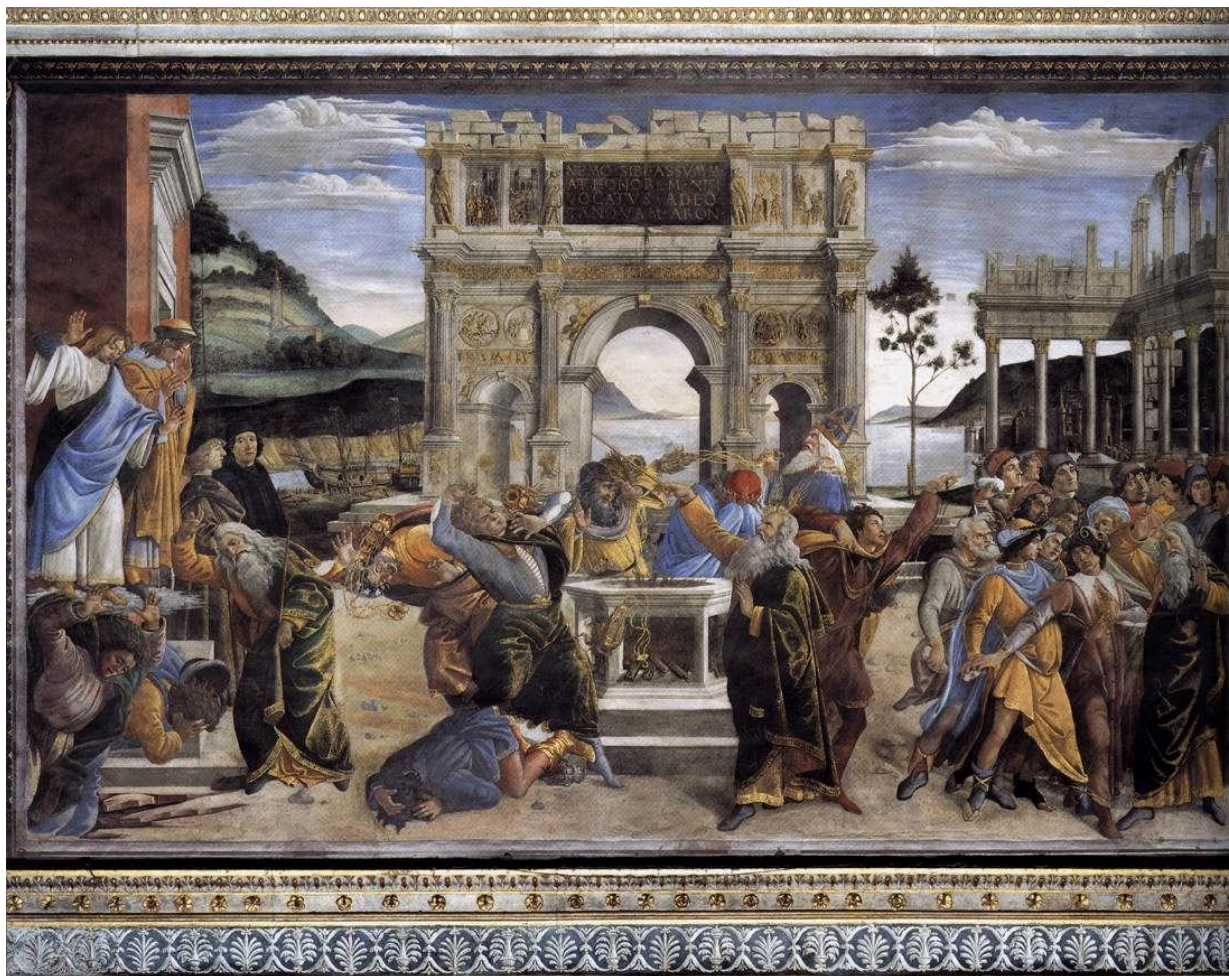
Наказание Корея, Дафна и Авирона