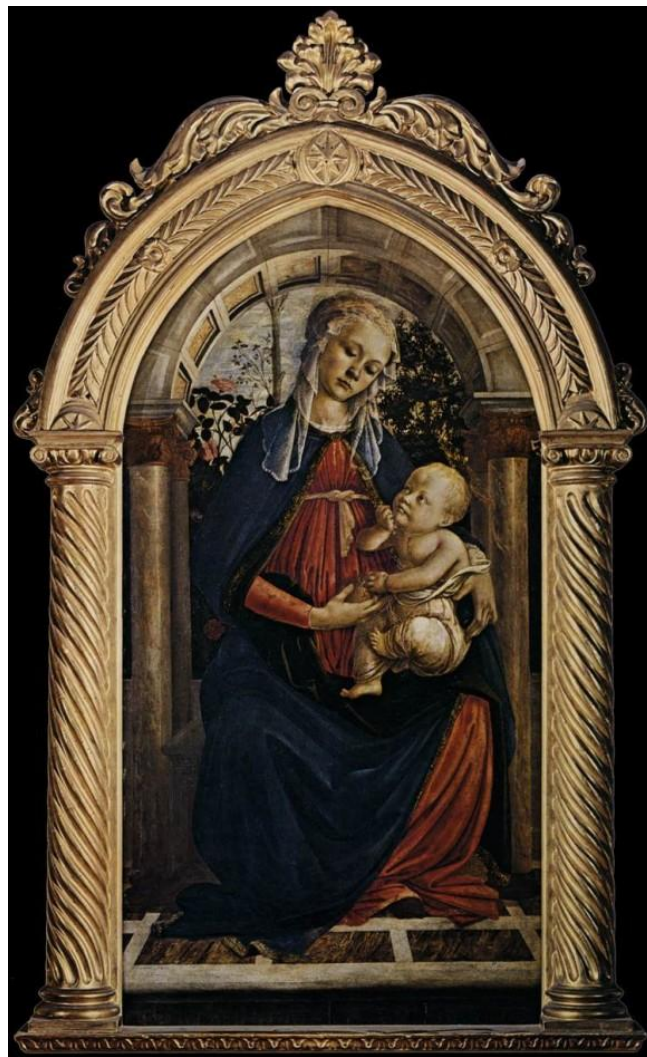
Мадонна в розовом саду