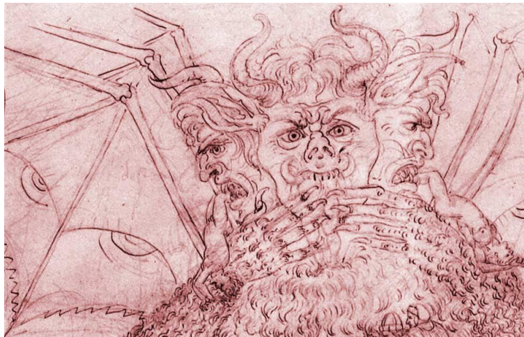
Люцифер, терзающий в Аду трёх величайших грешников человечеств а