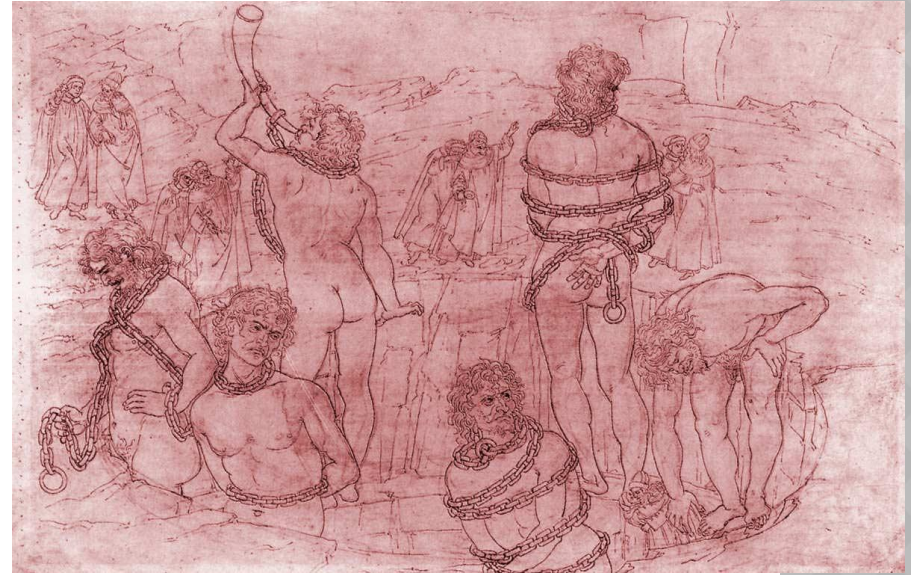
Древние гиганты в Аду