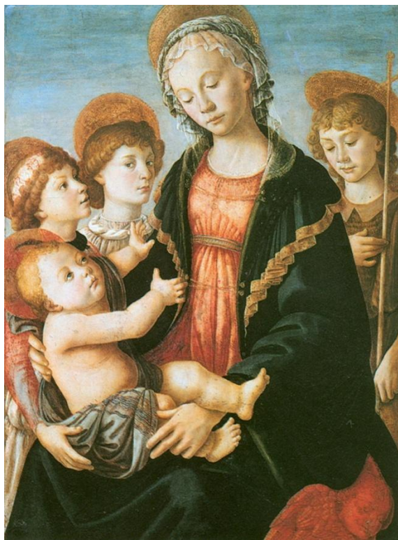
Мадонна с Младенцем, двумя ангелами и юным Иоанном Крестителем