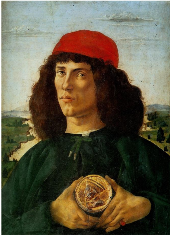
Портрет неизвестного с медалью Козимо