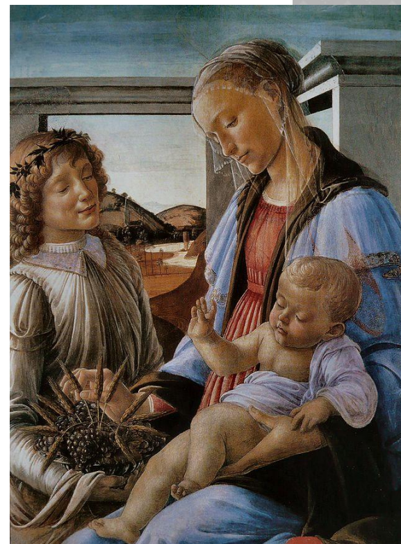
Мадонна Евхаристи и