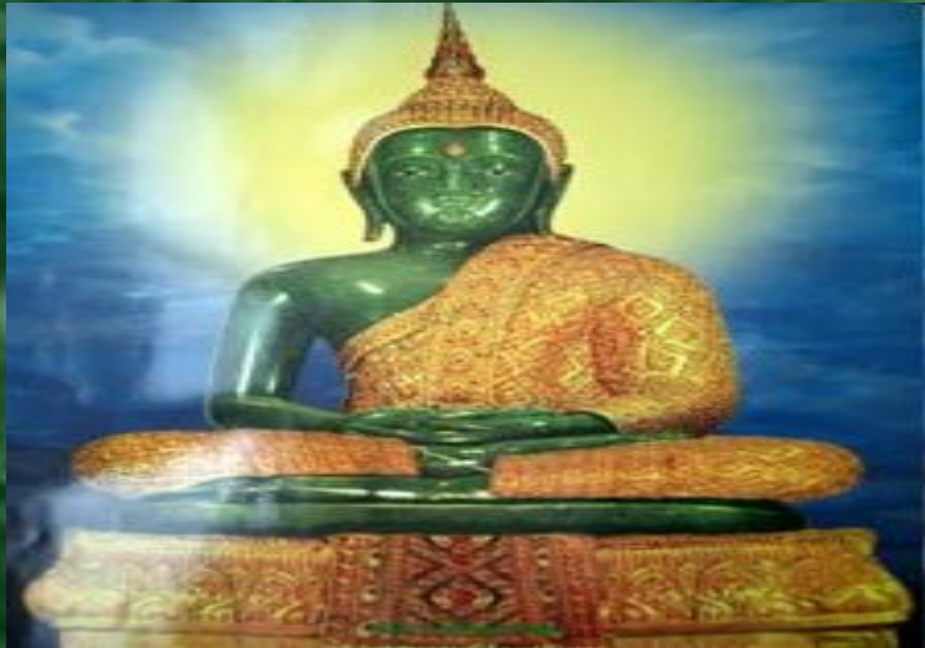
Статуя Будды. Бангкок. Таиланд