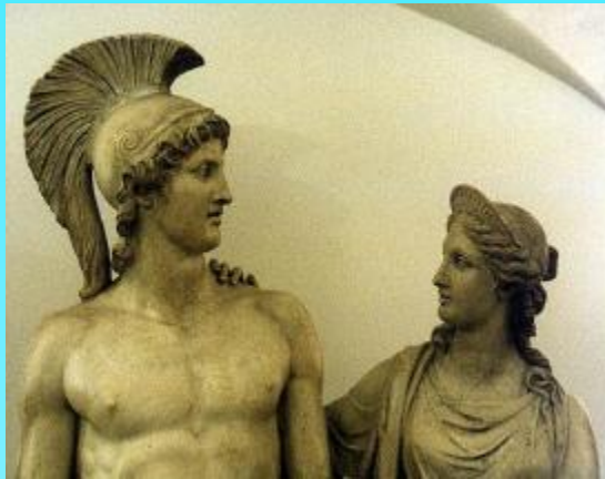
Тесей и Ариадна. Автор - Adamo Tadolini. Скульптура