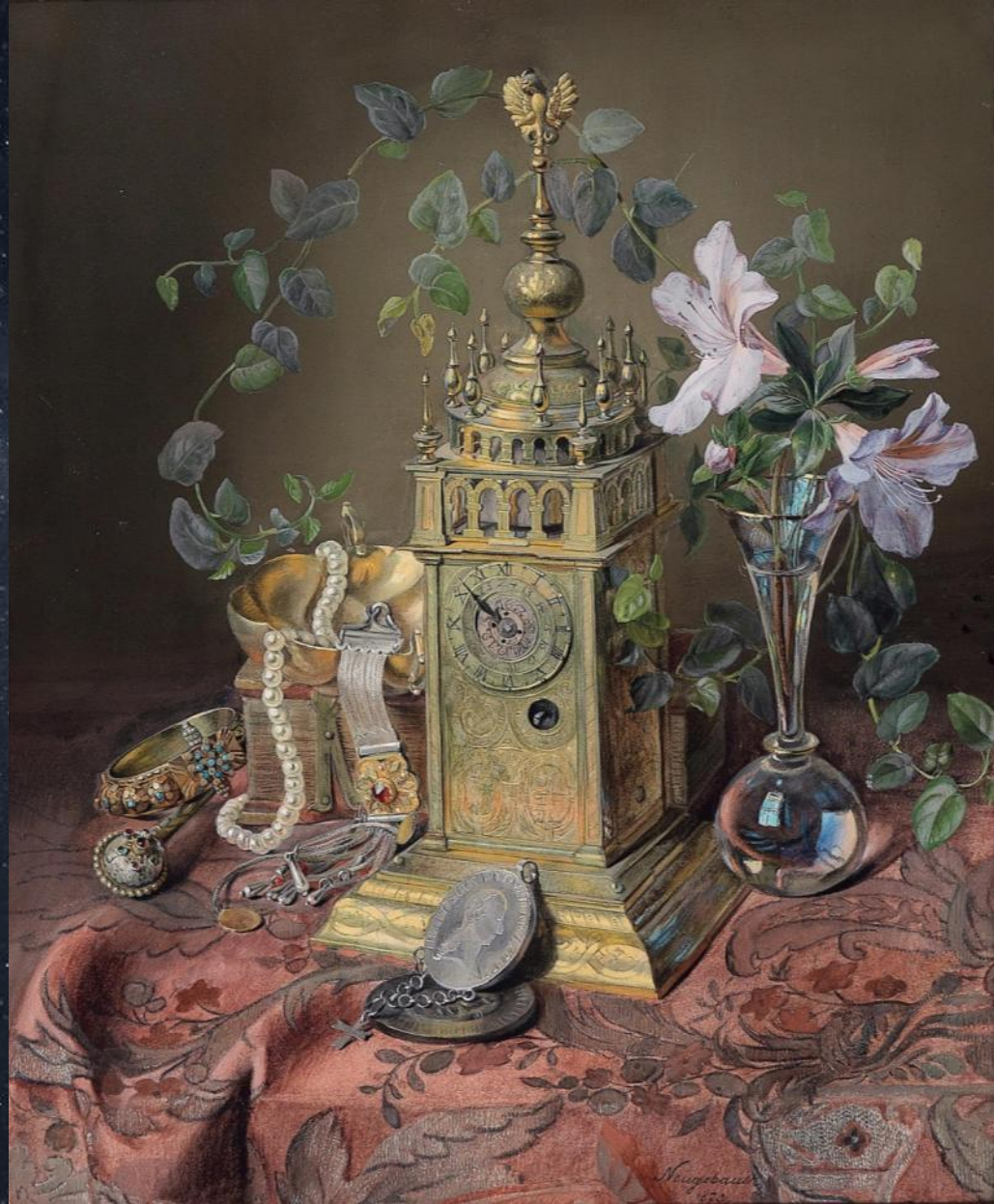
Йозеф Нойгбауэр. Натюрморт с часами. 1873