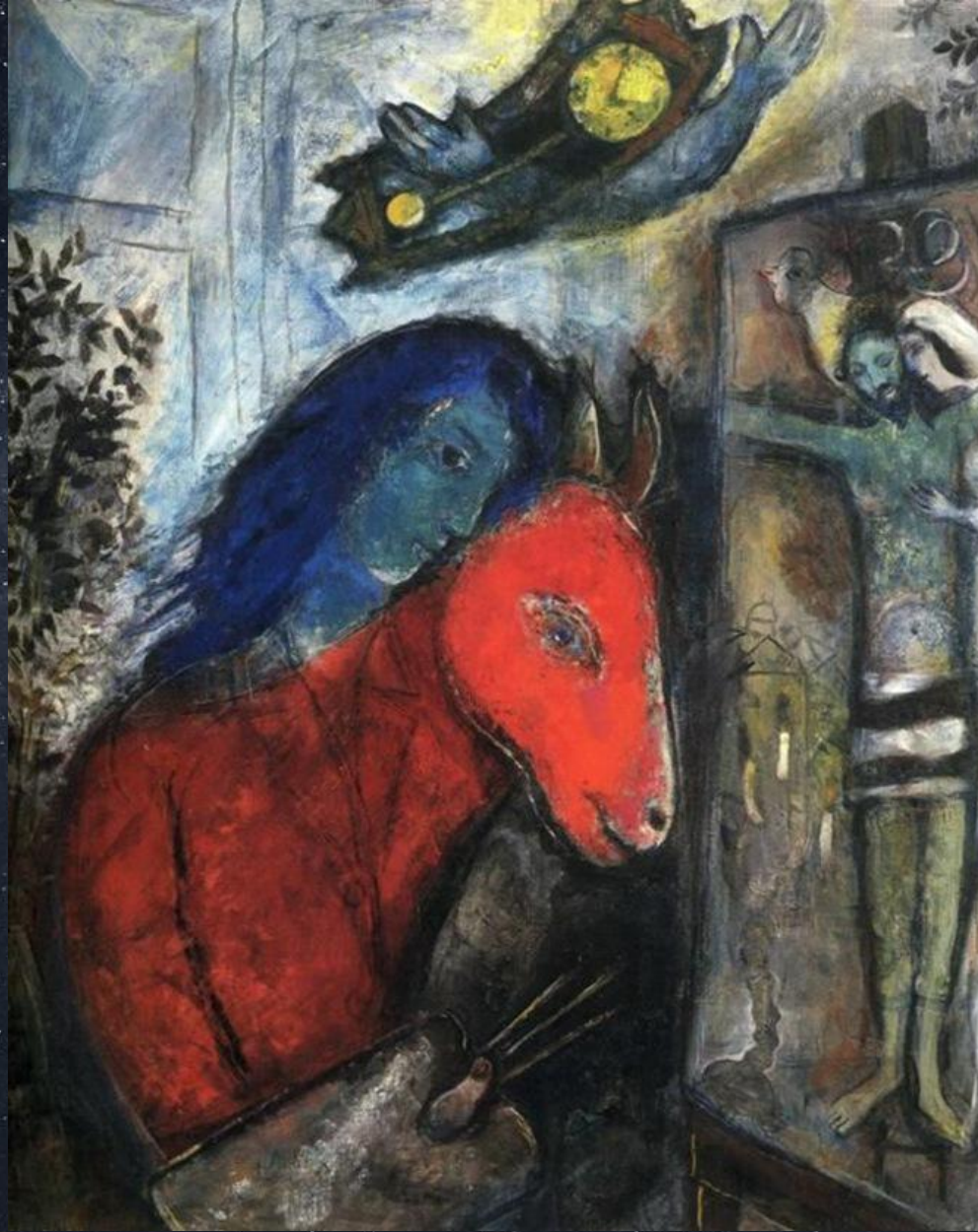
Марк Шагал. Автопортрет с напольными часами. Перед распятием. 1947