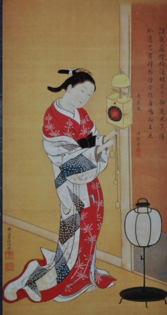
Нишикава Суkenобу. Красавица и часы. Первая половина 18-го века