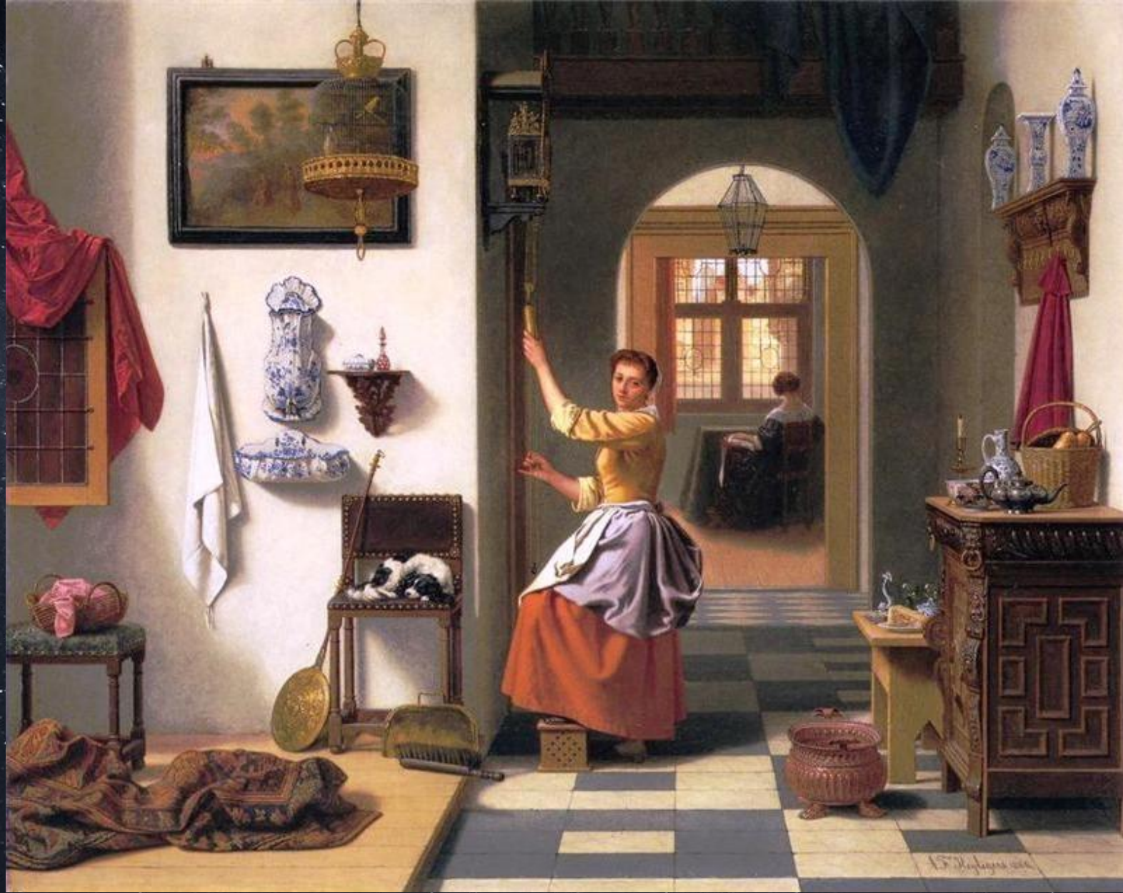
Антон Франсуа Хейлигер. Завод часов. 1866