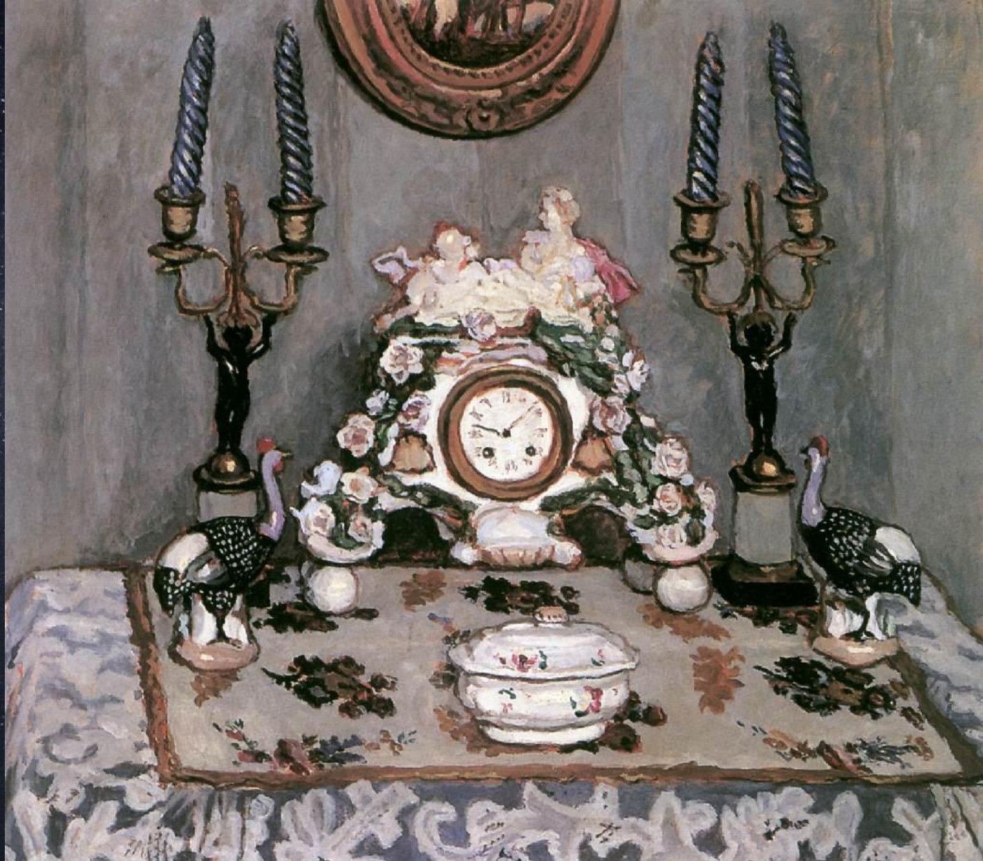
Адольф Феньеш. Натюрморт с фарфоровыми часами. 1910