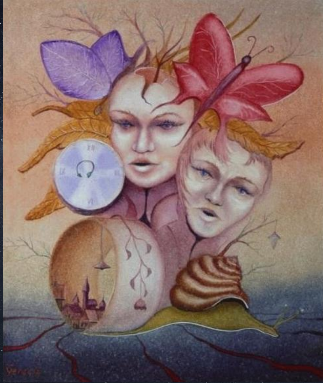
Арпад Гергели. Часы. 1981