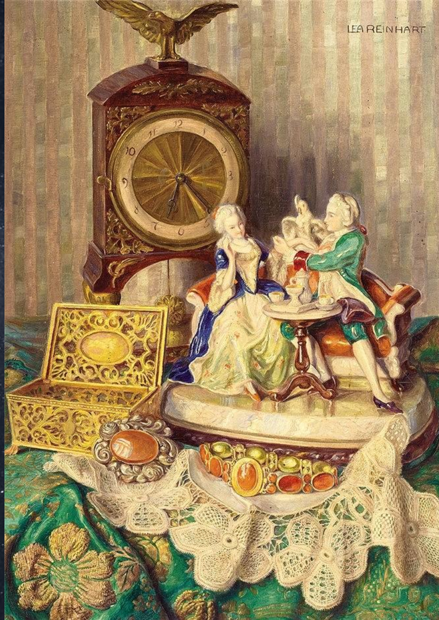
Леа Рейнхарт. Натюрморт с фарфоровыми фигурками, часами и кружевом на вышитой ткани.