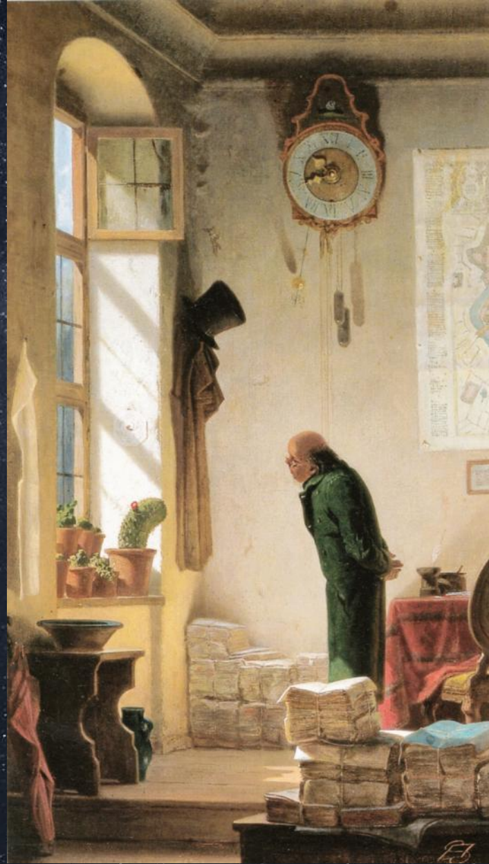
Карл Шпицвег. Любитель кактусов. 1850