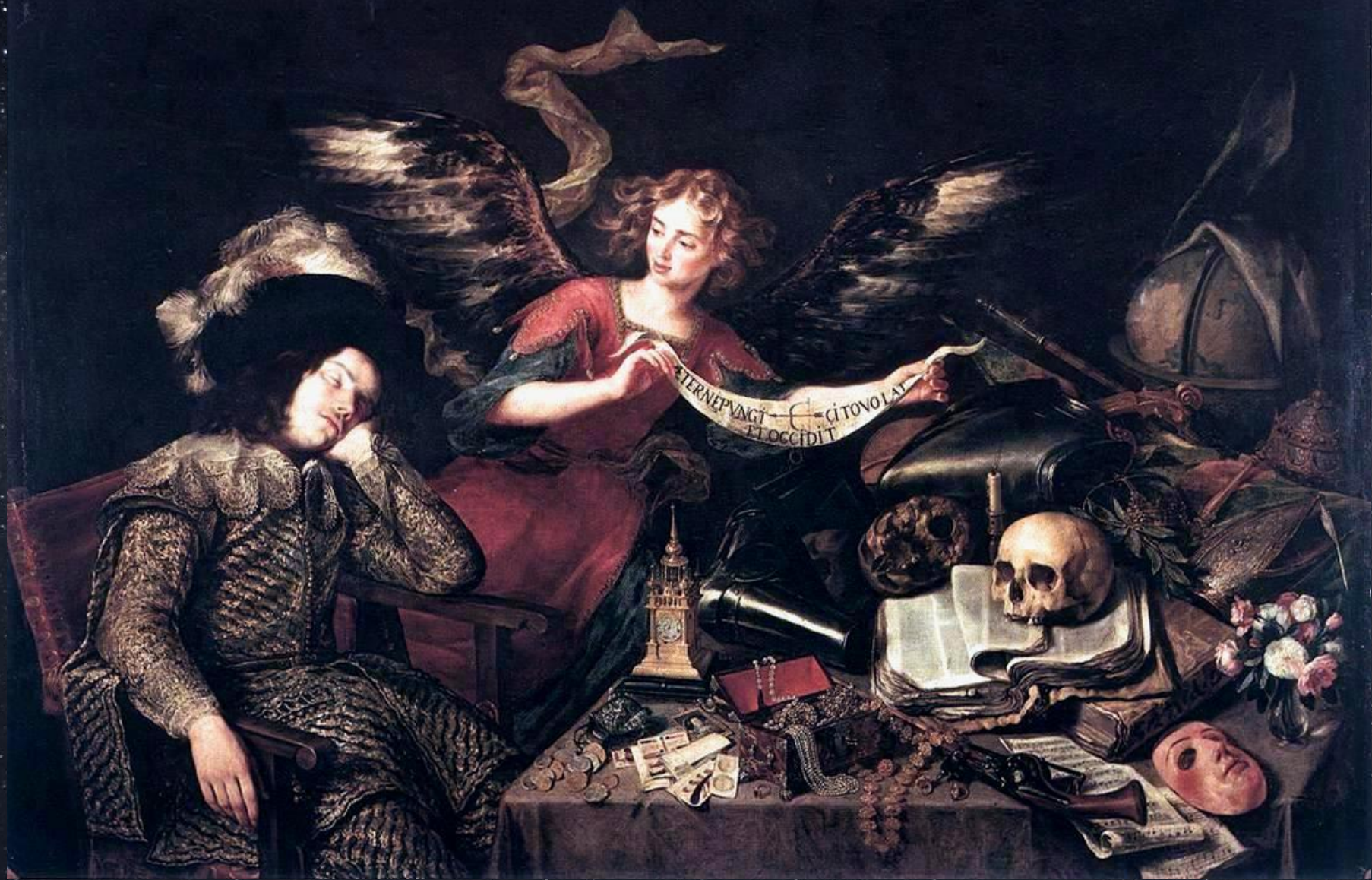
Антонио де Переда. Сон рыцаря