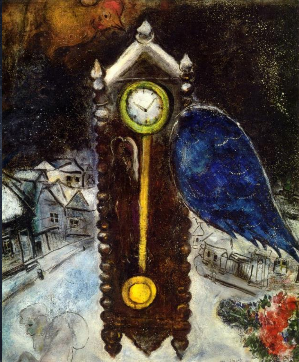
Марк Шагал. Часы с синим крылом. 1949