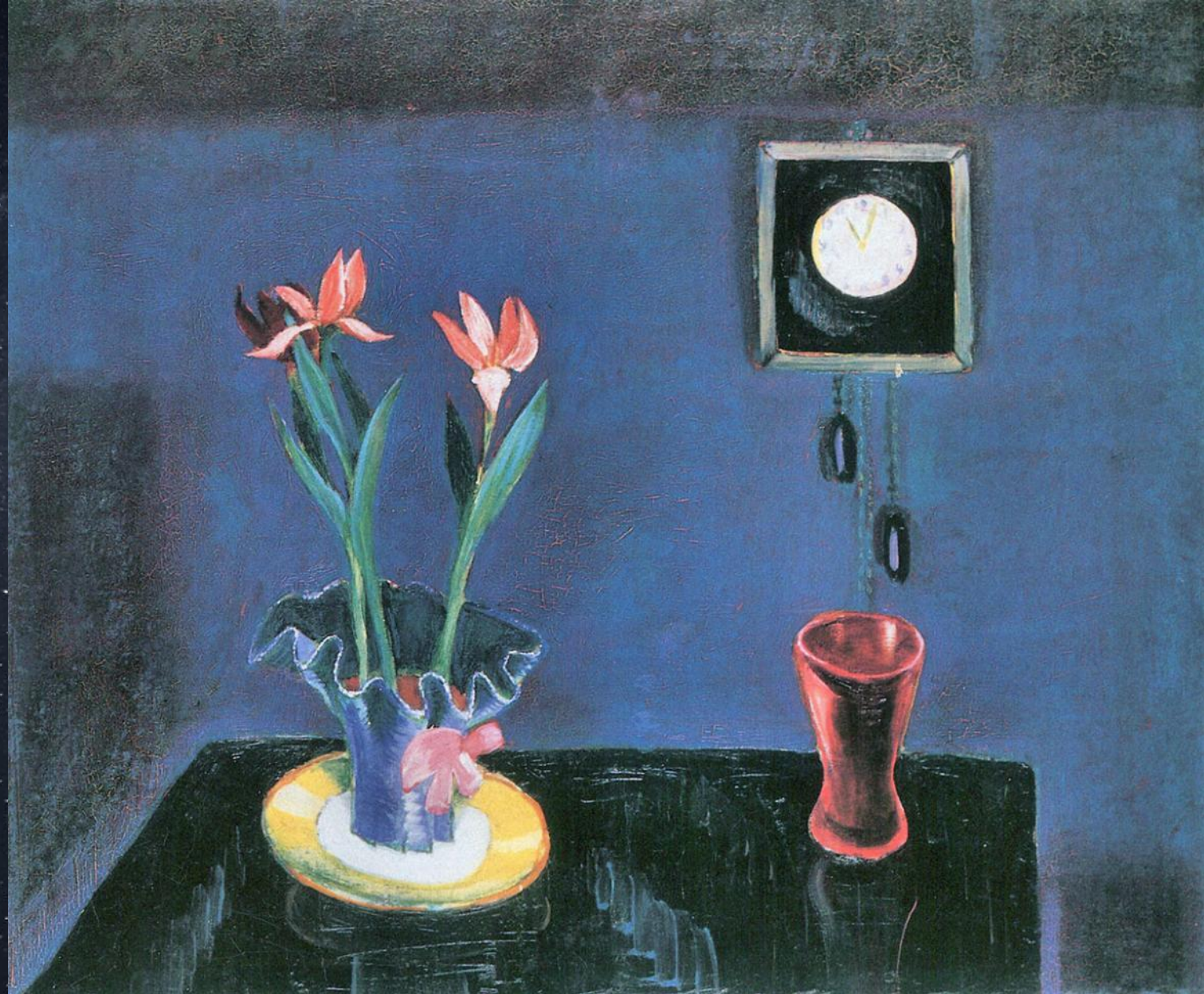
Вальтер Граматте. Натюрморт с часами и вазой с тюльпанами. Ок.1922