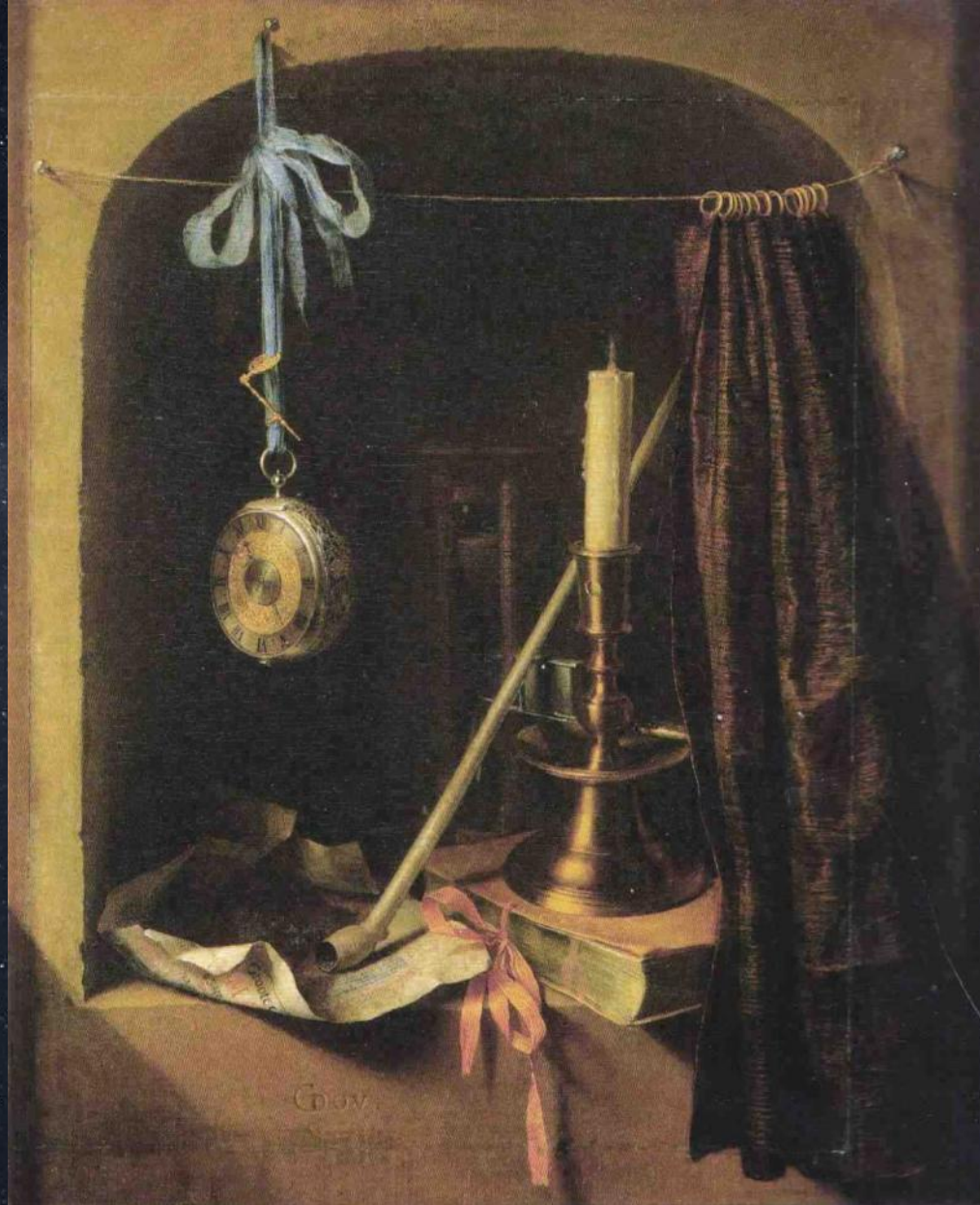
Геррит Доу. Натюрморт с подсвечником и карманными часами. 17-й век