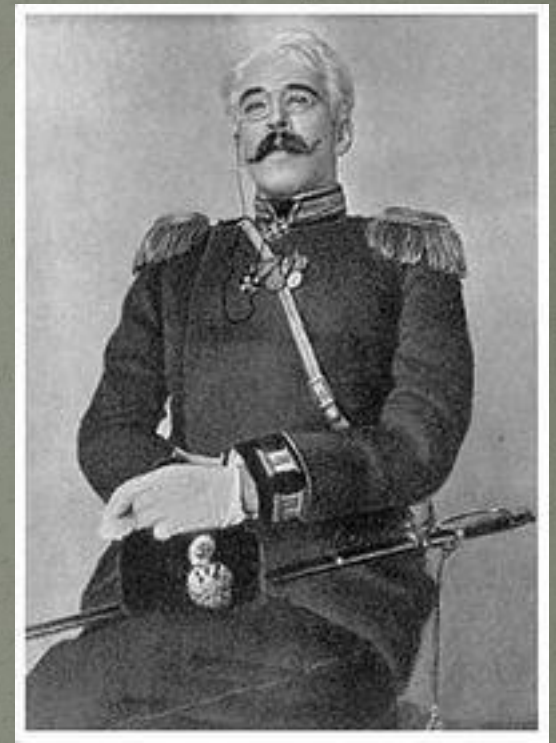
Станиславский в роли Вершинина.

Работу над спектаклем в Художественном театре начинал К. С. Станиславский, — снова, как и в предыдущих постановках, ключом к спектаклю для него стало «раздвоение мира», «противоречие поэзии и прозы». По собственному признанию режиссёра, работа шла тяжело, и был момент, когда пьеса «не звучала, не жила, казалась скучной и длинной»