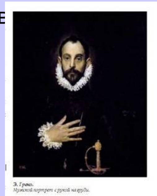
Э. Греко. Мужской портрет с рукой на груди.

На закате XVI столетия в творчестве испанского художника Эль Греко (1541—1614) возникает новый тип портрета, в котором передается необычная внутренняя сосредоточенность человека, интенсивность его духовной жизни, погруженность в собственный внутренний мир. Для этого художник использует резкие контрасты освещения, оригинальный колорит, порывистые движения или застывшие позы.