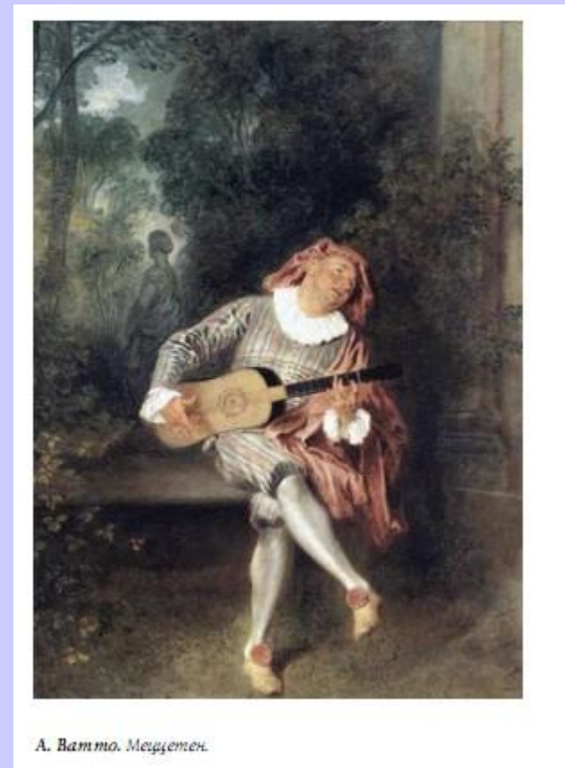
А. Ватто. Мецценен.