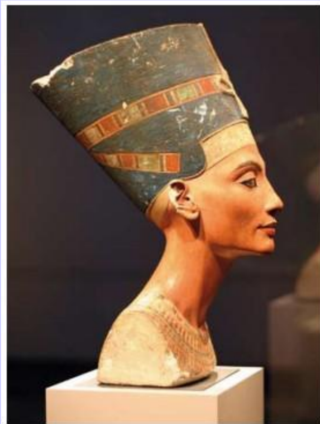
Нефертити. Древний Египет