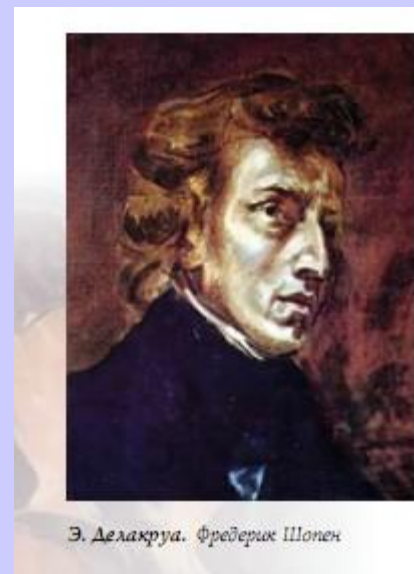
Э. Делакруа. Фредерик Шонен

Едва переступив порог, отделяющий XVII в. от XVIII, увидим на портретах другую породу людей, отличающуюся от предшественников. Придворно-аристократическая культура вывела на первый план стиль рококо с его утонченно-обольстительными, задумчиво-томными, мечтательно-рассеянными образами.