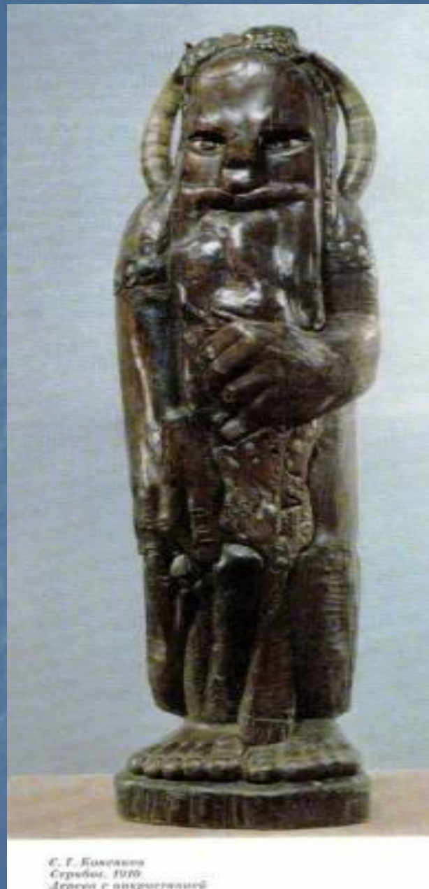
С. Г. Коненков Стрибог. 1910. Дерево с анкерной

Коненков С. Стрибог. Дерево. Начало 20 в.