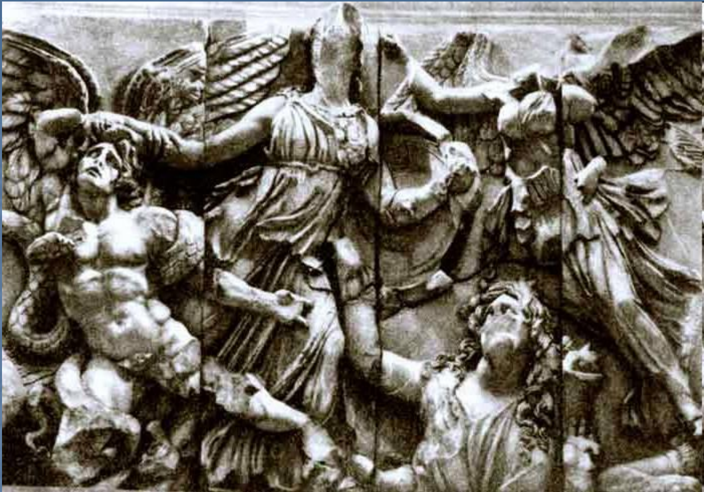
Рельеф Пергамского алтаря. Мрамор. 2 в. до н. э.