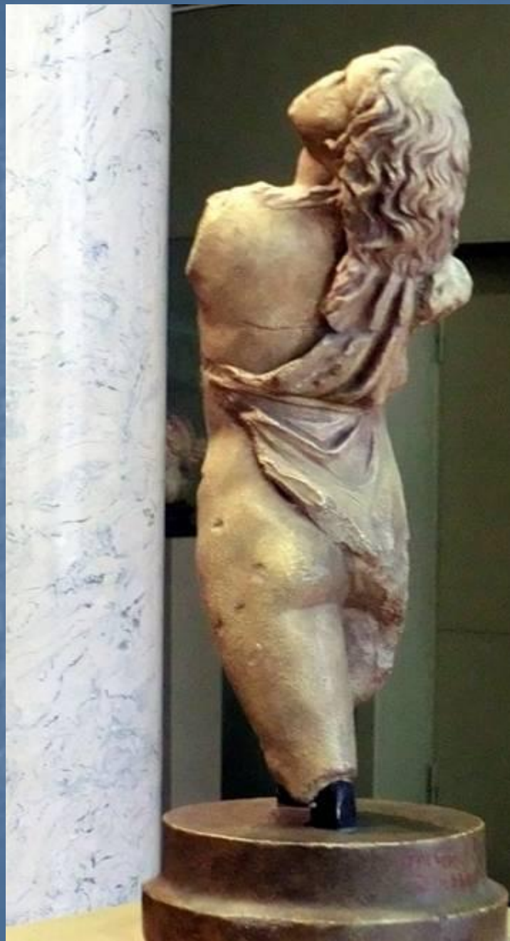
Скопас. Менада. Мрамор. 4 в. до н. э.