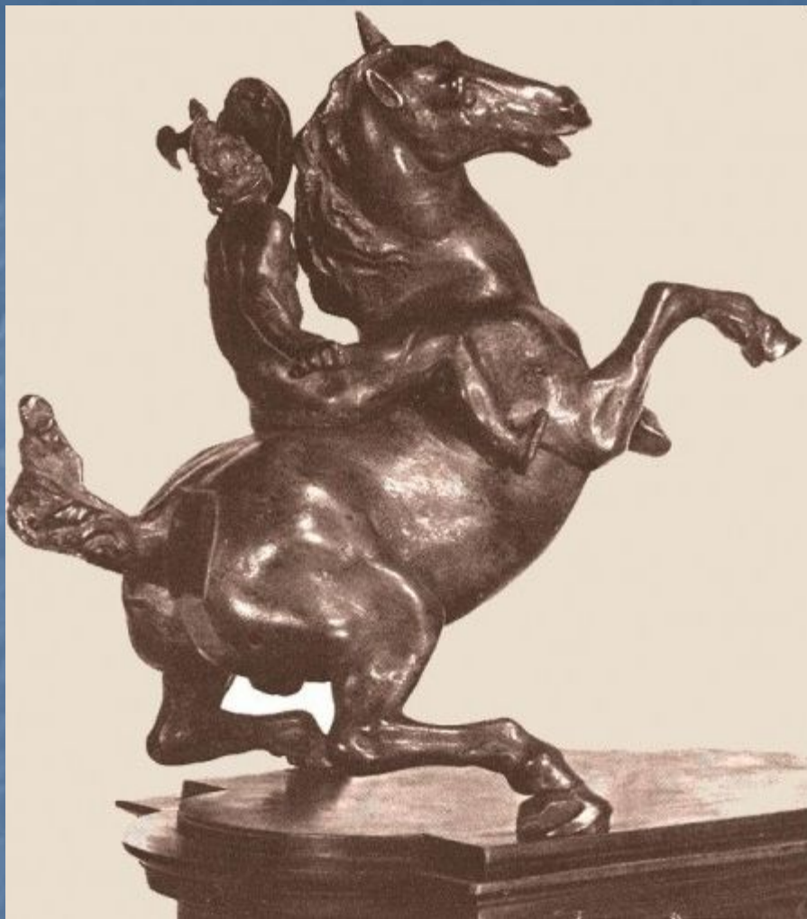
Леонардо да Винчи. Бронзовая миниатюрная модель памятника Лодовика Сфорца.