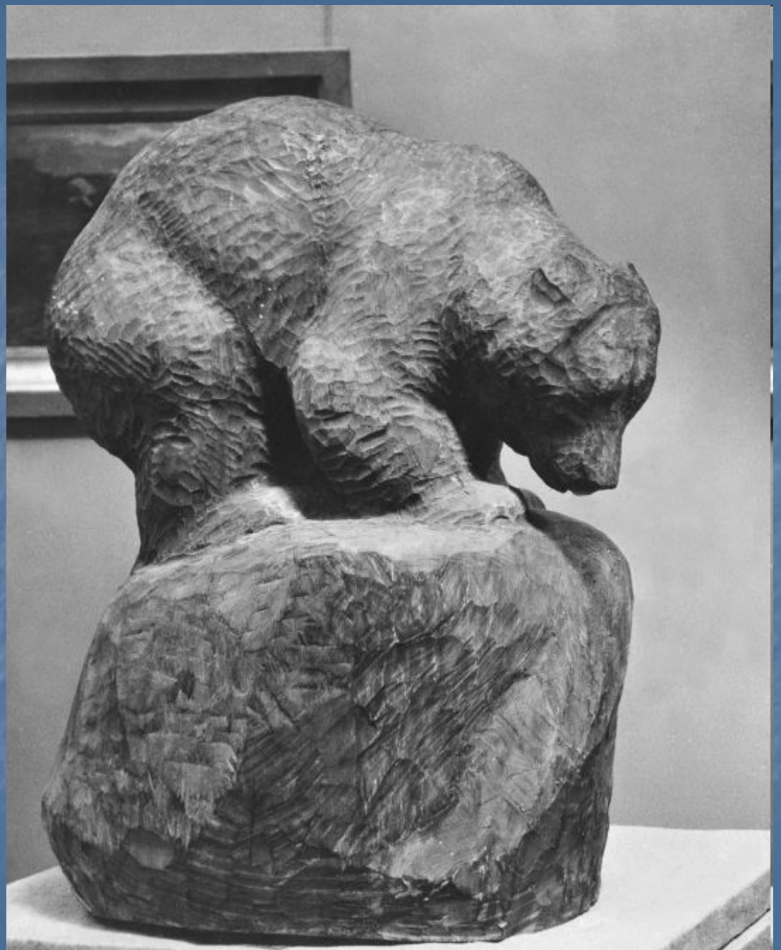
Ватагин В. А. Медведь. Дерево.