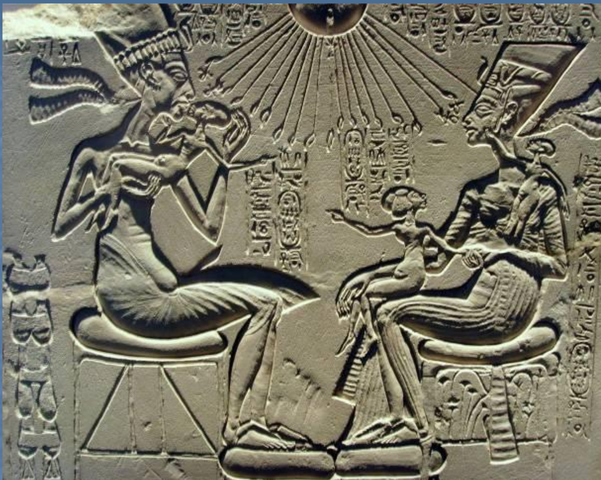
Эхнатон и Нефертити. 14 в. до н. э.