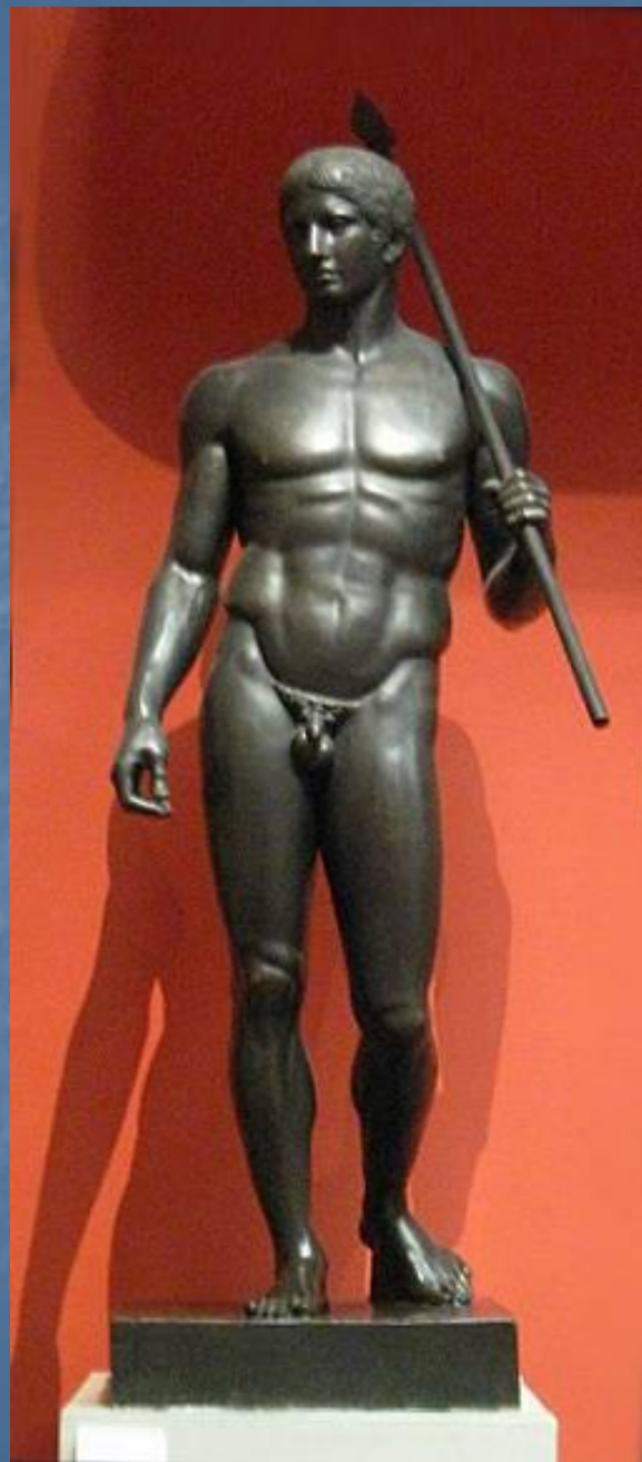
Поликлет Диадумен. Мрамор. Середина 5 в. до н. э.