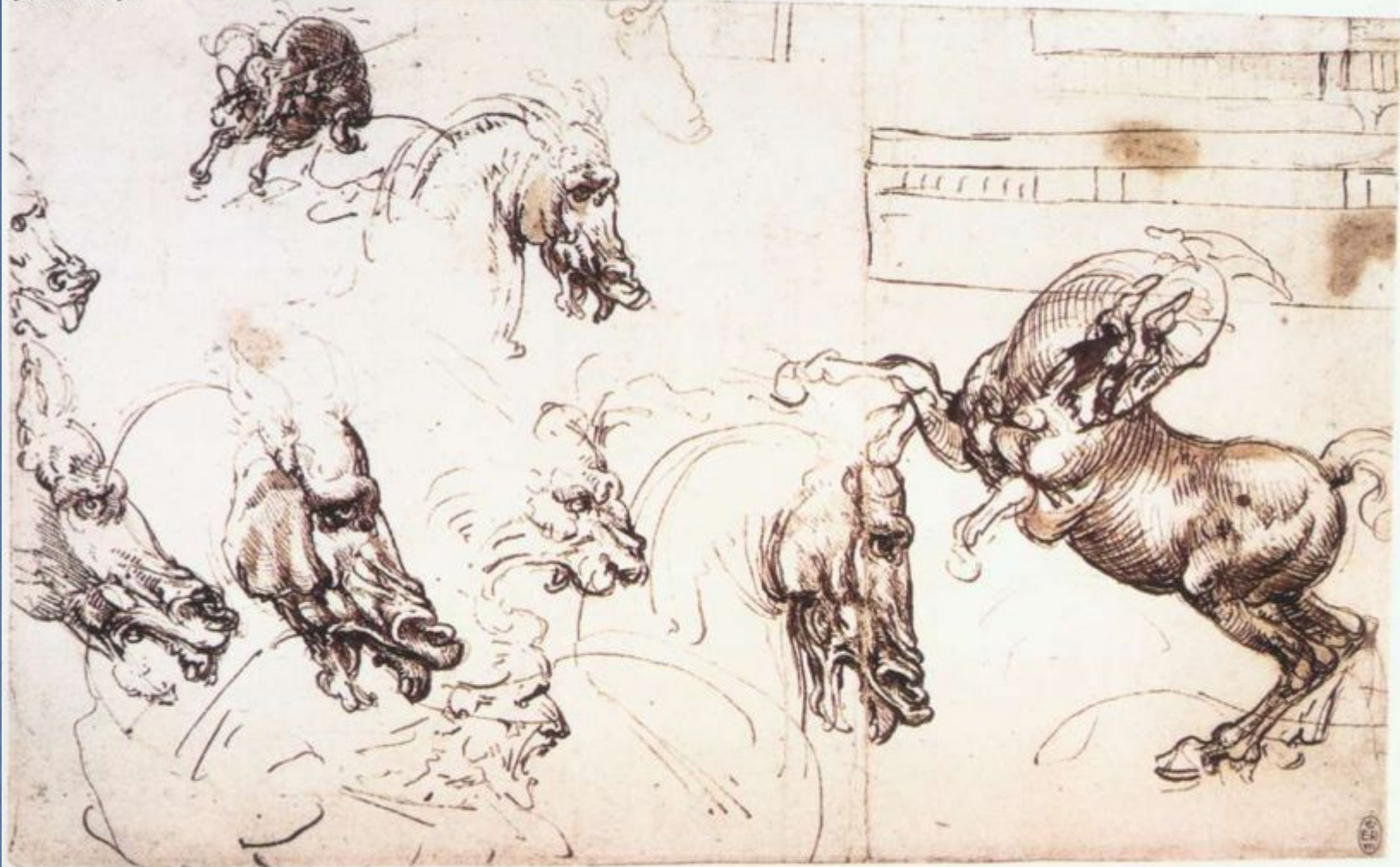
Рисунки Леонардо да Винчи к статуе Лодовико Сфорца.