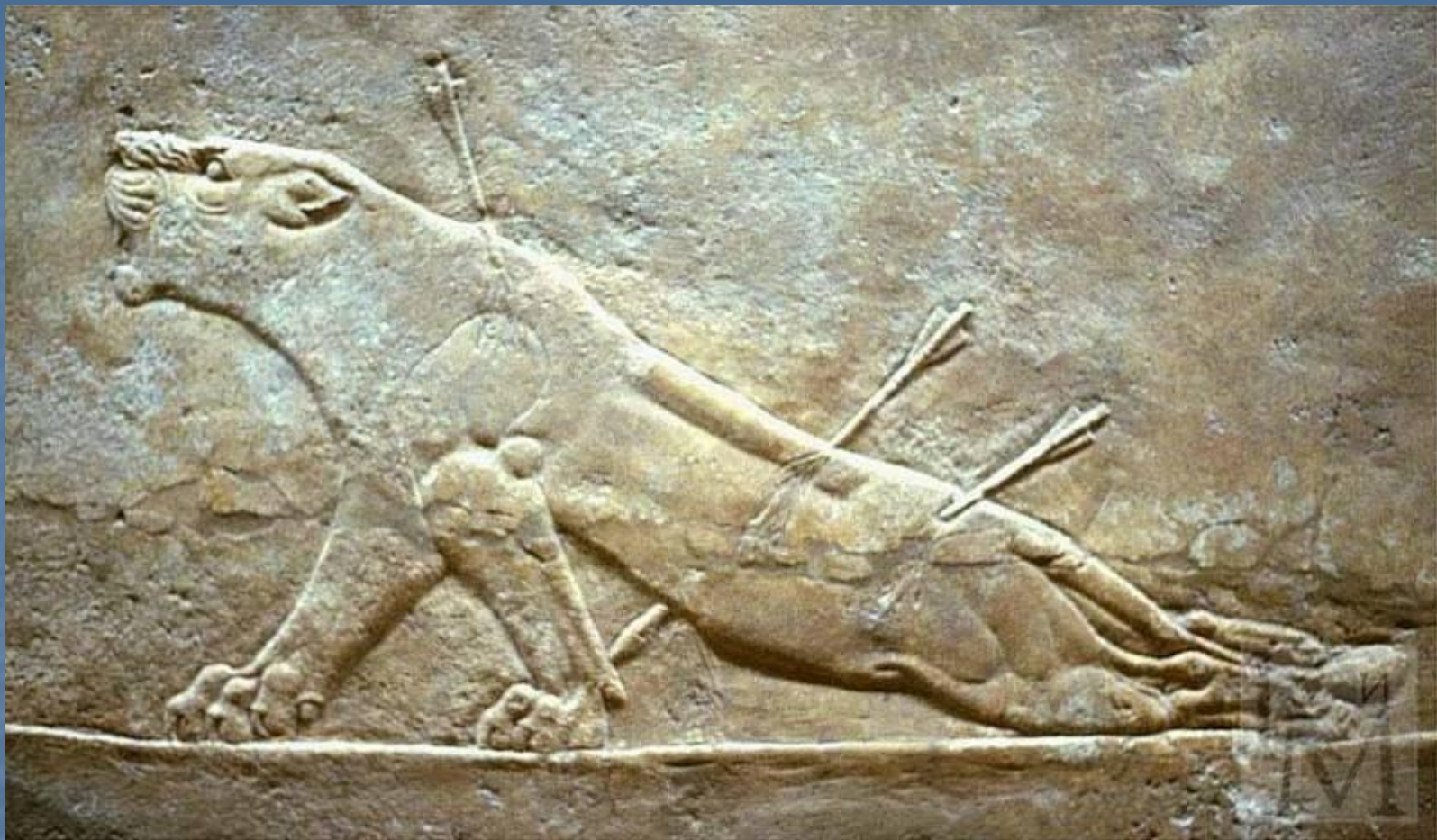
Раненая львица. Рельеф из дворца Ашшурбанипала. 7 в. до н. э.