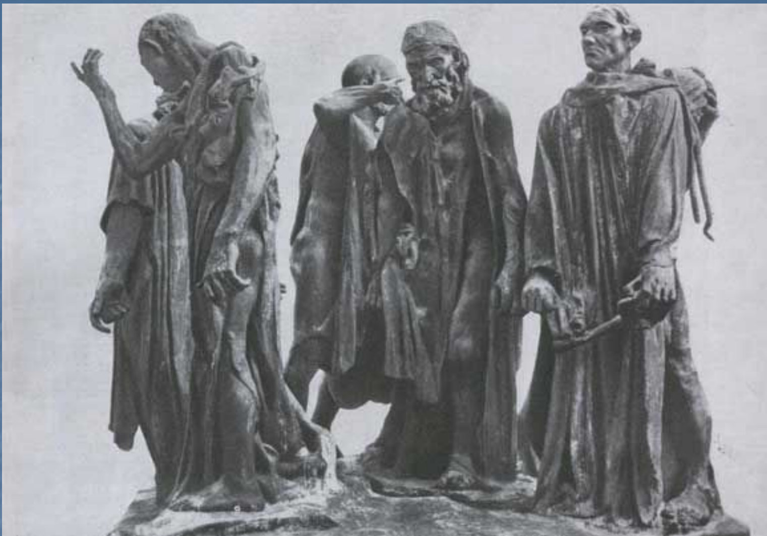
Роден. О. Граждане Кале. Бронза. 1884-1888. Скульптурная группа, установленная на площади Кале, напоминает о мужестве и чести его граждан.