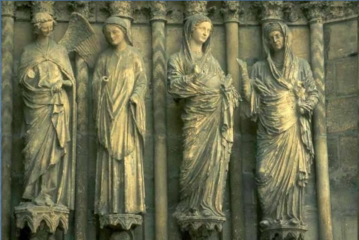
Скульптурные группы Благовещение и Мария и Елизавета с южного портала Реймского собора. 13 в.