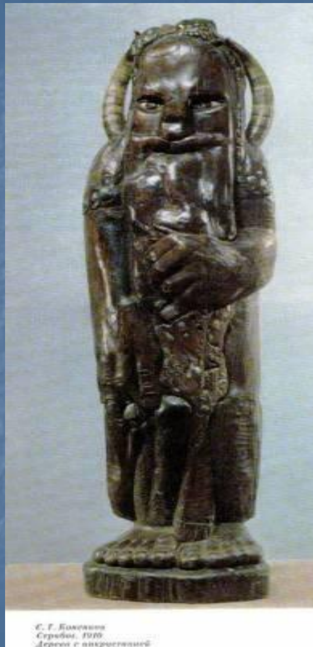
С. Г. Коненков Стрибог. 1910. Дерево с анкерной

Коненков С. Стрибог. Дерево. Начало 20 в.