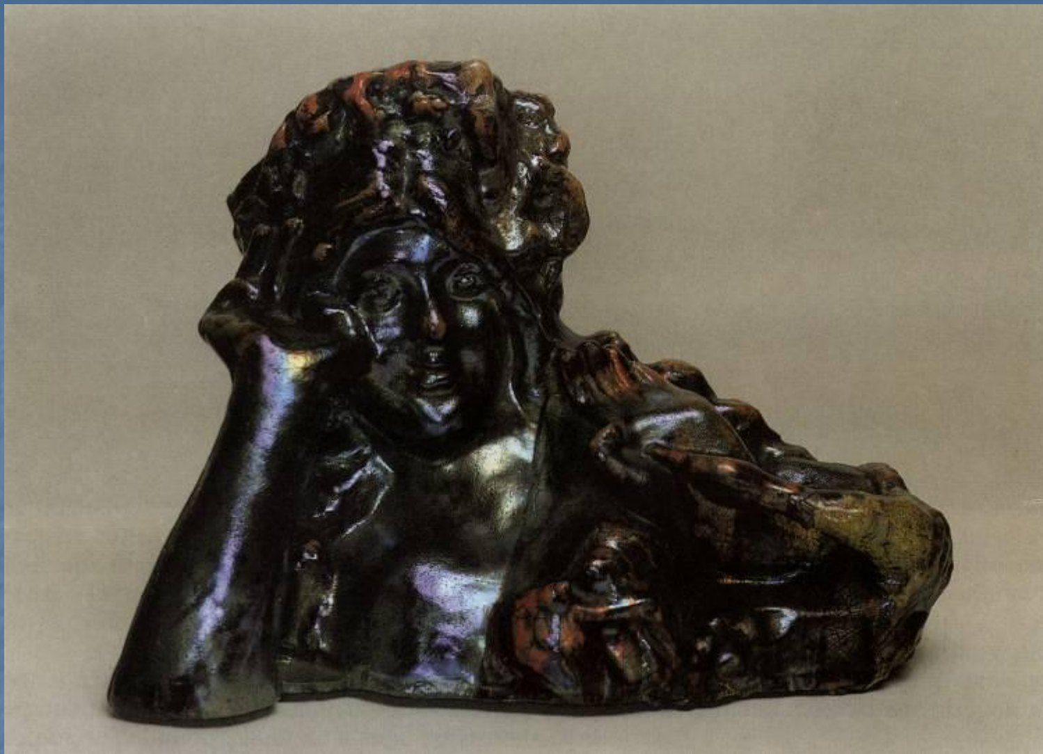
Врубель М. А. Весна. Майолика. Начало 20 в. В этой скульптуре Врубель запечатлел одну из героинь оперы Римского-Корсакова «Снегурочка».