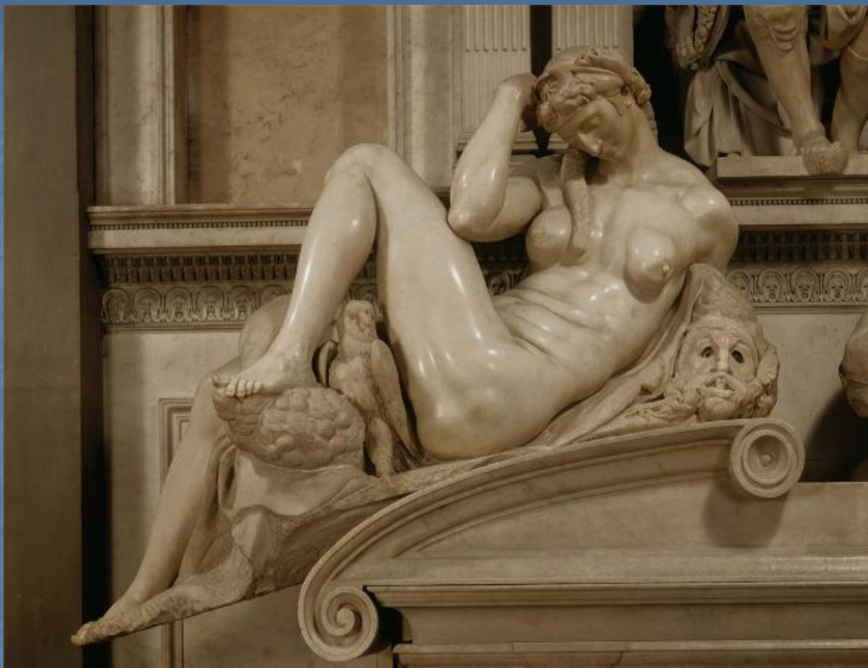
Микеланджело. Ночь. Надгробие герцога Джулиано. Мрамор. 1520-1534.