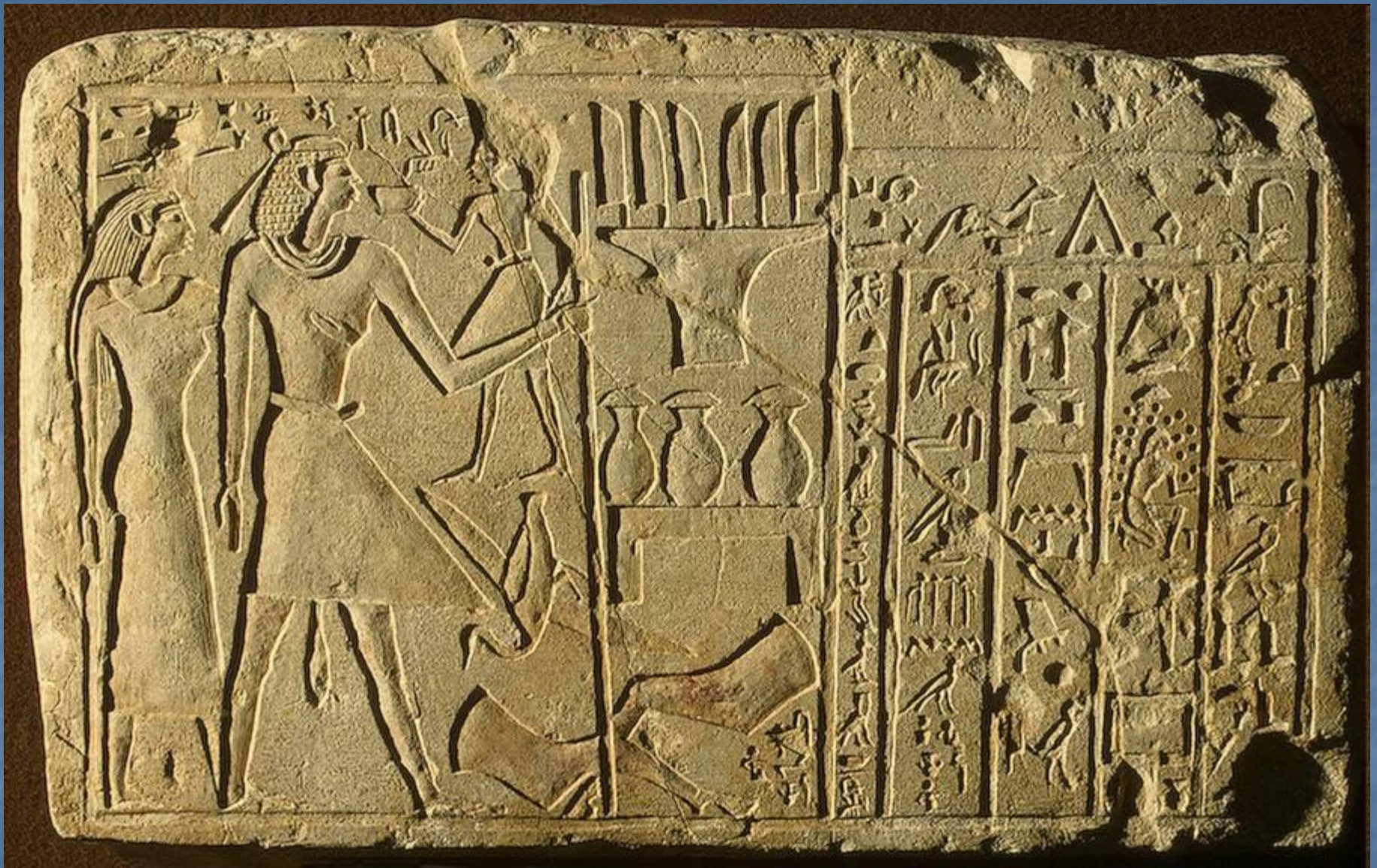
Гробница Херемхеба в Саккара близ Мемфиса. Древний Египет.