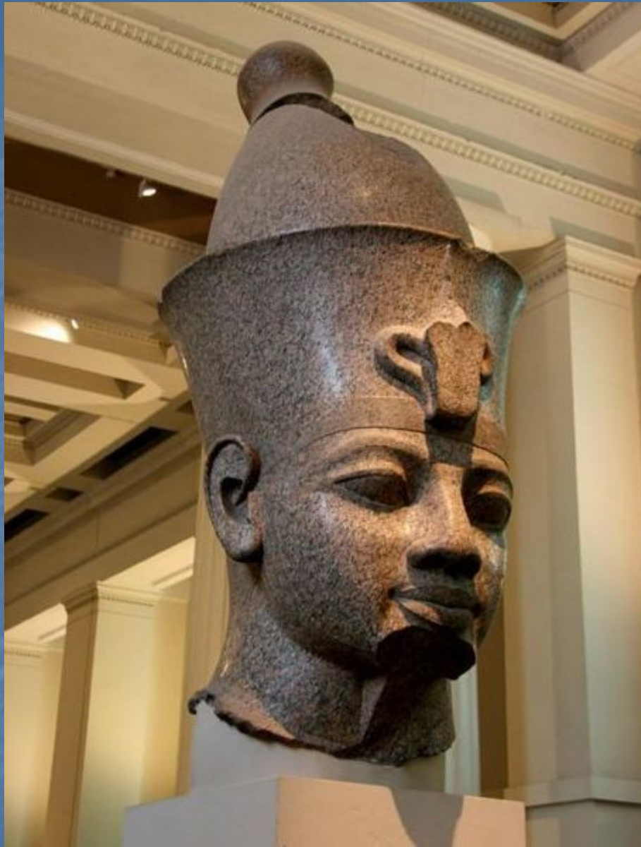
Статуя Аменхотепа 3. Базальт. 19 в. до н. э.