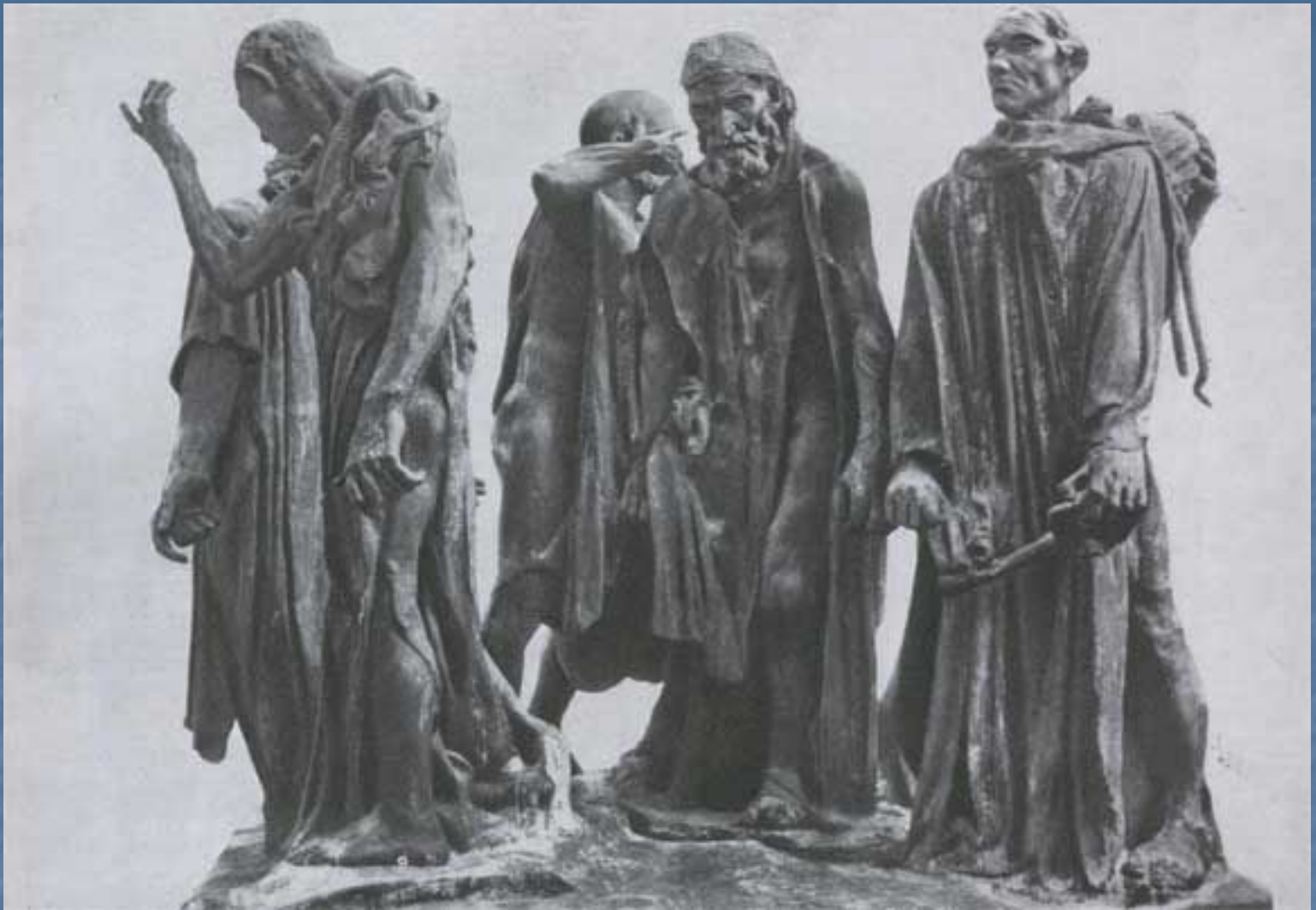
Роден. О. Граждане Кале. Бронза. 1884-1888. Скульптурная группа, установленная на площади Кале, напоминает о мужестве и чести его граждан.