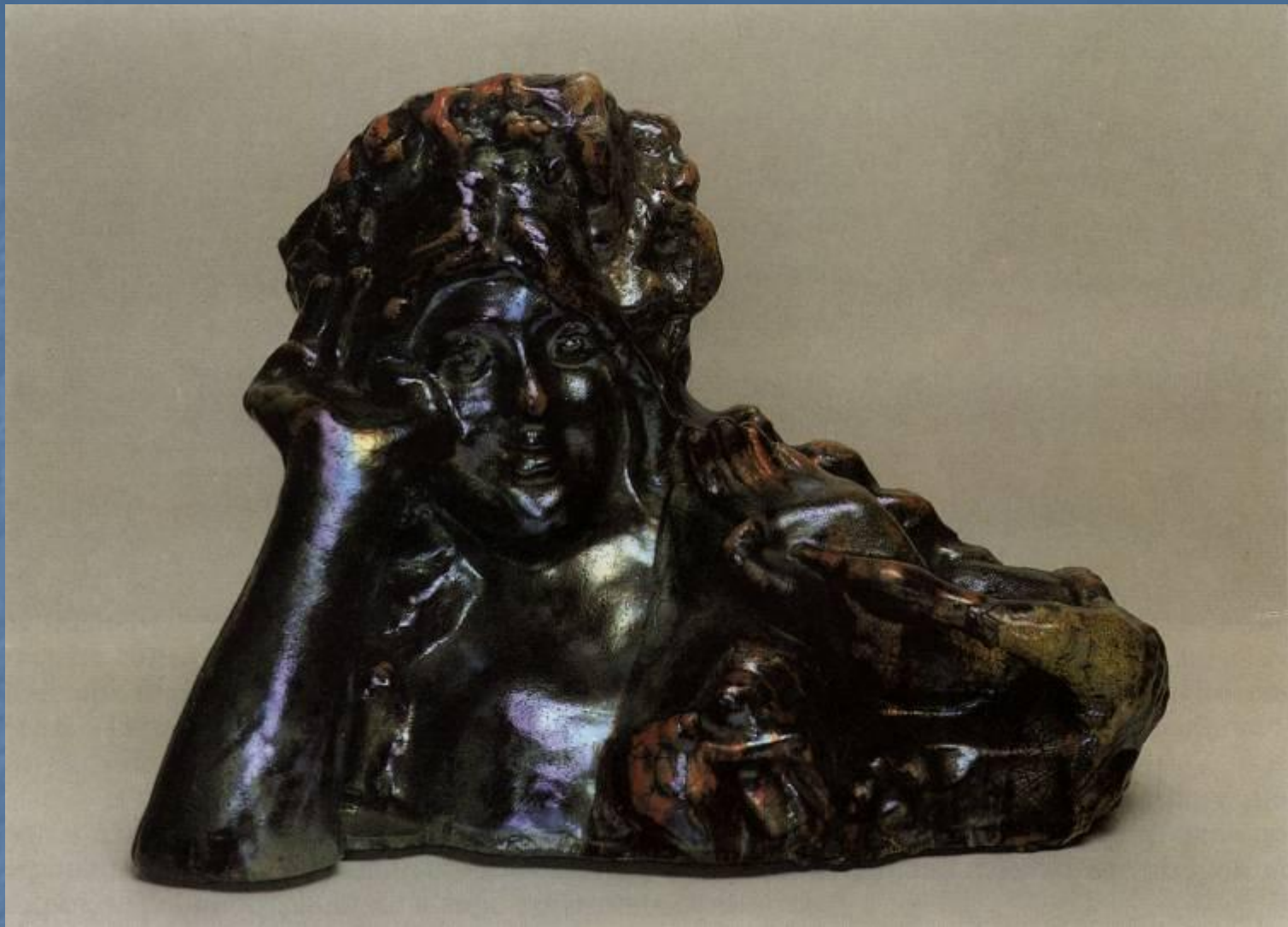
Врубель М. А. Весна. Майолика. Начало 20 в. В этой скульптуре Врубель запечатлел одну из героинь оперы Римского-Корсакова «Снегурочка».