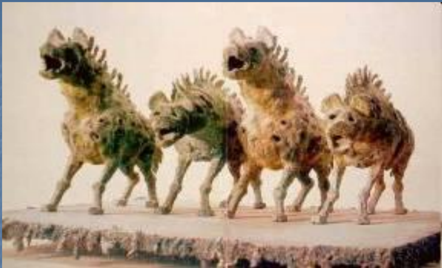
Марц А. В. Гиены.