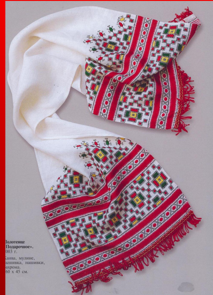
Полотенце «Подарочное». 003 г.

В элементах орнамента чувашской вышивки ученые-исследователи обнаружили знаки древней письменности. Изображения бытия в виде Древа жизни и первобытные понятия о Земле, небесном своде и светилах претстали здесь в геометрических линиях и пропорциях узорного шитья.