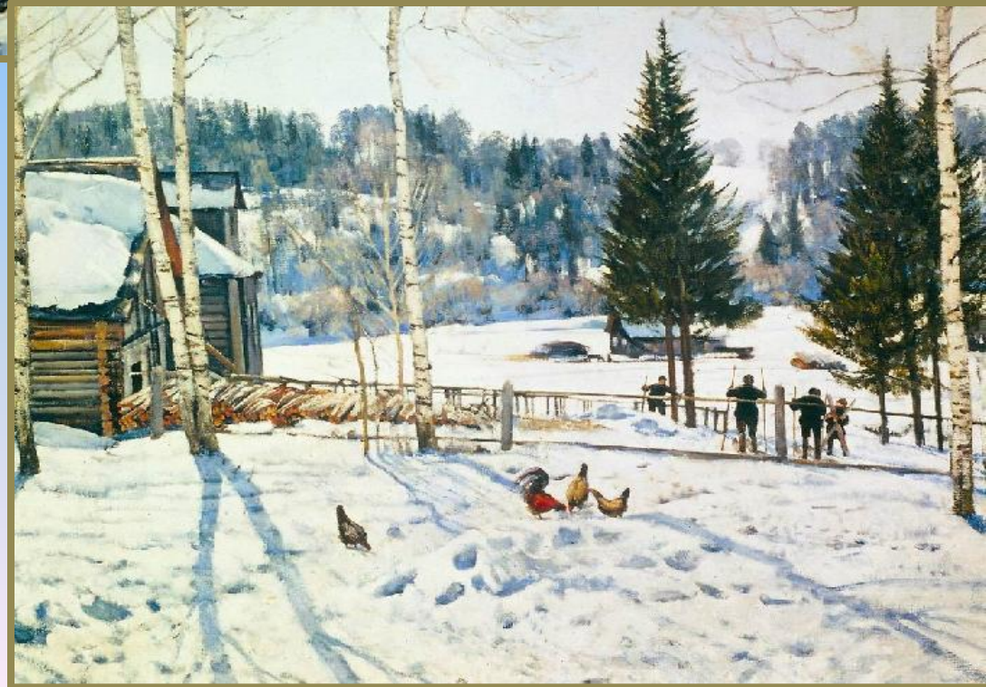
«Весенний солнечный день»