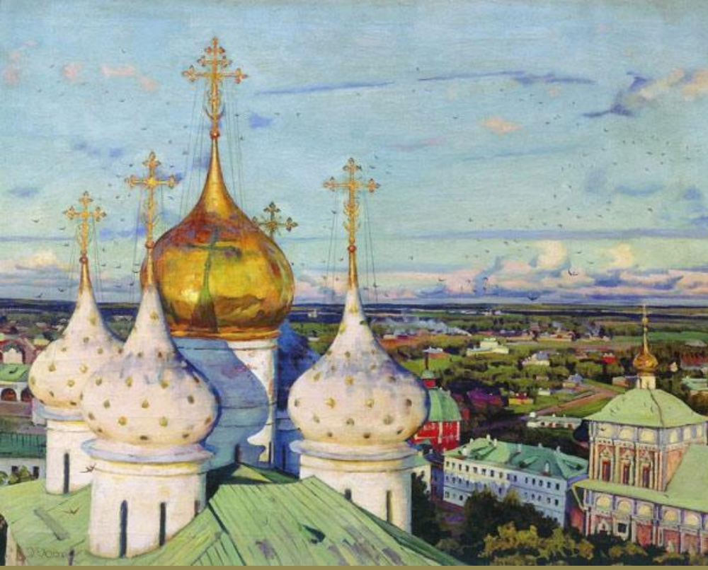
«Купола и ласточки»