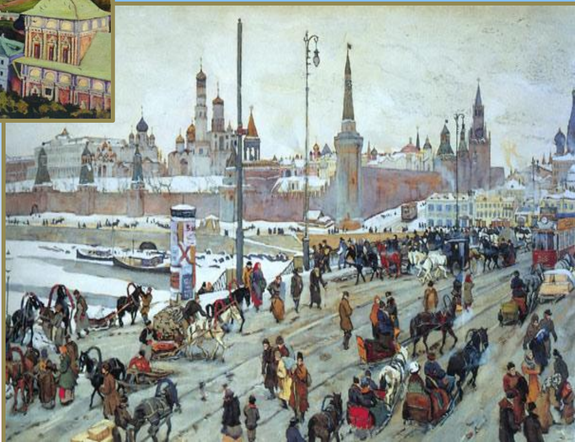
«Москворецкий мост. Старая Москва»