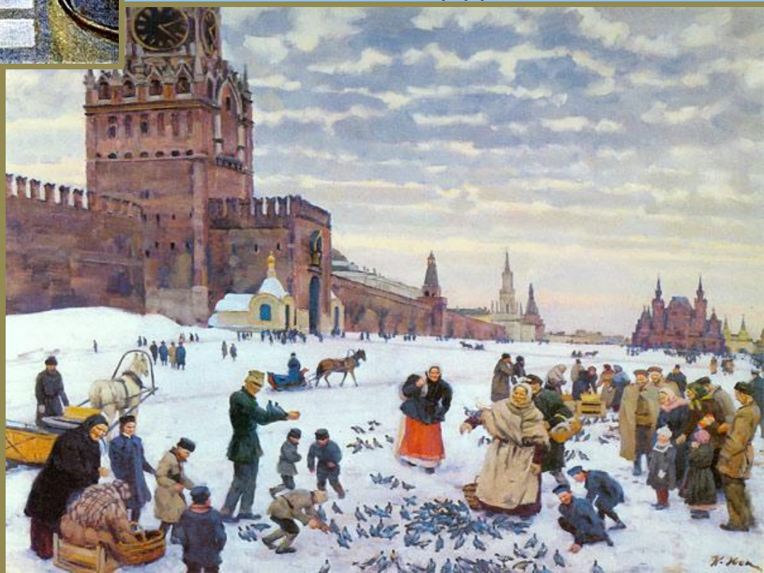
«Кормление голубей на Красной площади»