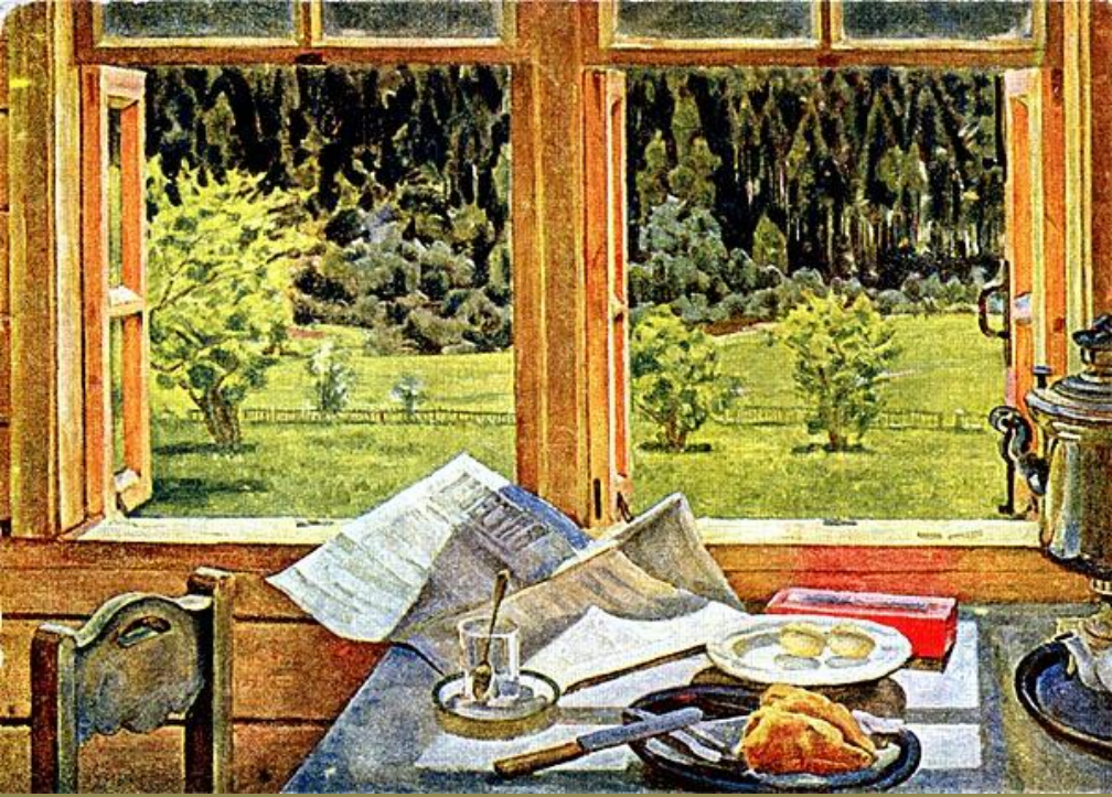
«Окно в природу»