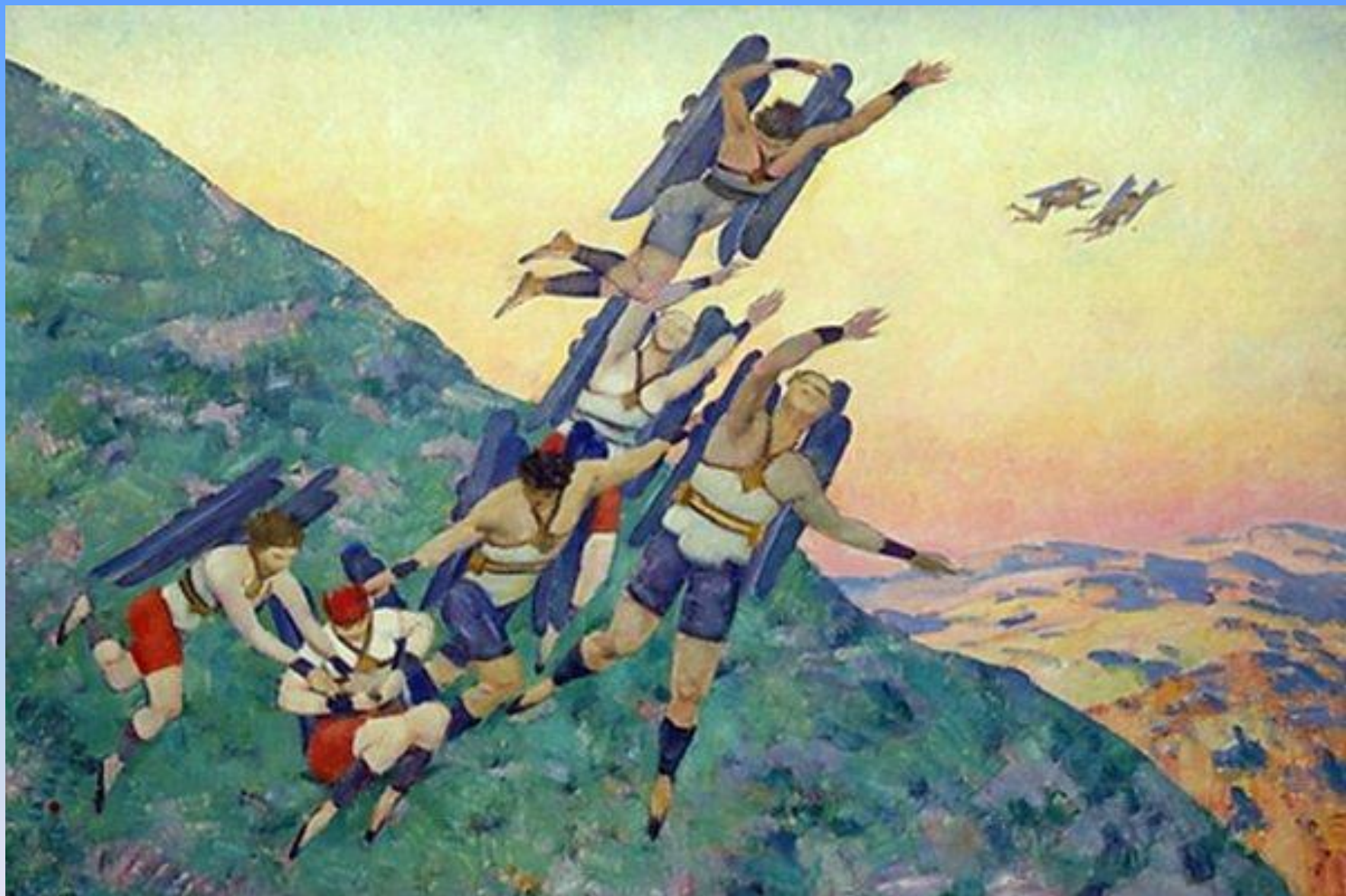
К.Ф.Юон «Люди будущего»