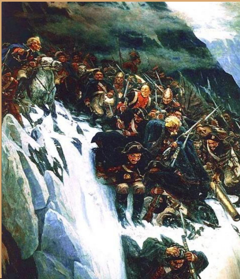
Переход Суворова через Альпы. 1899.