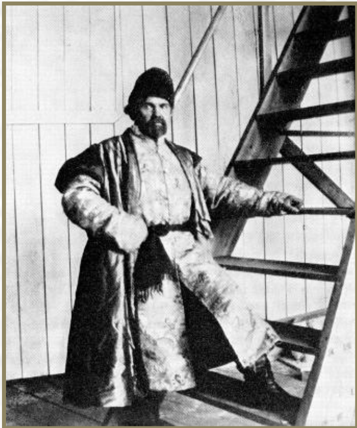
Суриков во время работы над картиной "Степан Разин". Фотография 1906 г.