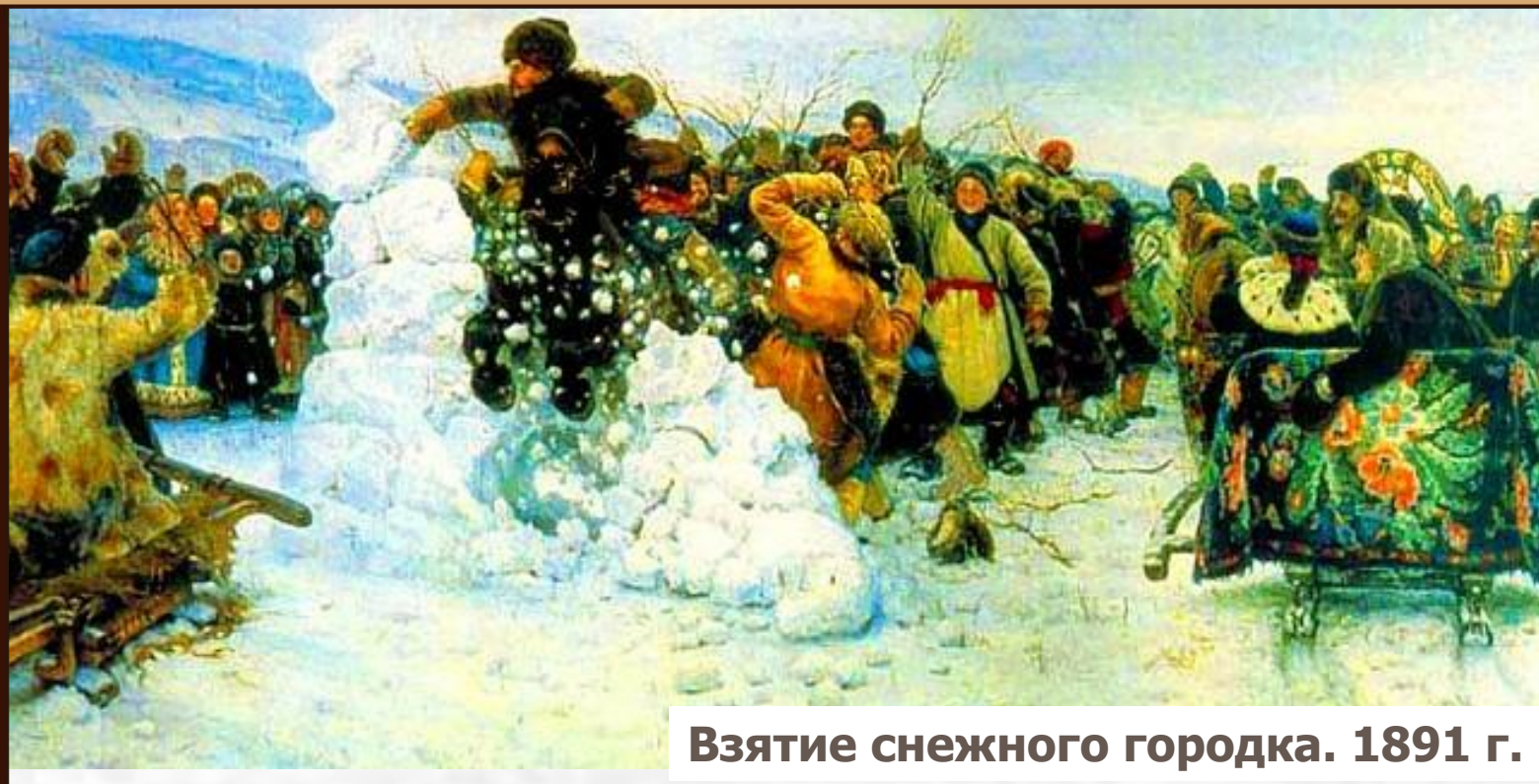
Взятие снежного городка. 1891 г.