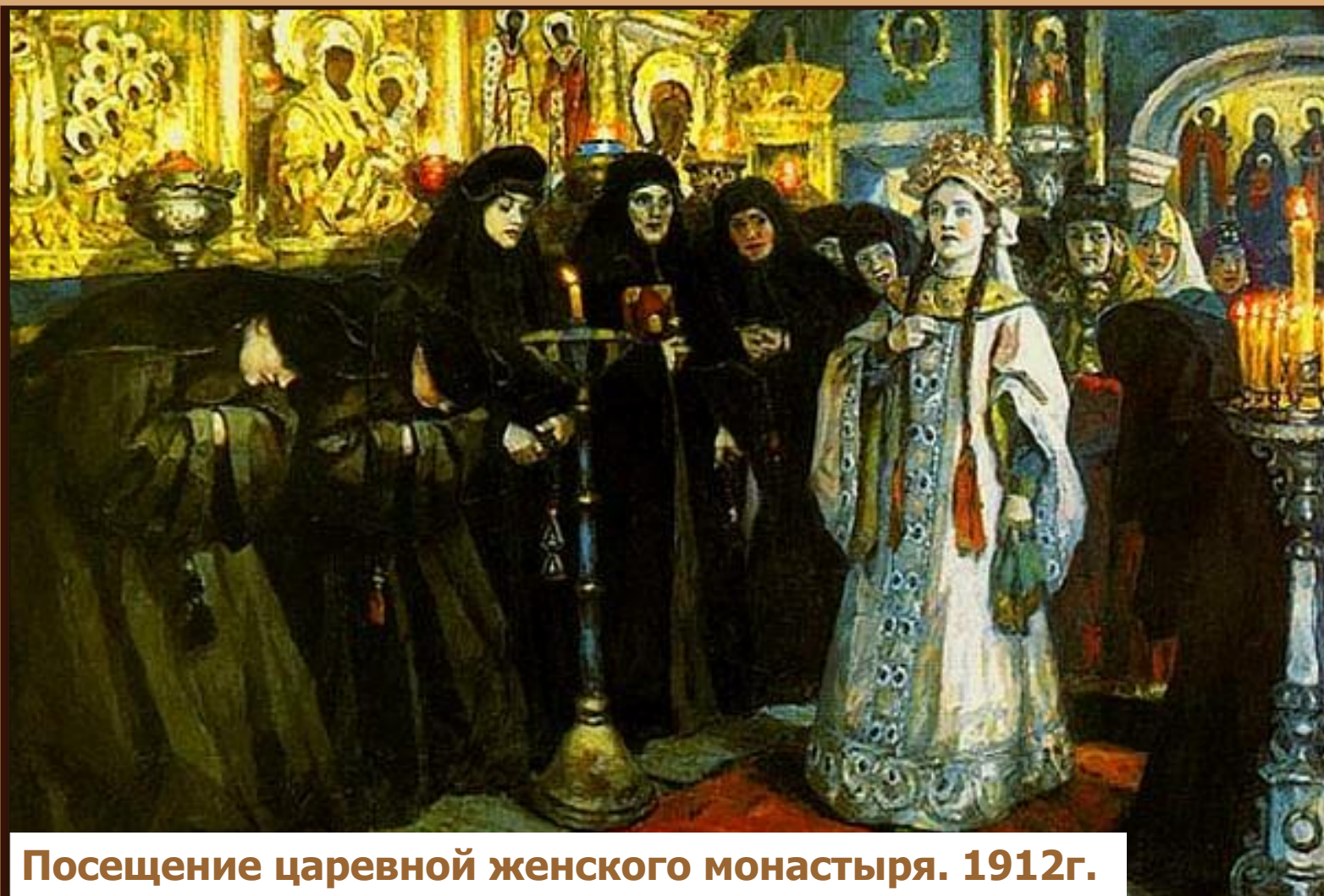
Посещение царевной женского монастыря. 1912г.