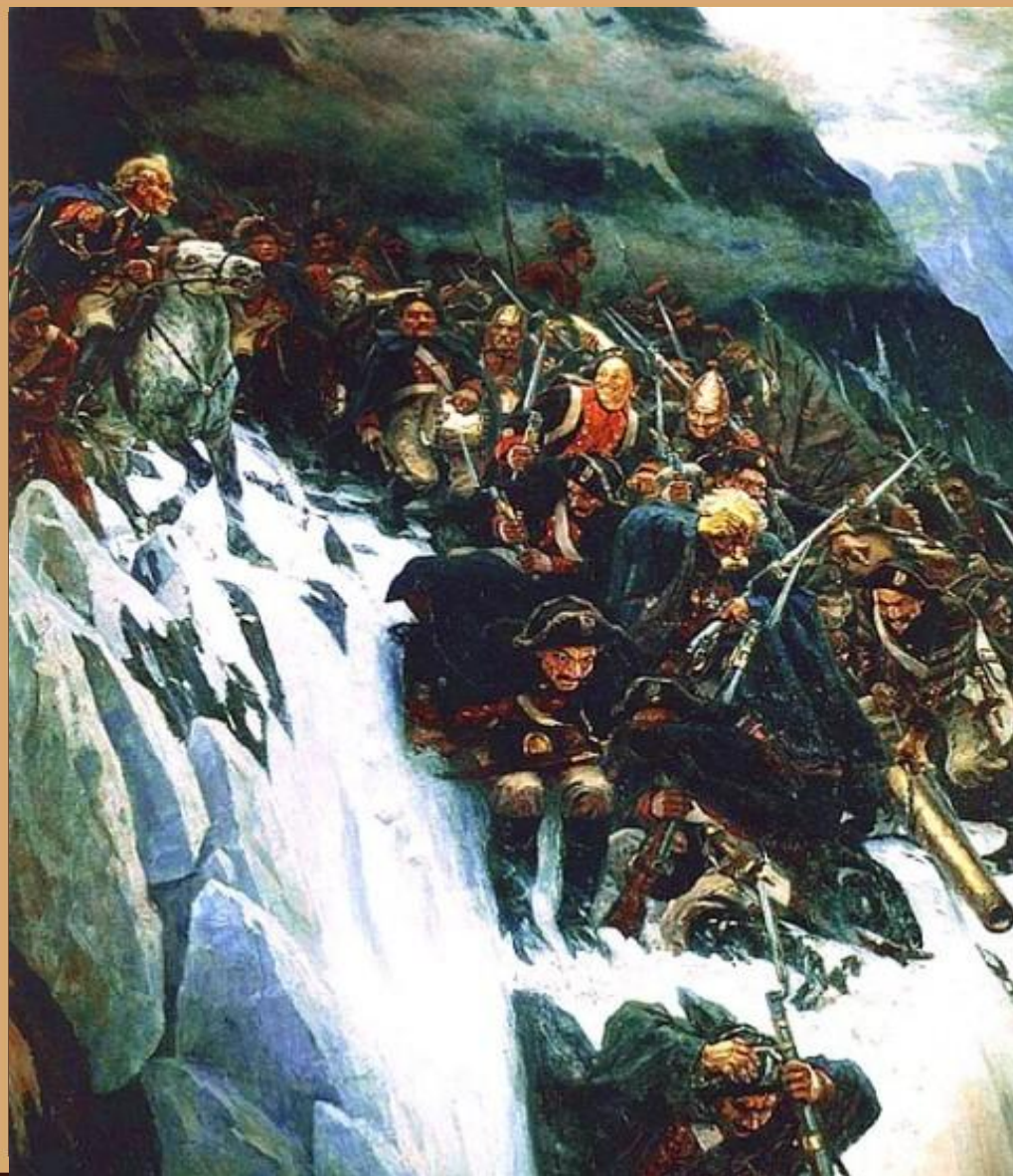
Переход Суворова через Альпы. 1899.