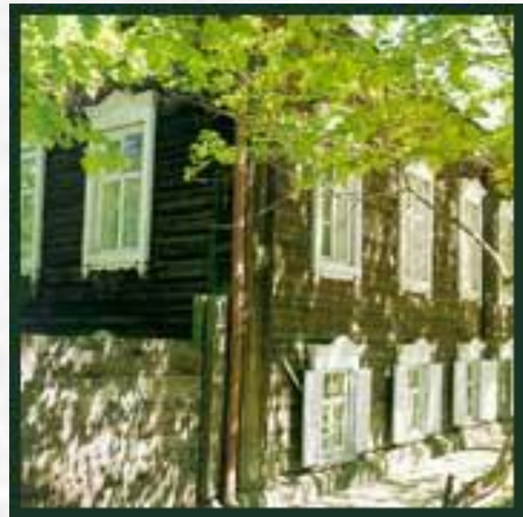
Дом – усадьба Сурикова