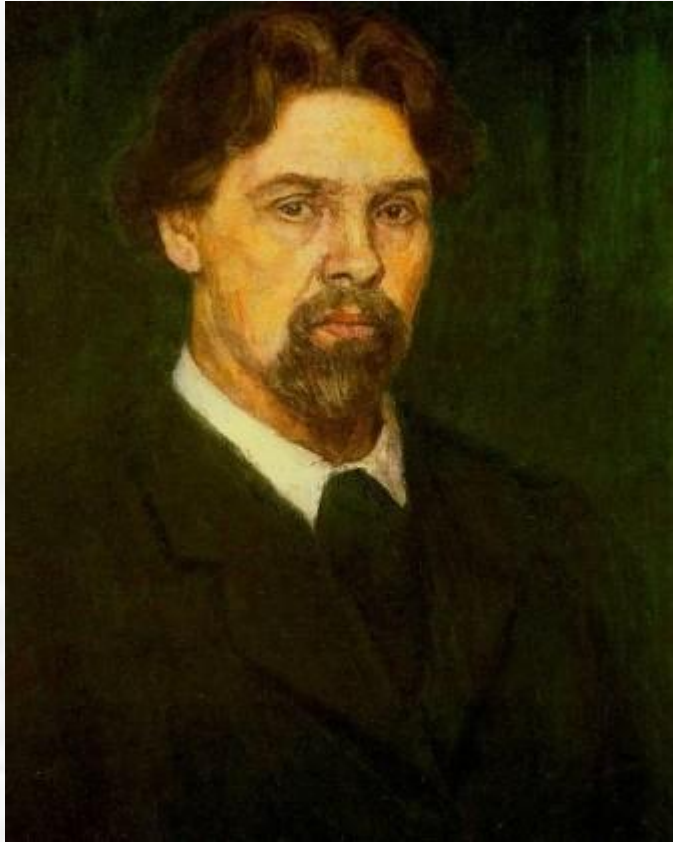
Суриков В.И. Автопортрет. 1913