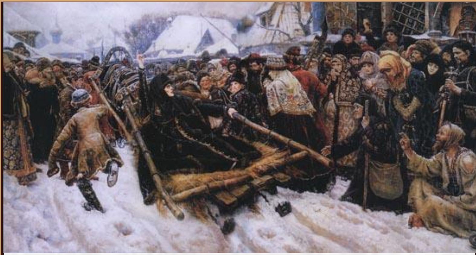
Боярыня Морозова. 1887г.