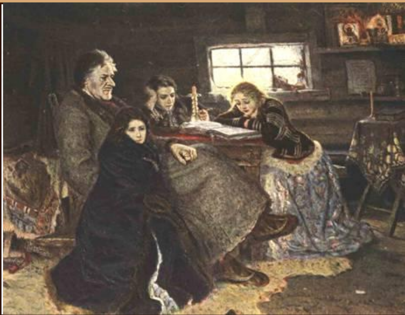
Меншиков в Березове. 1883.