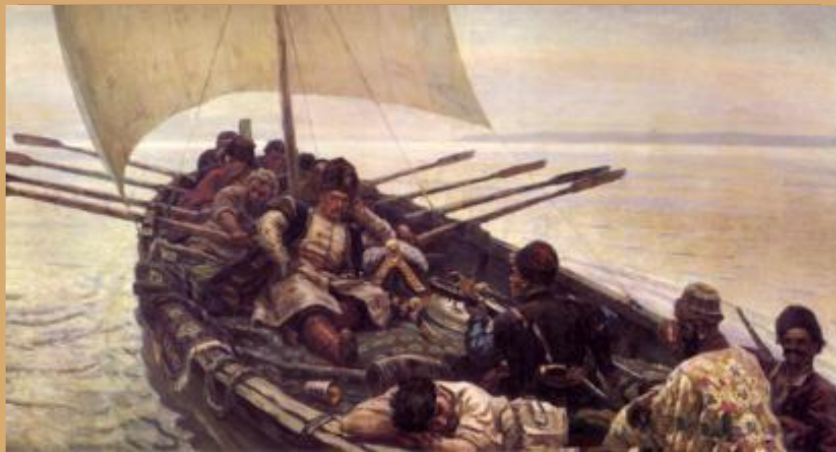
Степан Разин. 1906.