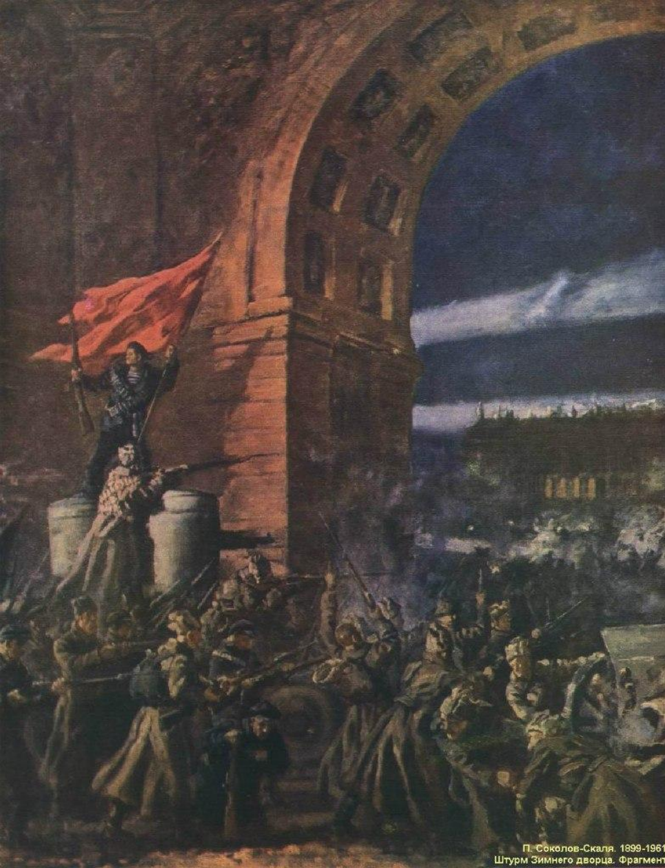
П. Соколов-Скаля. 1999-1961 Штурм Зимнего дворца. Фрагмент