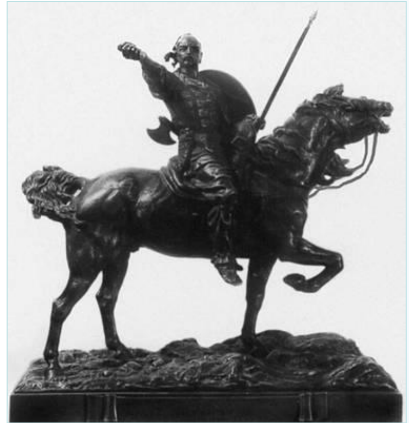
Е. А. Лансере «Святослав»