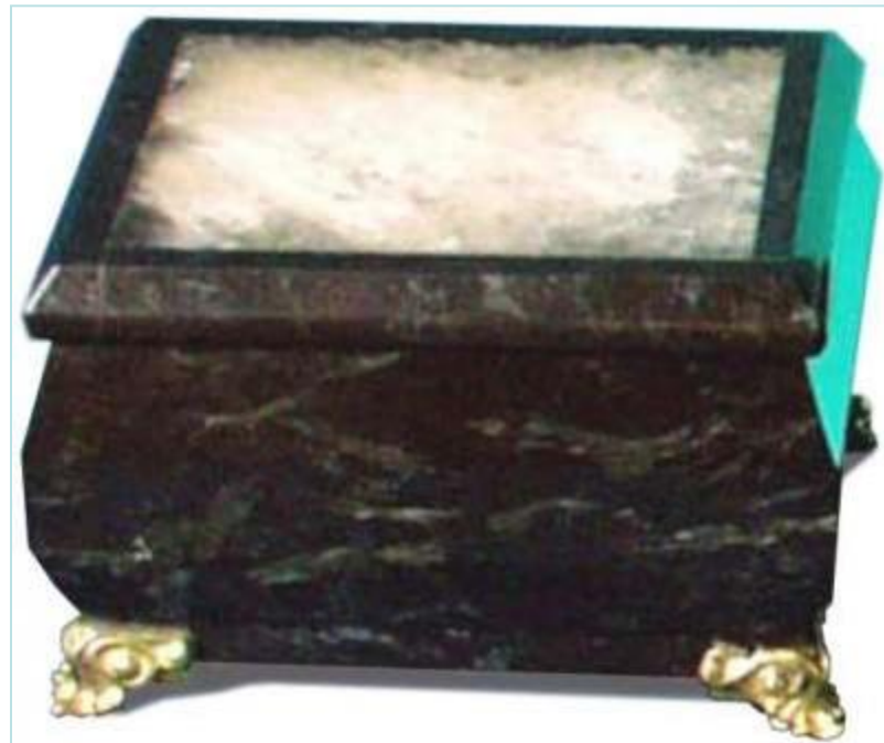
Шкатулка. Змеевик, флюорит

Традиции уральского камнерезного дела не были потеряны и забыты в потоке времени: передаваясь из поколения в поколение, они были бережно сохранены местными мастерами.