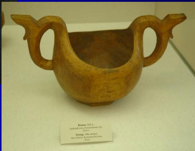
Кувалда XIX в. Булканий јазол, Костурински музеј, Скопје. Scopje, 19th century Bulky handle, Kosturina Museum Maced.