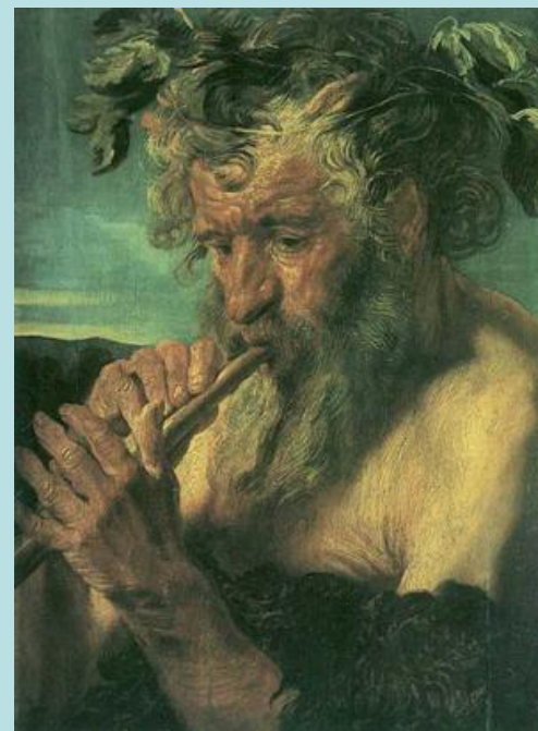
Якоб Йорданс Сатир играющий на флейте 1620-21 г.г. А...