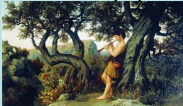
Генрих Семирадский — Пастушок, играющий на свирели