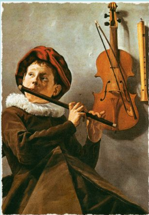
Юдифь Лейстер. Мальчик, играющий на флейте.