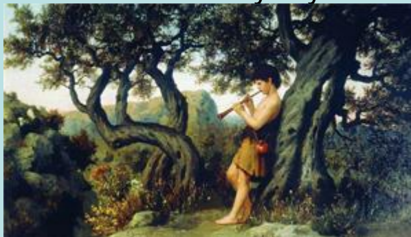
Генрих Семирадский — Пастушок, играющий на свирели