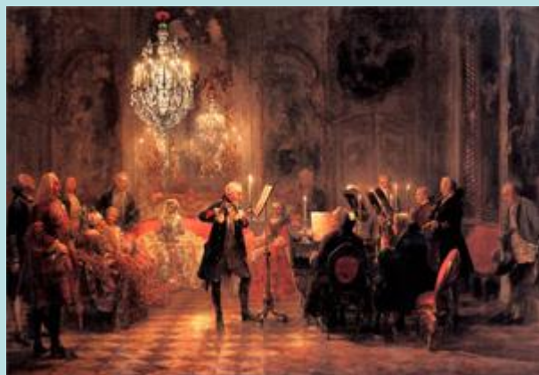
Адольф фон Мензель — Концерт для флейты в исполнении Фридриха Великого в Сансусси