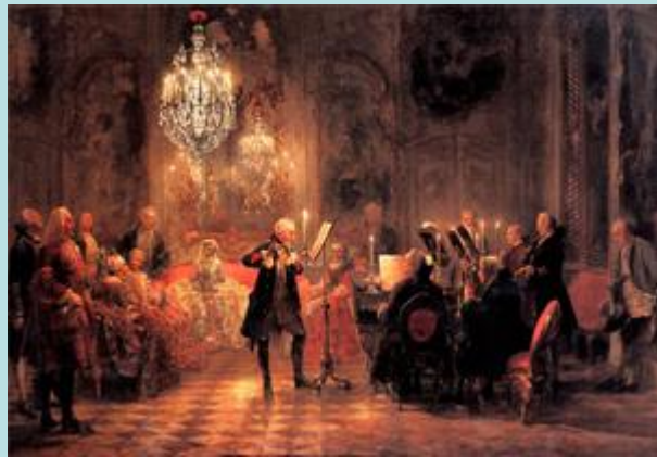
Адольф фон Мензель — Концерт для флейты в исполнении Фридриха Великого в Сансусси