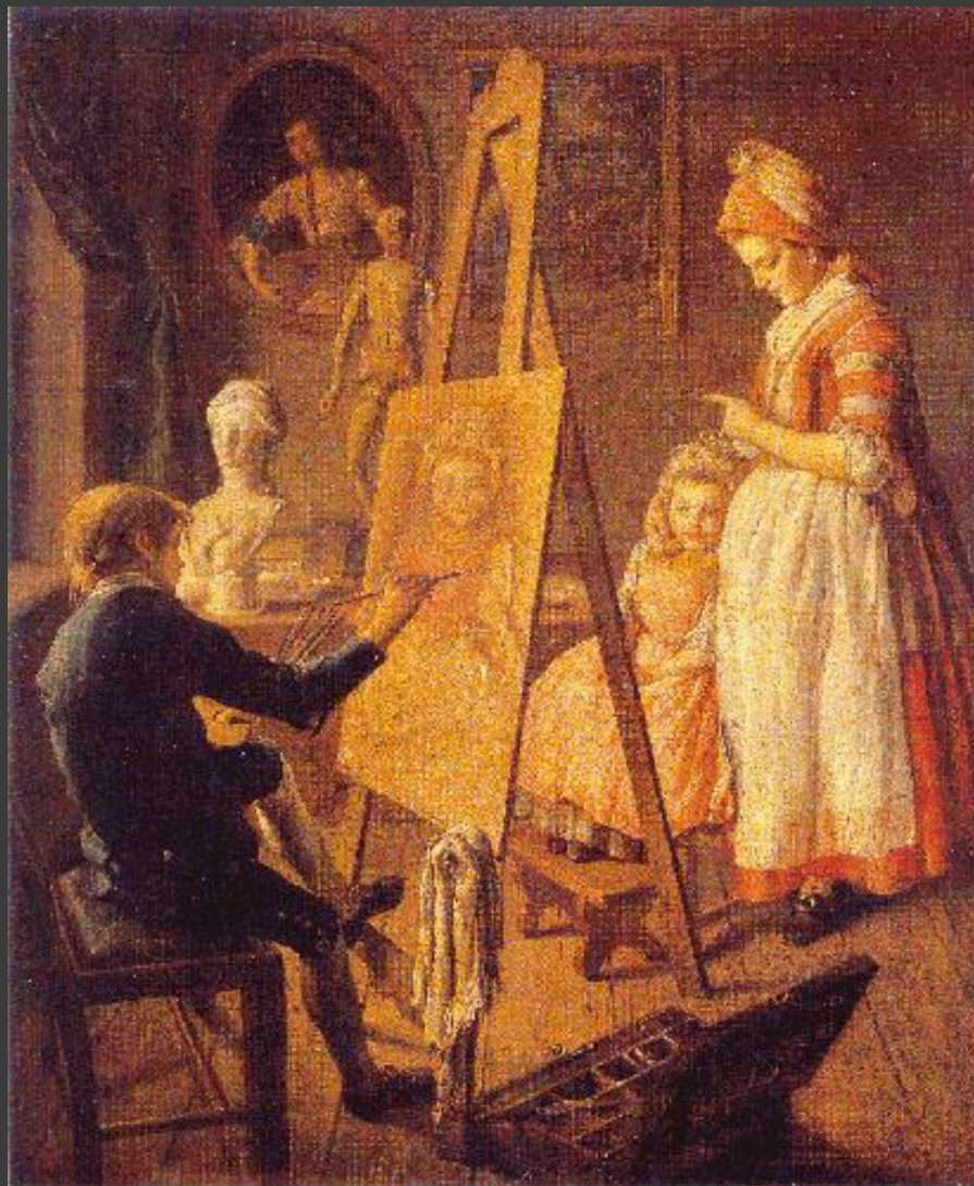
Фирсов «Юный художник»

http://www.ynpress.ru/c/hild-art/img/013.jpg