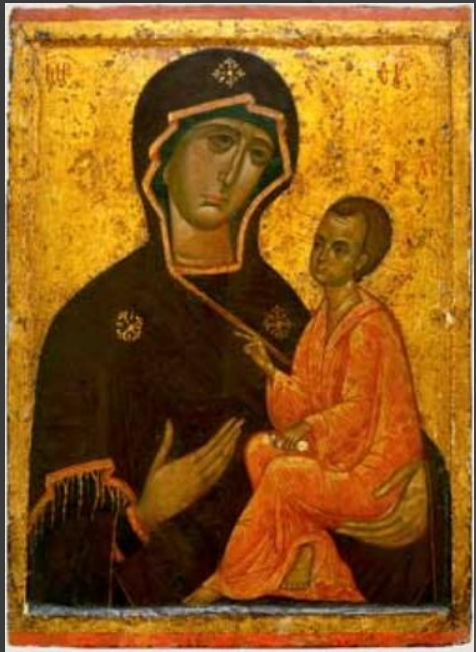
Тихвинская Божья Матерь