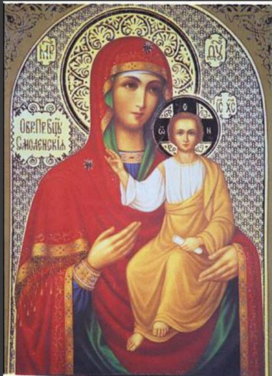
Икона Смоленской Божьей Матери