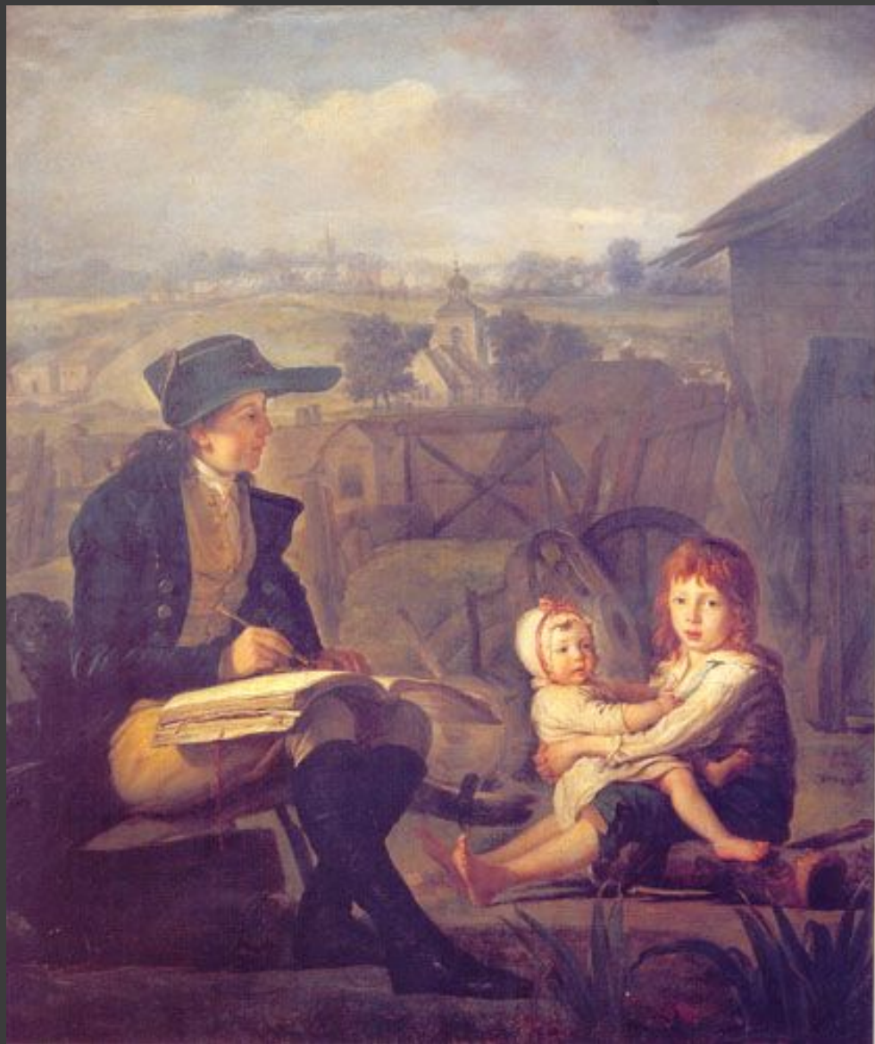
. Квадаль. Юный художник