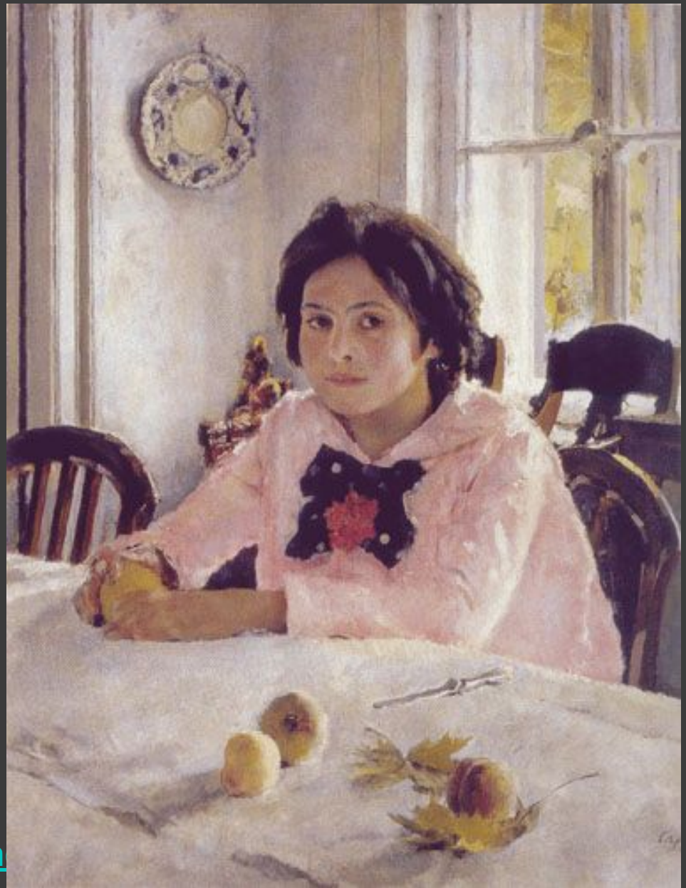
Серов. Девочка с персиками