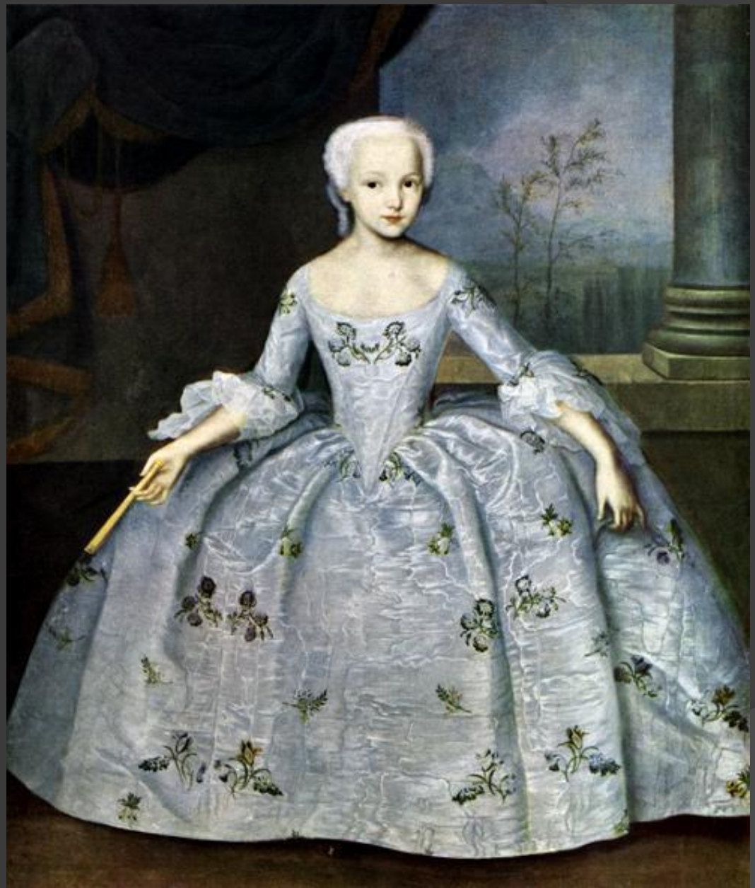
Вишняков Портрет Сары Фермор

http://artclassic.edu.ru/catalog.asp?cat_ob_no=&ob_no=17541&rt=&print=1