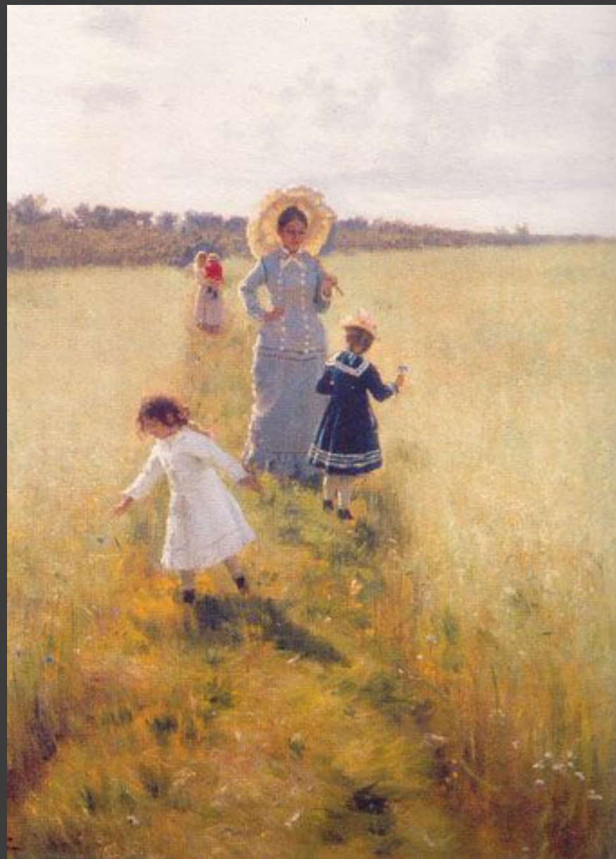
Репина с детьми

http://www.ynpress.ru/child-art/img/026.jpg